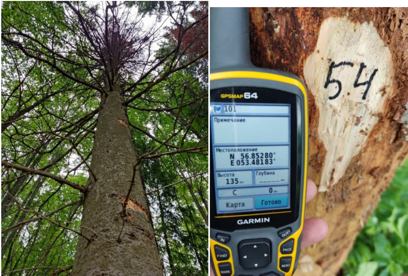
Аварийное дерево № 54

Координаты 56.85280, 53.48183. Дата 22.08.2022г