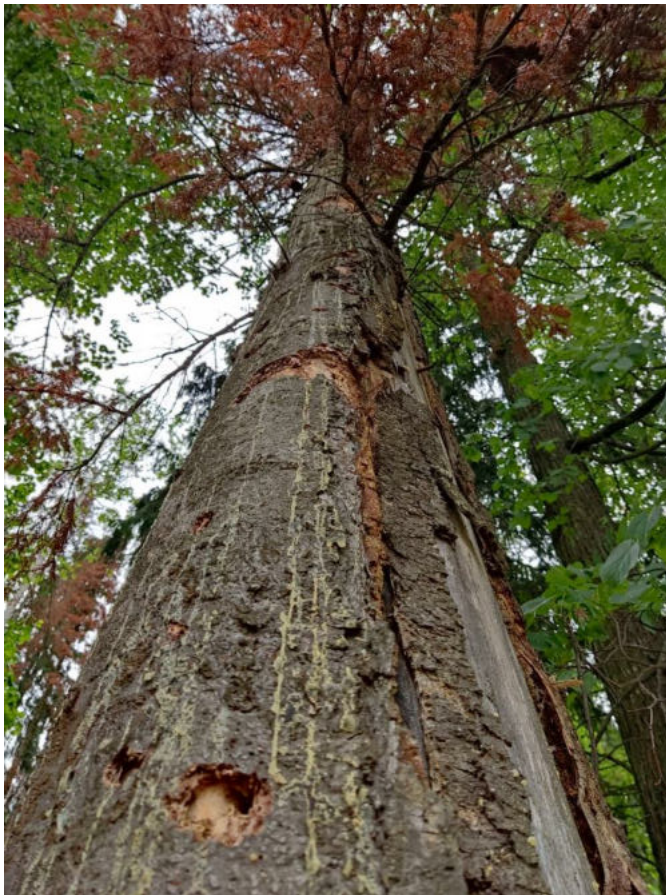
Аварийное дерево № 68