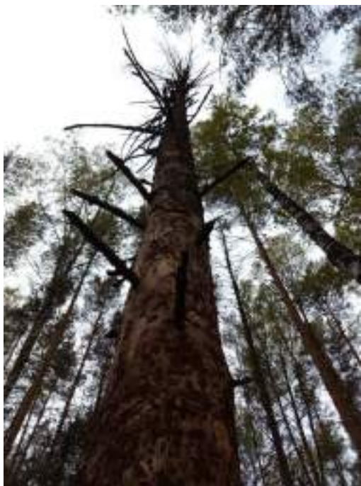
Аварийное дерево №2