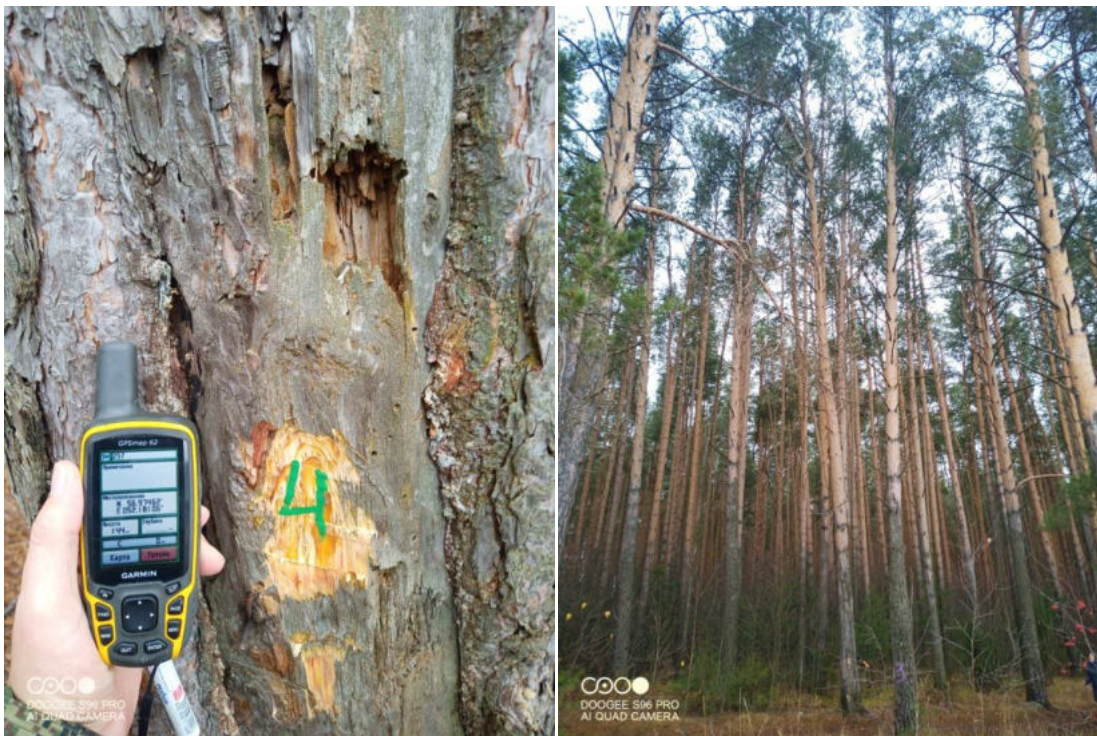
Фото № 4

Координаты 56.97462 52.18106 фотосъемка произведена 01.11.2022