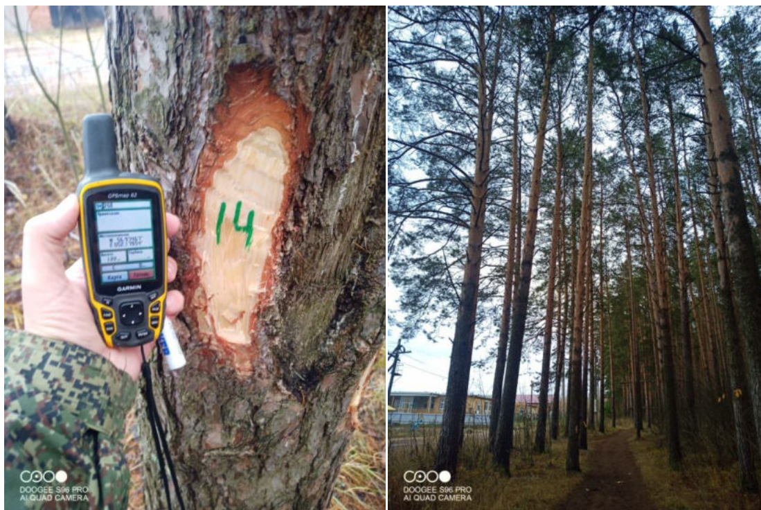
Координаты 56.97467 52.17954 фотосъемка произведена 01.11.2022