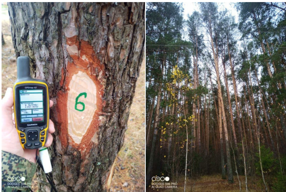
Фото № 6

Координаты 56.97461 52.18056 фотосъемка произведена 01.11.2022