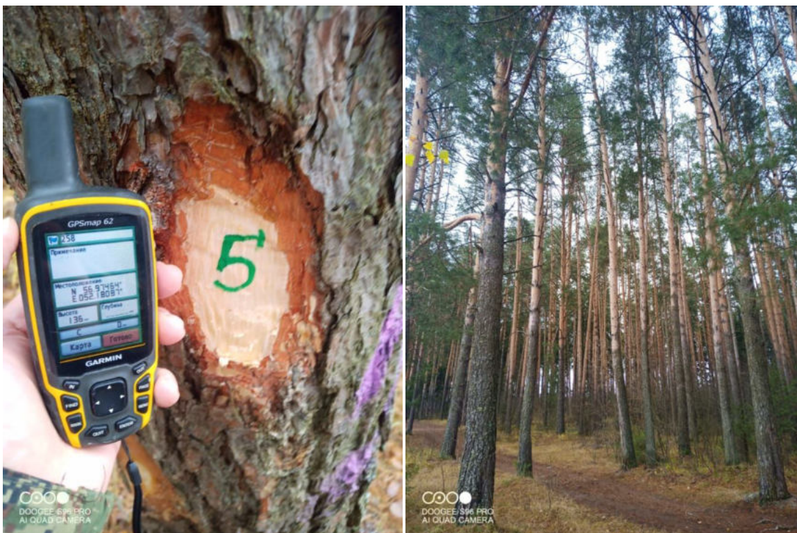
Фото № 5

Координаты 56.97464 52.18087 фотосъемка произведена 01.11.2022