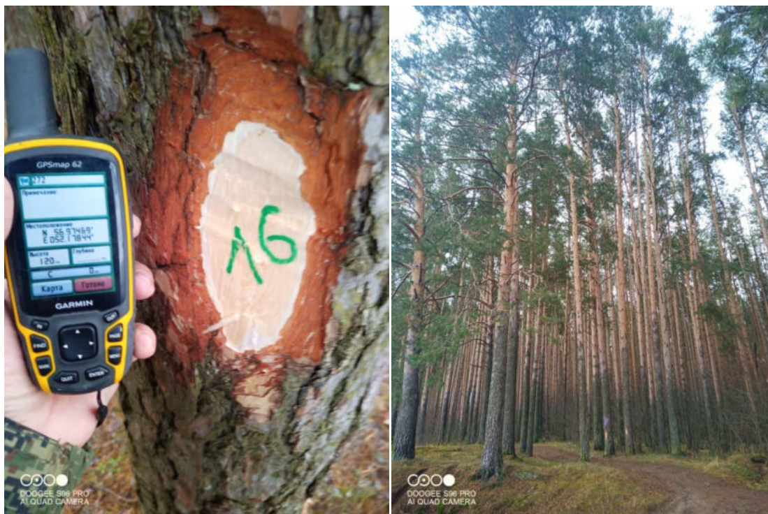
Координаты 56.97469 52.17844 фотосъемка произведена 01.11.2022