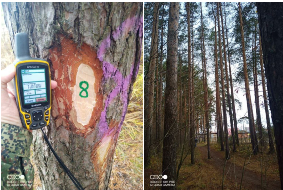
Координаты 56.97465 52.18038 фотосъемка произведена 01.11.2022