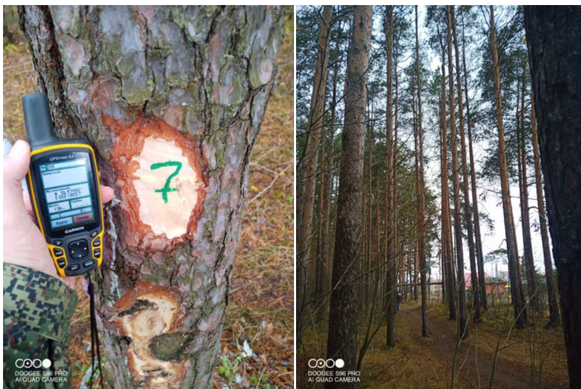
Фото № 7

Координаты 56.97455 52.18057 фотосъемка произведена 01.11.2022