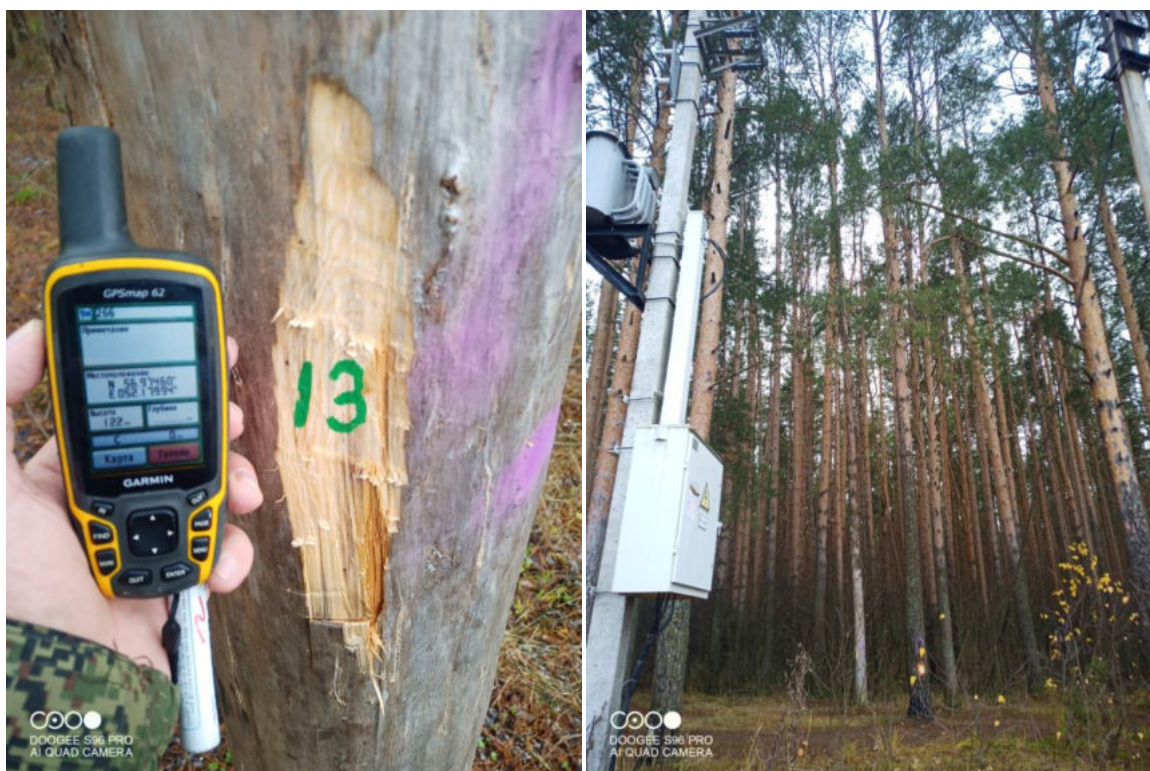
Координаты 56.97460 52.17994 фотосъемка произведена 01.11.2022