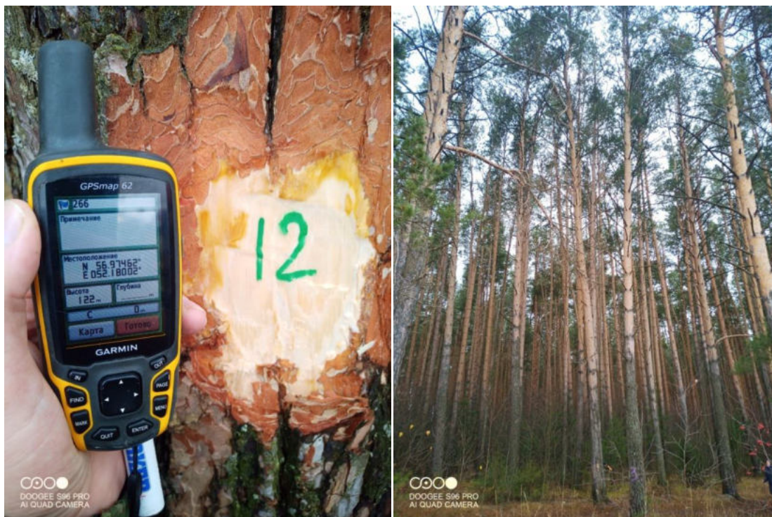
Координаты 56.97462 52.18002 фотосъемка произведена 01.11.2022