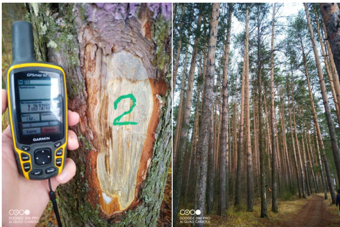
Координаты 56.97454 52.18143 фотосъемка произведена 01.11.2022