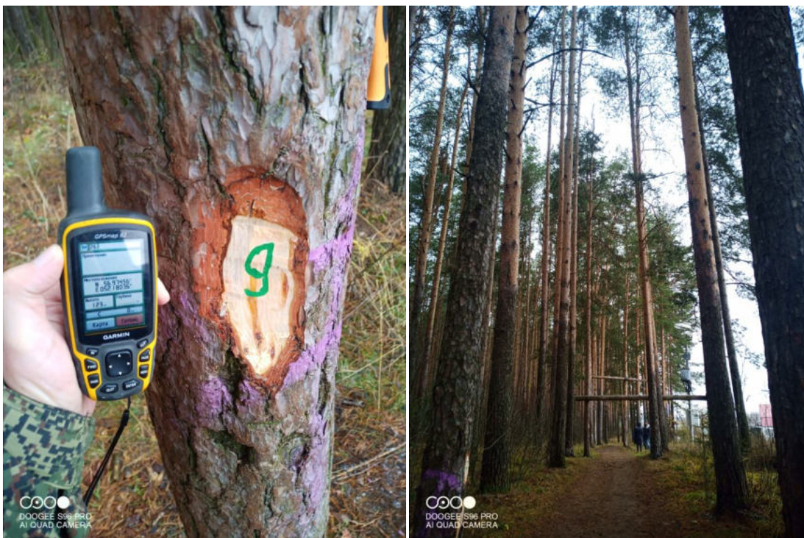
Координаты 56.97456 52.18036 фотосъемка произведена 01.11.2022