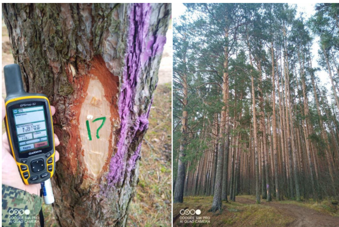
Координаты 56.97475 52.17838 фотосъемка произведена 01.11.2022