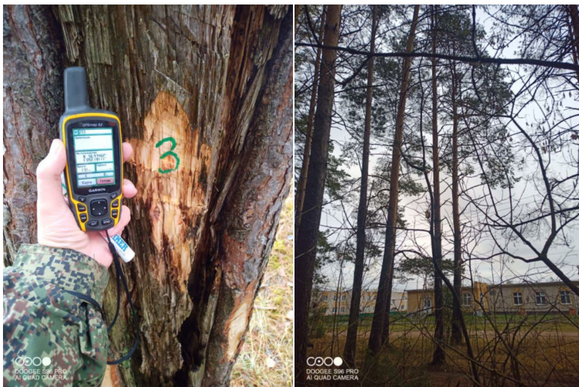
Координаты 56.97462 52.18111 фотосъемка произведена 01.11.2022