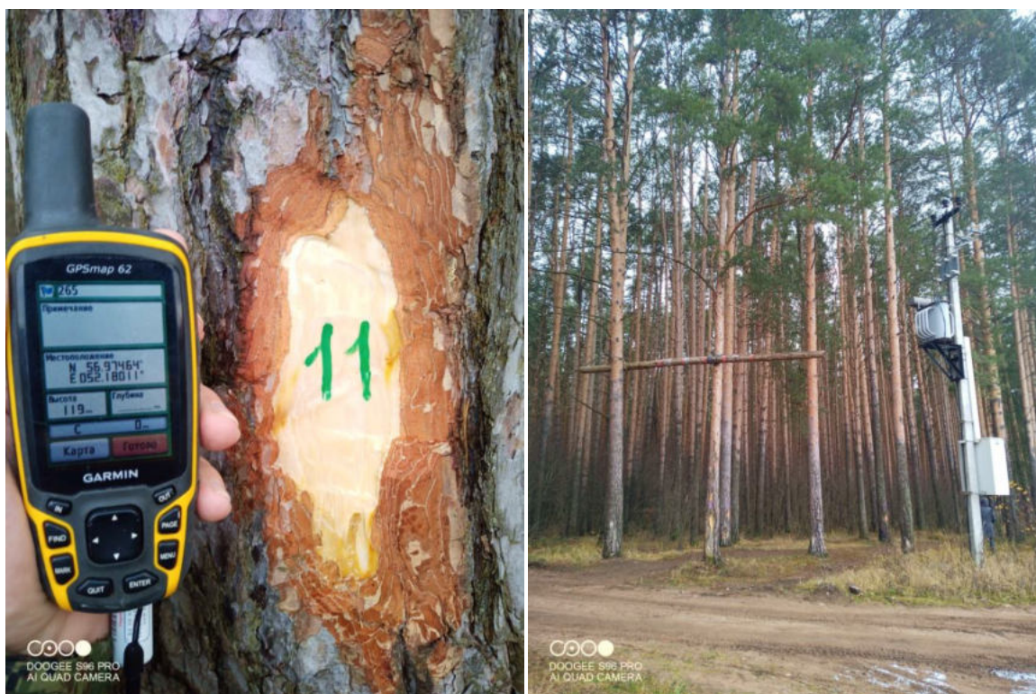
Координаты 56.97464 52.18011 фотосъемка произведена 01.11.2022