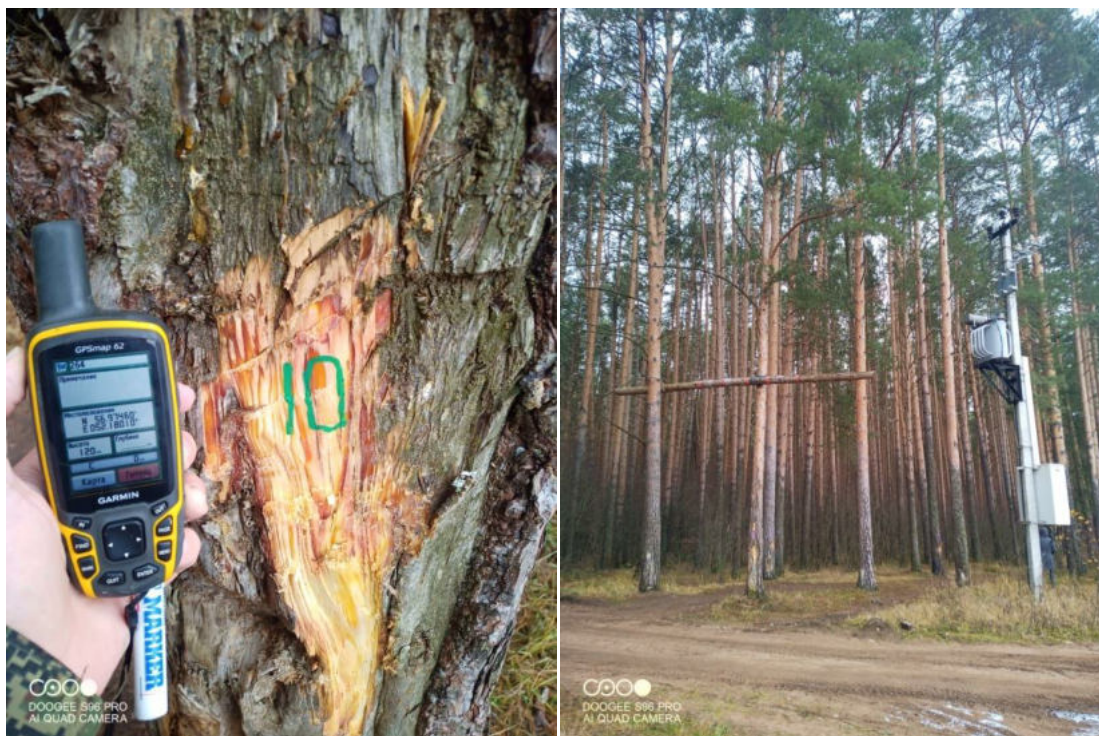
Координаты 56.97460 52.18010 фотосъемка произведена 01.11.2022