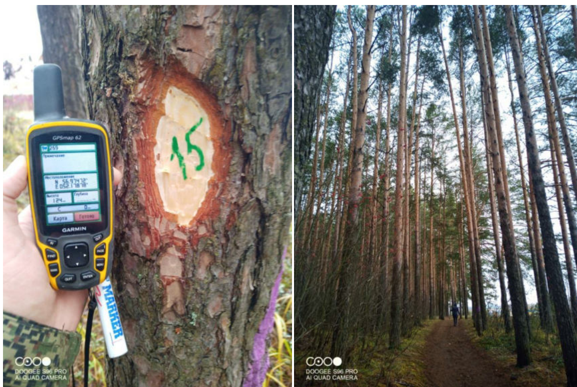
Координаты 56.97472 52.17878 фотосъемка произведена 01.11.2022