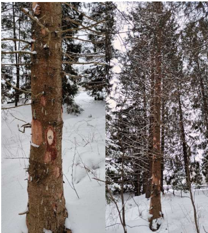
Аварийное дерево № 13