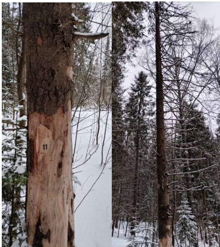
Аварийное дерево № 11