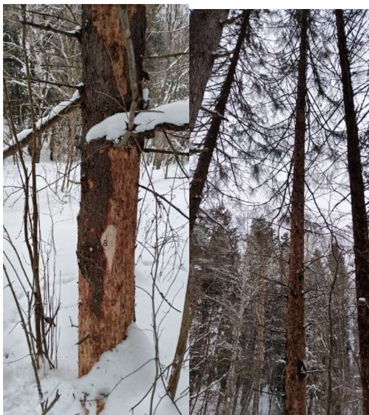
Аварийное дерево № 8