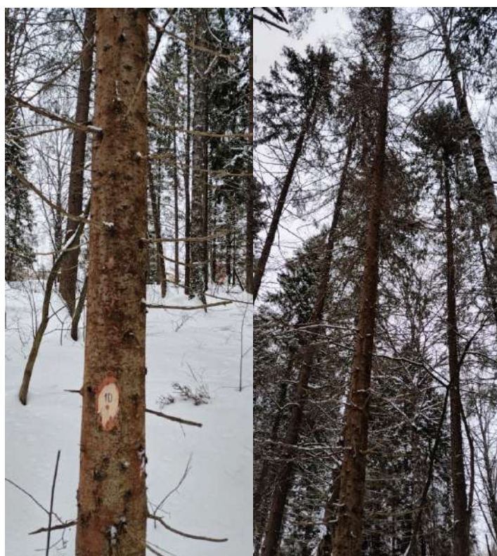
Аварийное дерево № 10