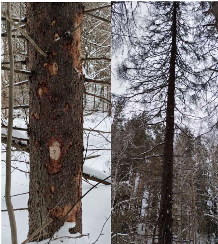
Аварийное дерево № 7