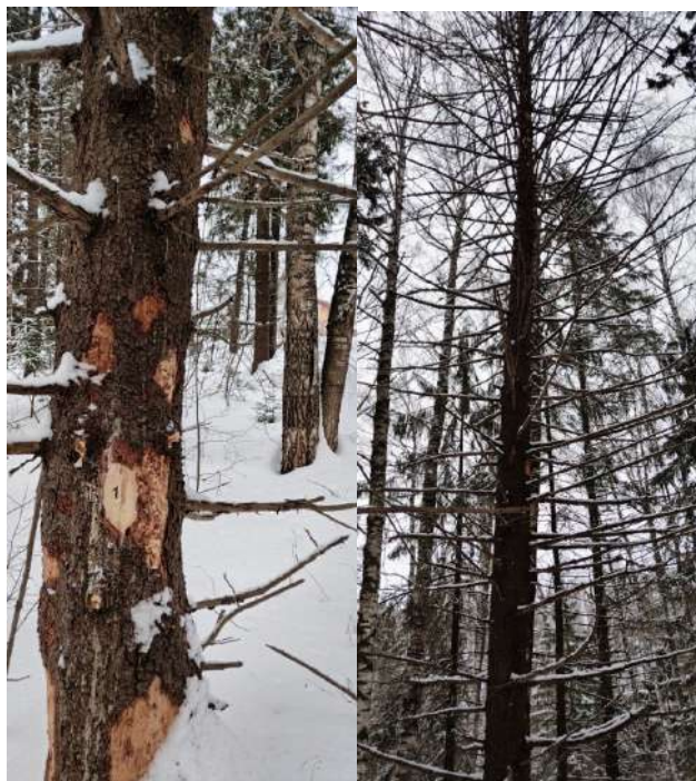
Аварийное дерево № 1