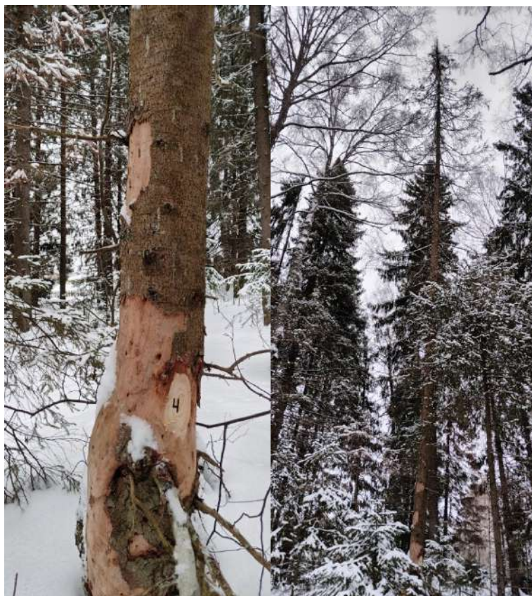
Аварийное дерево № 4