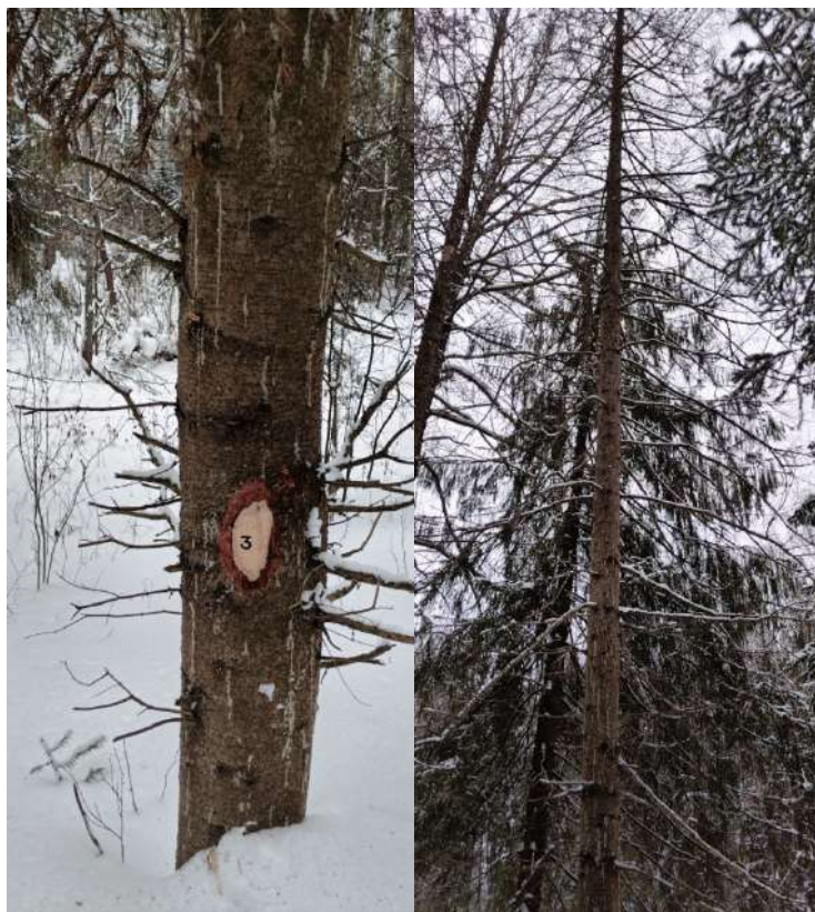
Аварийное дерево № 3