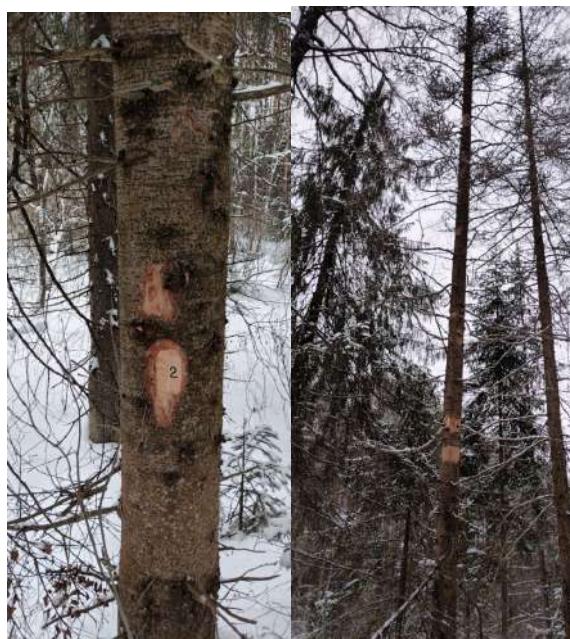
Аварийное дерево № 2