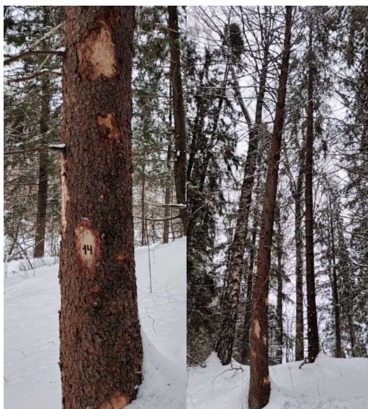
Аварийное дерево № 14