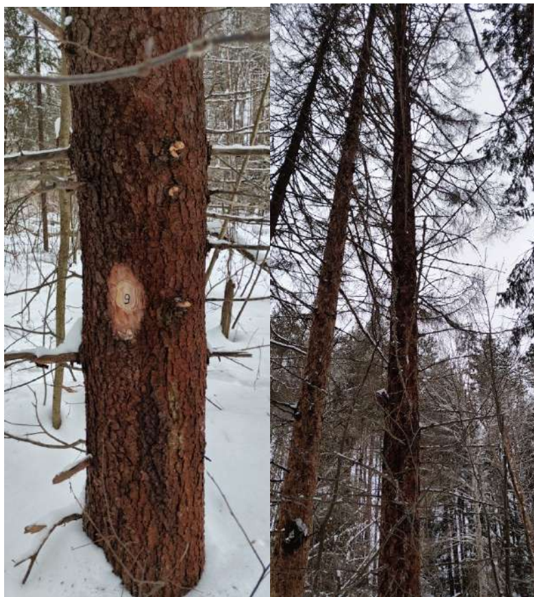
Аварийное дерево № 9