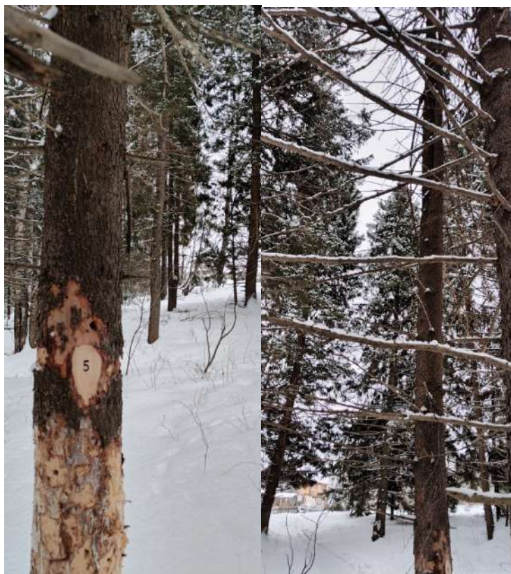
Аварийное дерево № 5