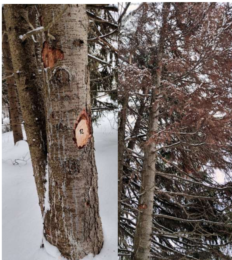
Аварийное дерево № 12