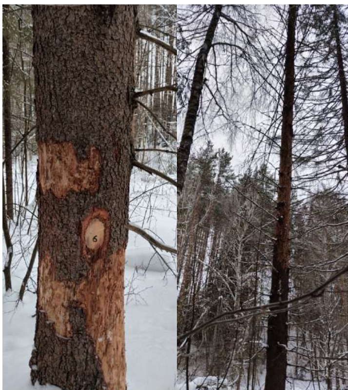
Аварийное дерево № 6