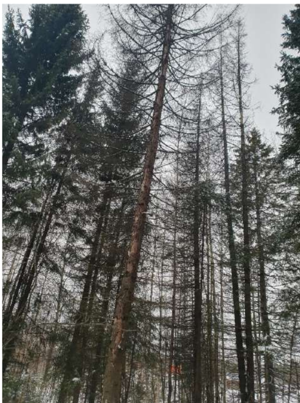
Аварийное дерево №5