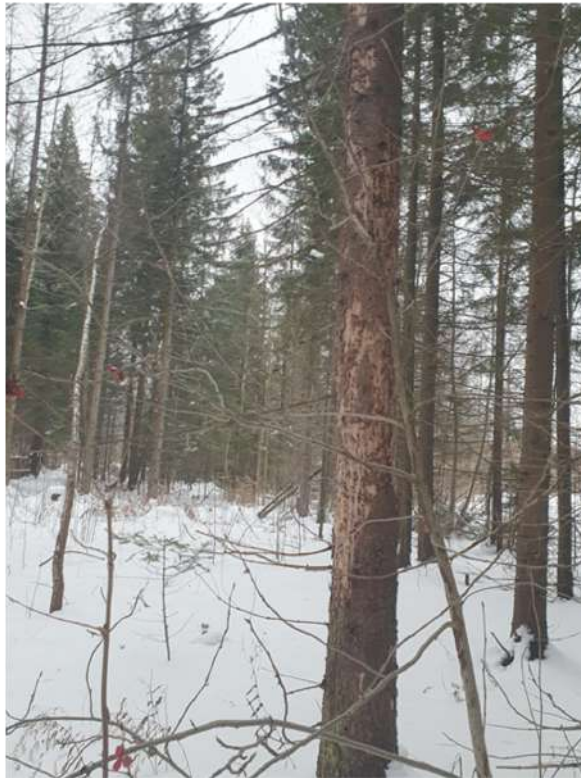
Аварийное дерево №13