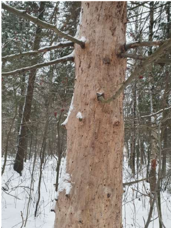
Аварийное дерево №14