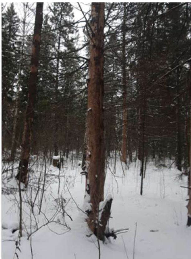
Аварийное дерево №10