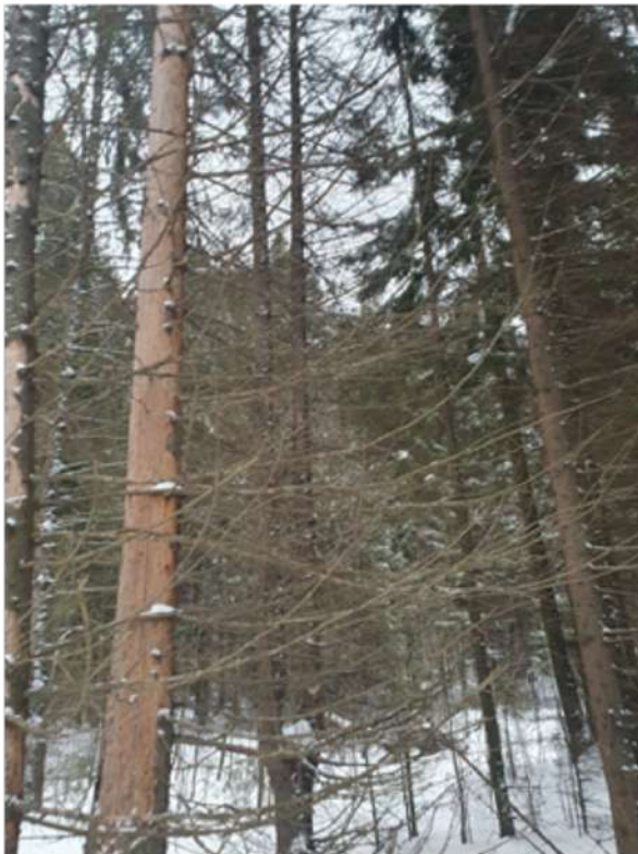
Аварийное дерево №9