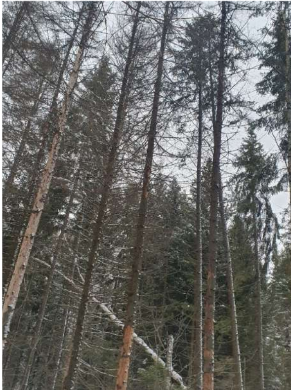
Аварийное дерево №15