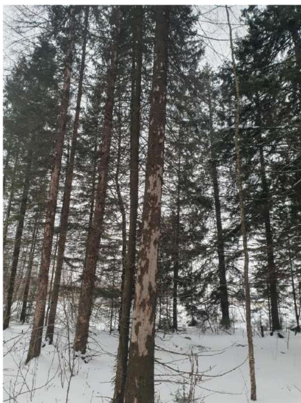
Аварийное дерево №11