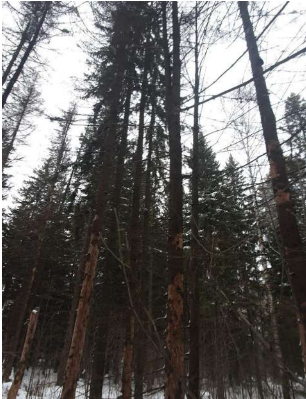
Аварийное дерево №8