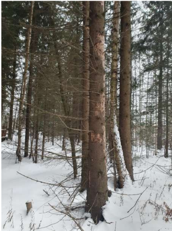
Аварийное дерево №3