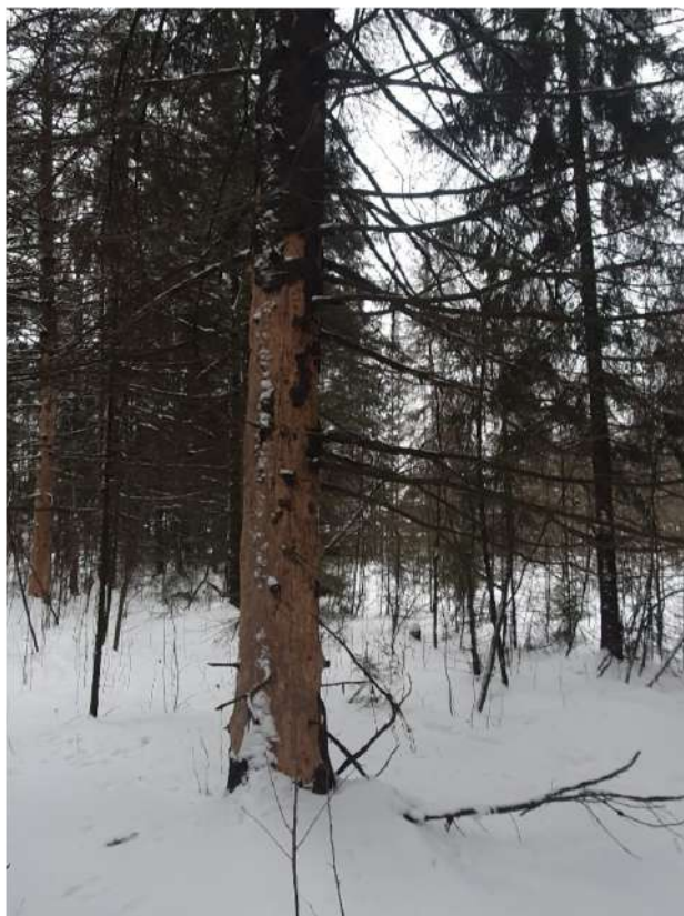
Аварийное дерево №6