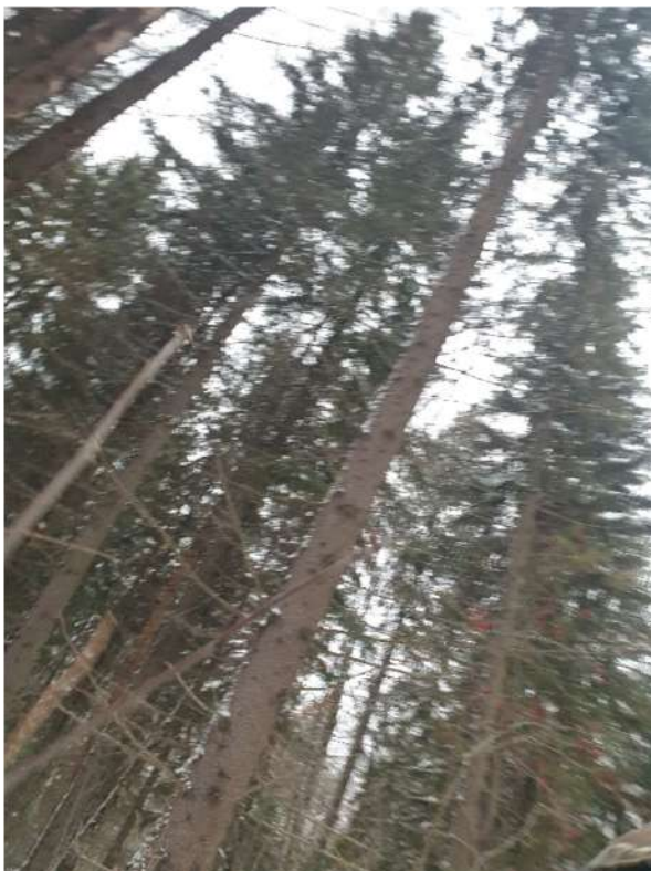
Аварийное дерево №16