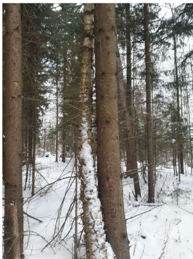
Аварийное дерево №7