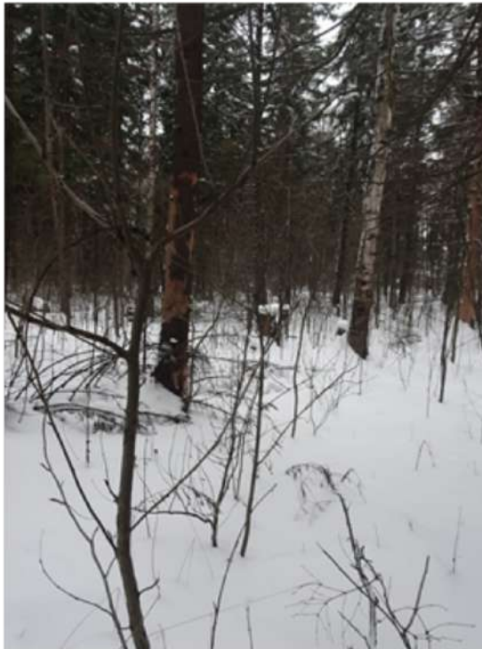
Аварийное дерево №2