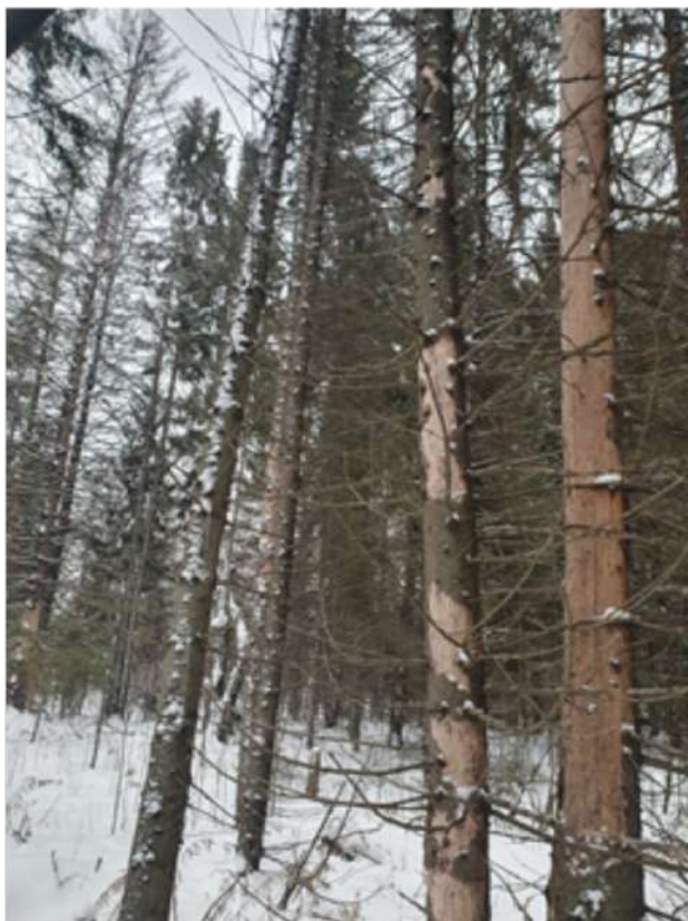
Аварийное дерево №4