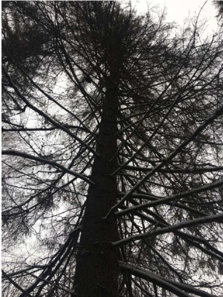
Аварийное дерево №1

Завьяловское лесничество, Пригородное участковое лесничество квартал 32 выдел 2