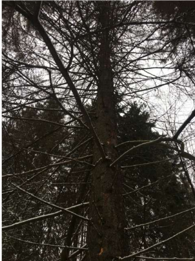
Аварийное дерево №4