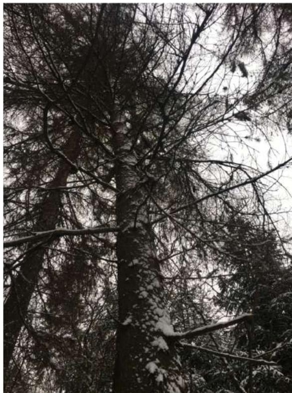
Аварийное дерево №2