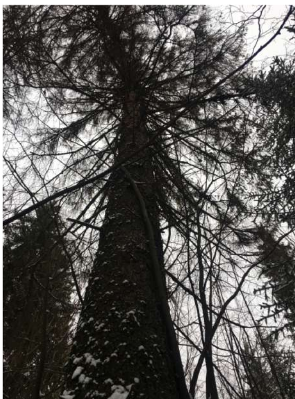
Аварийное дерево №3