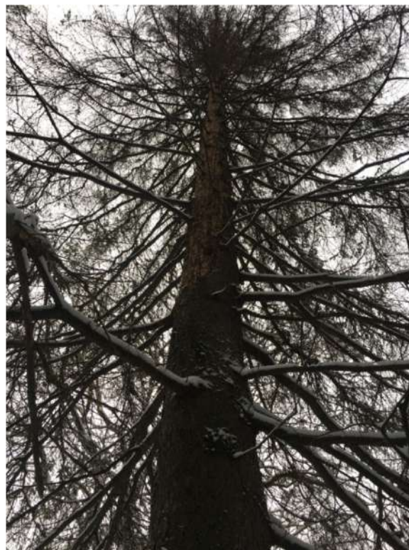
Аварийное дерево №5