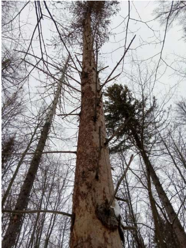
Аварийное дерево №14