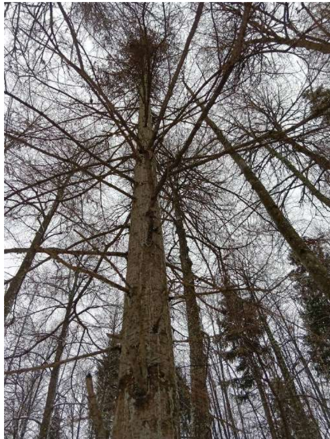
Аварийное дерево №3