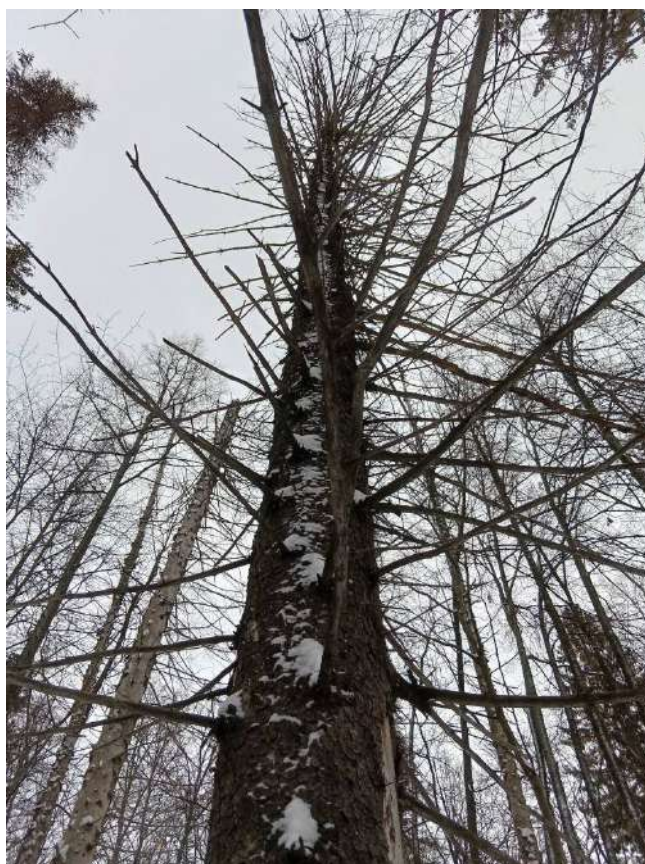
Аварийное дерево №18