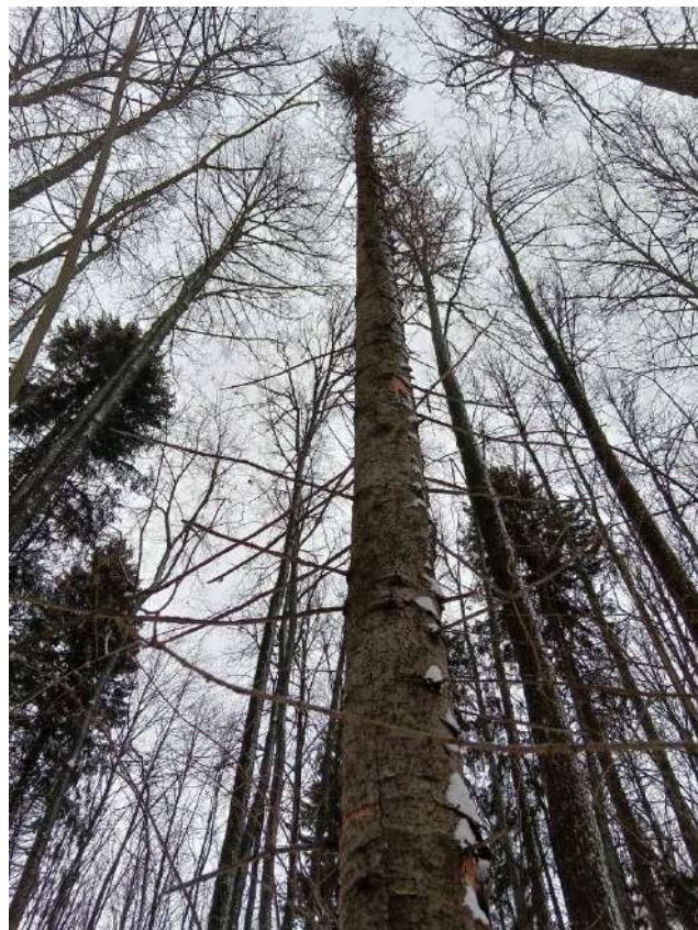
Аварийное дерево №9