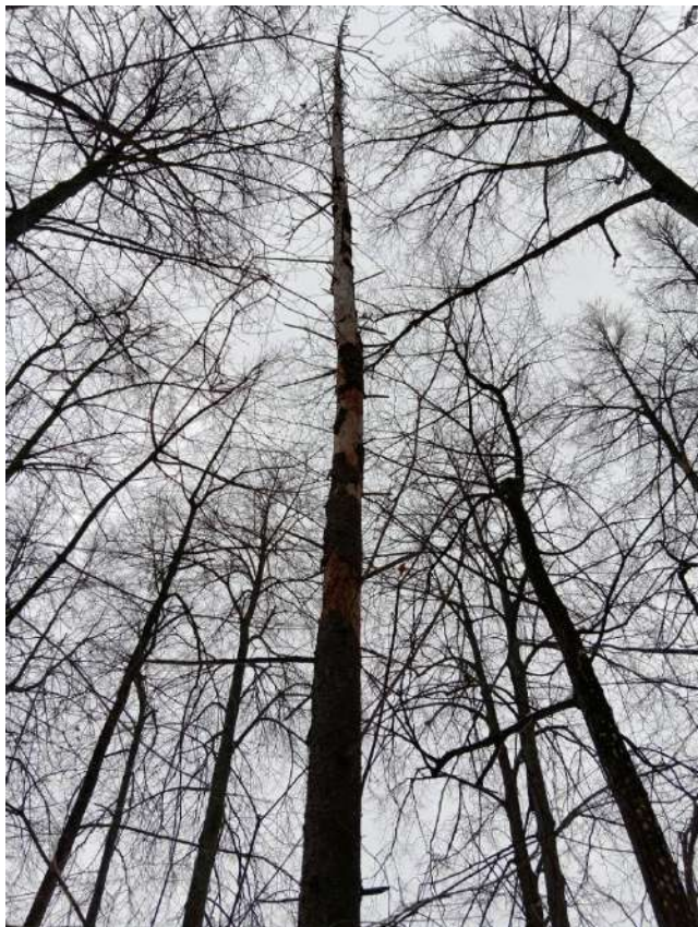
Аварийное дерево №11