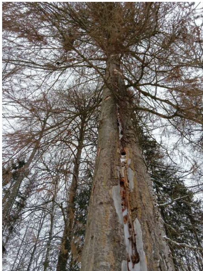
Аварийное дерево №5