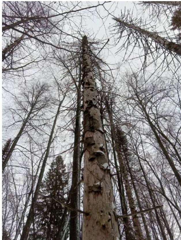
Аварийное дерево №15