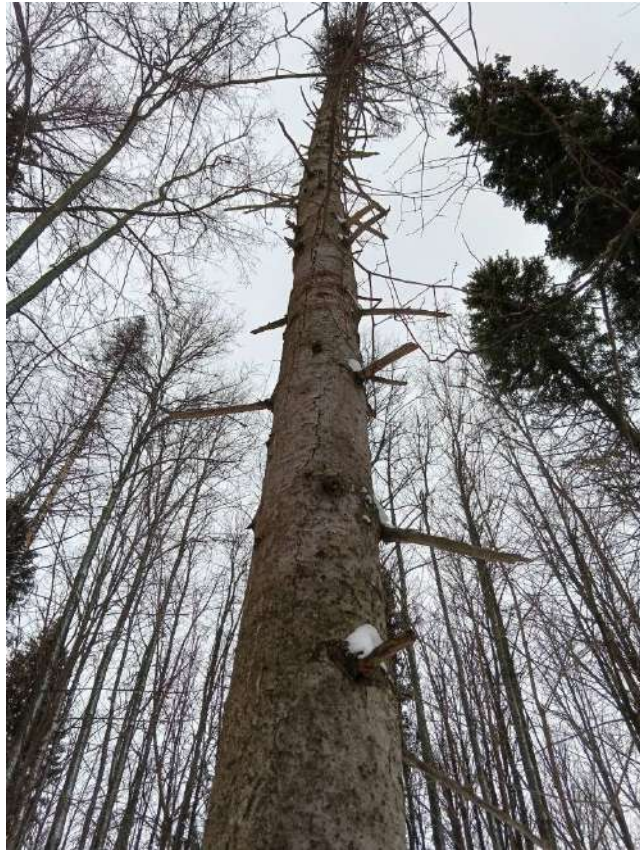
Аварийное дерево №10