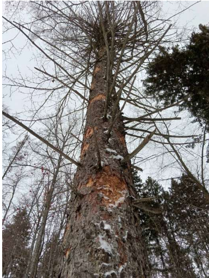
Аварийное дерево №12