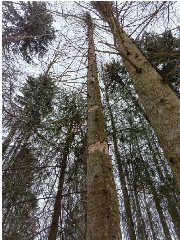
Аварийное дерево №8