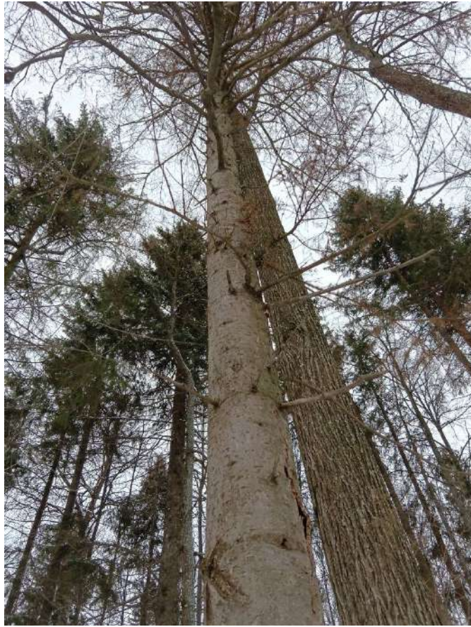
Аварийное дерево №6