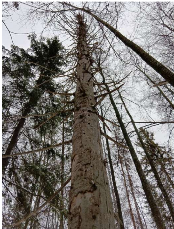
Аварийное дерево №13