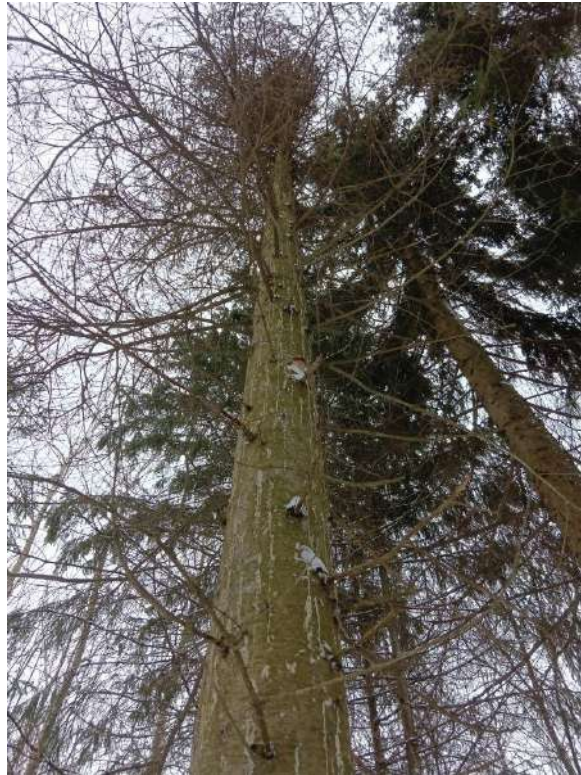
Аварийное дерево №2