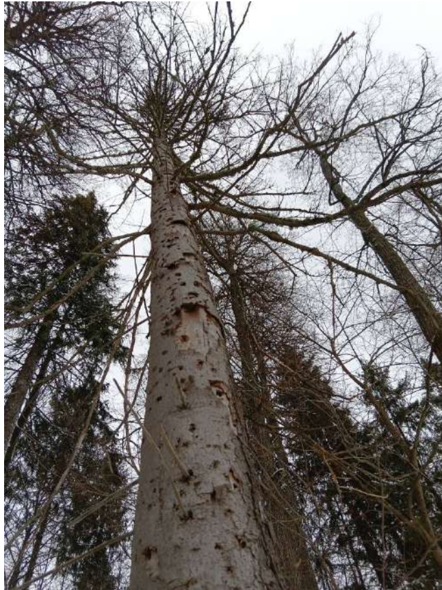
Аварийное дерево №4