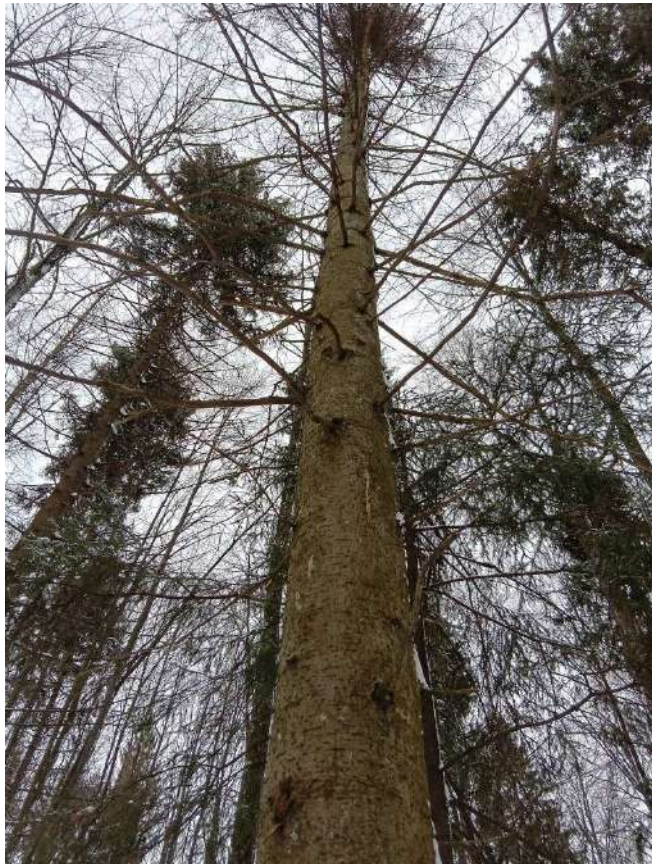
Аварийное дерево №7