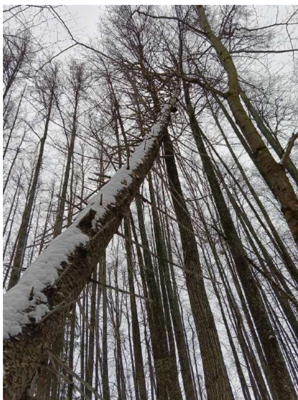
Аварийное дерево №19