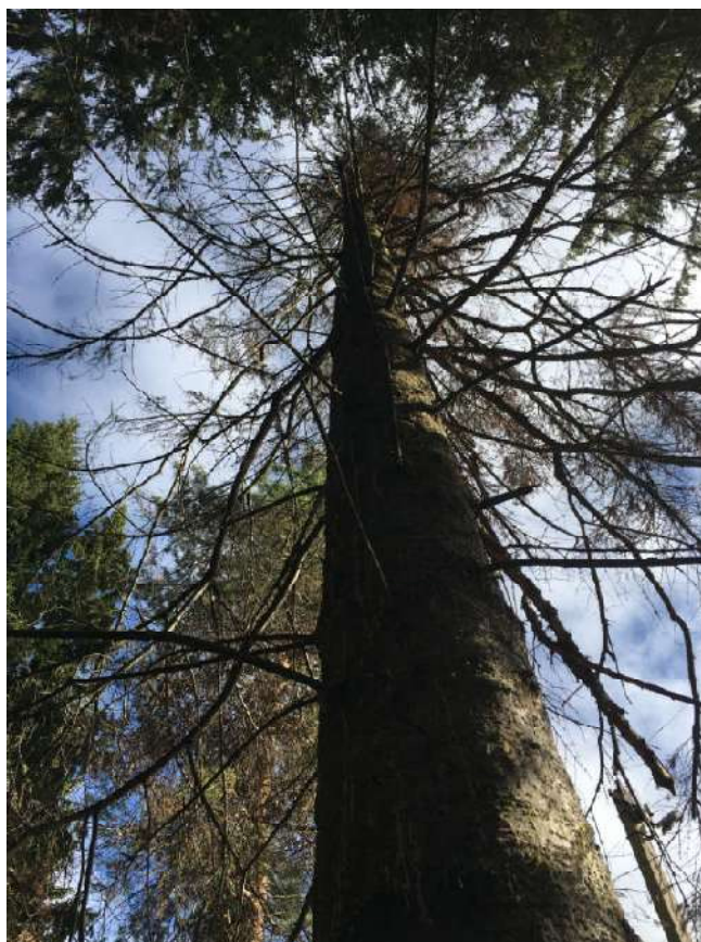
Аварийное дерево №12