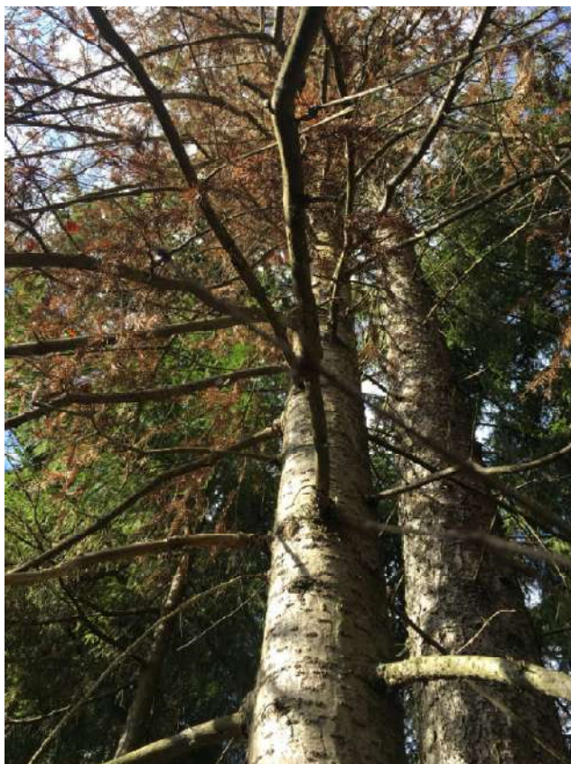
Аварийное дерево №7