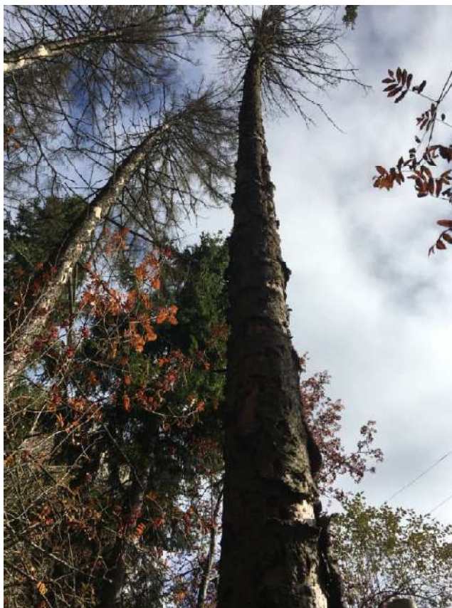
Аварийное дерево №4