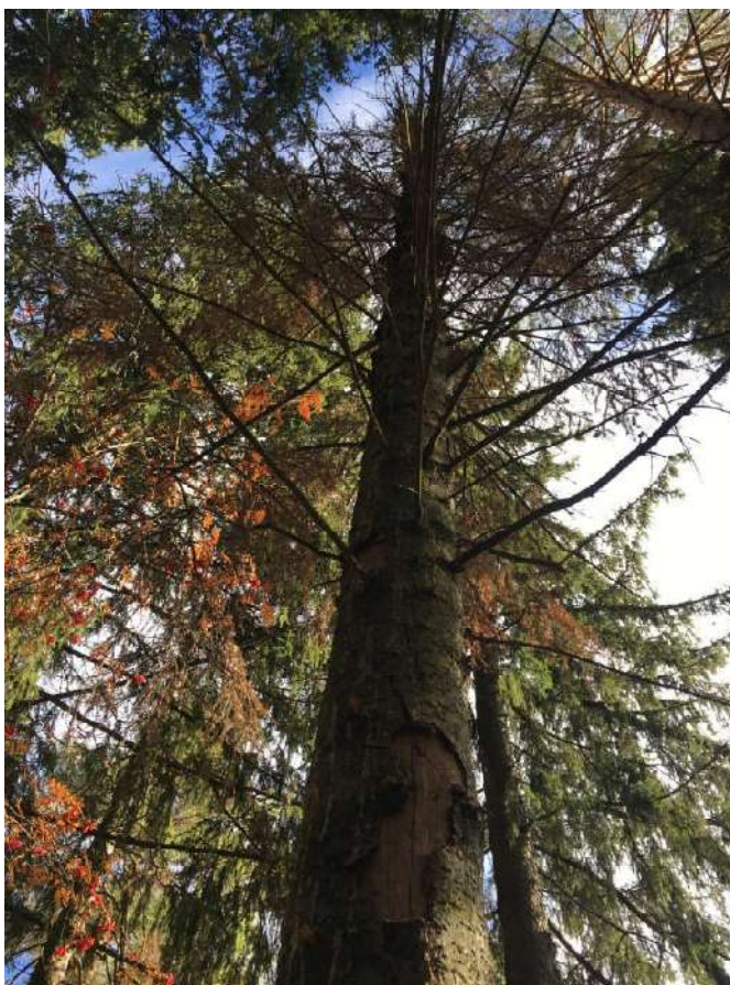
Аварийное дерево №11