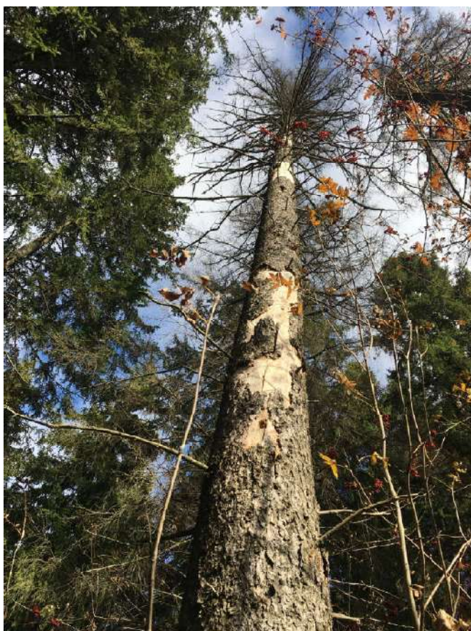
Аварийное дерево №6