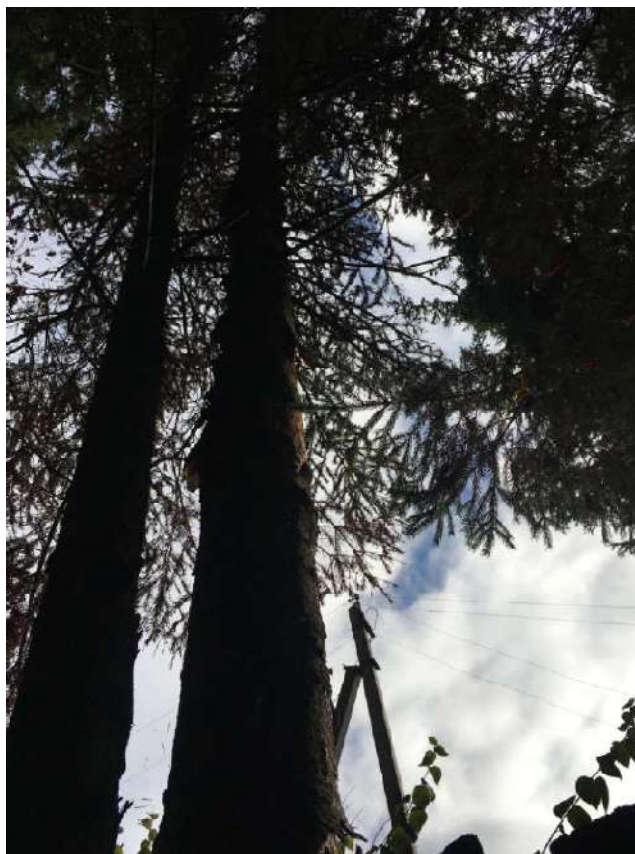
Аварийное дерево №3