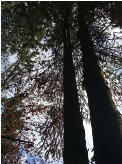
Аварийное дерево №2