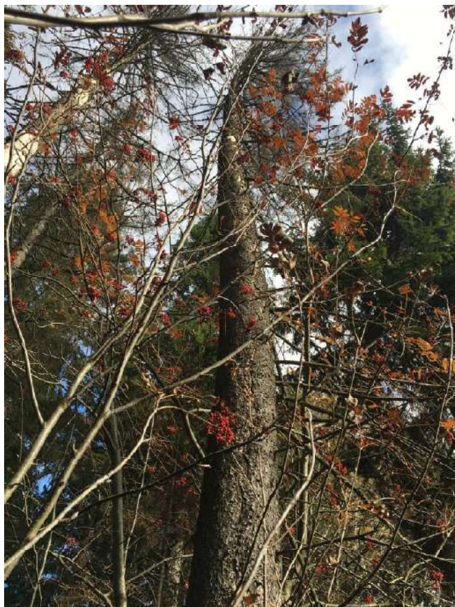
Аварийное дерево №5