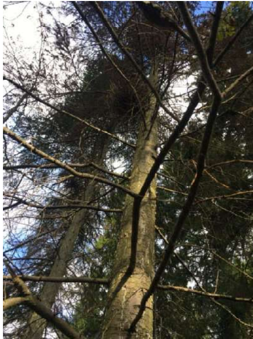
Аварийное дерево №1

Завьяловское лесничество, Пригородное участковое лесничество Квартал 134, выдел 13