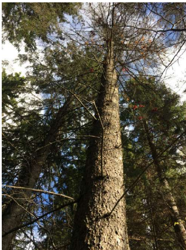
Аварийное дерево №10