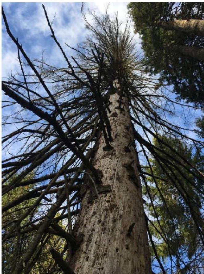
Аварийное дерево №9