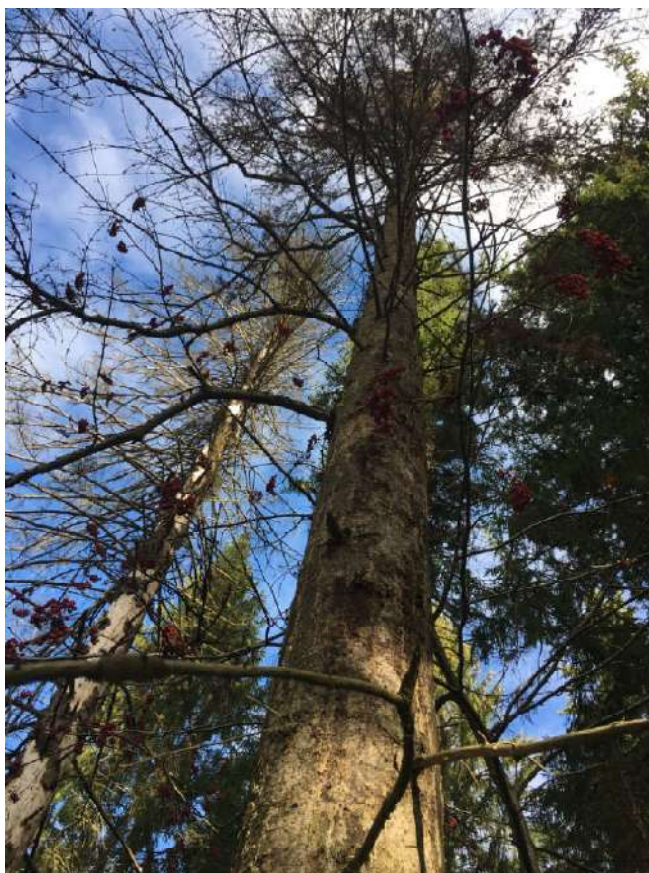
Аварийное дерево №8