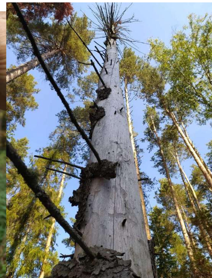
Координаты 56.41640 / 052.16656