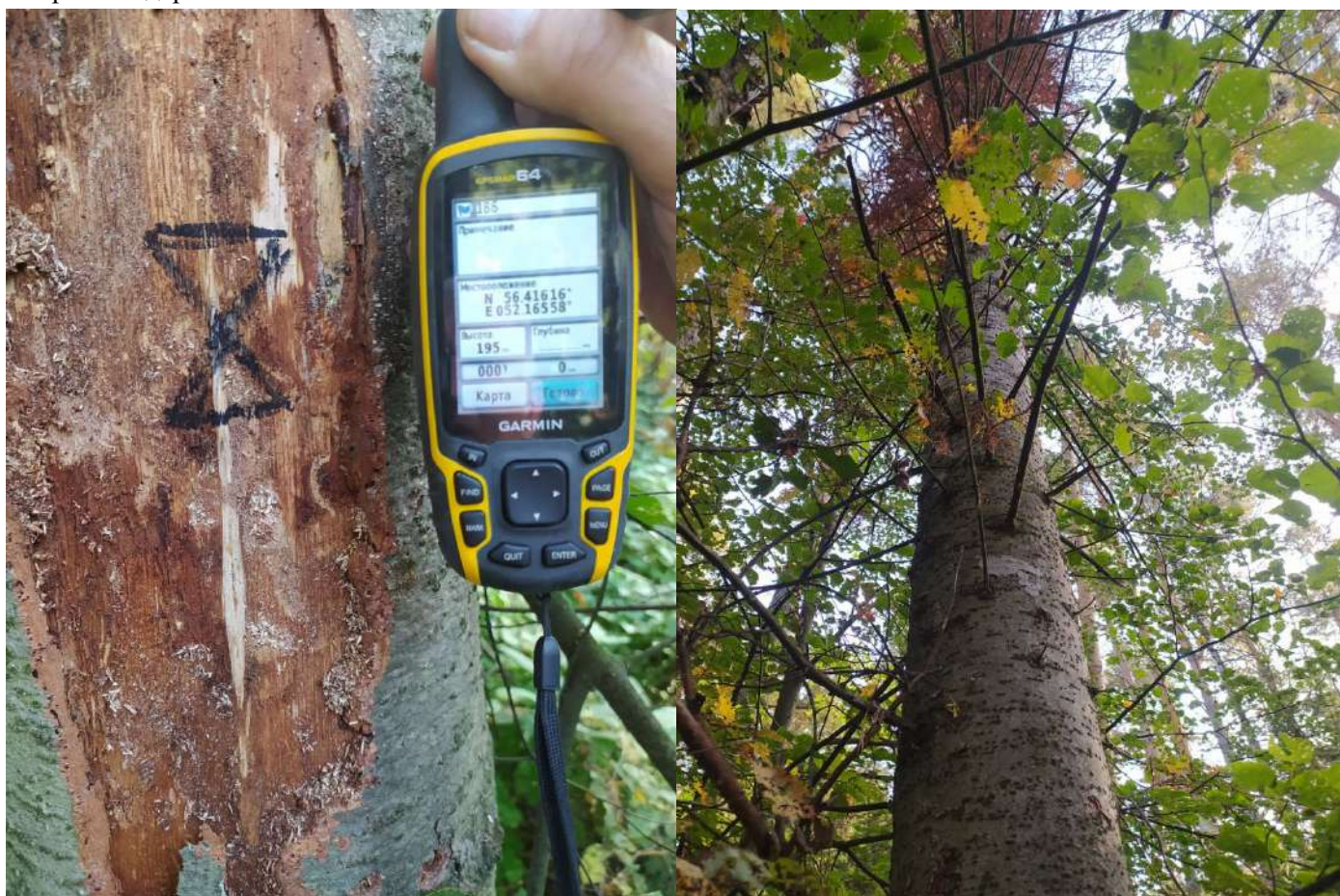
Координаты 56.41616 / 052.16558