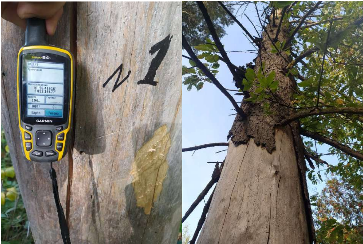
Координаты 56.41616 / 052.16477