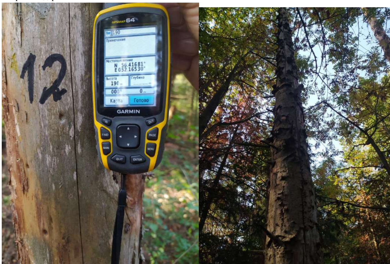
Аварийное дерево № 12