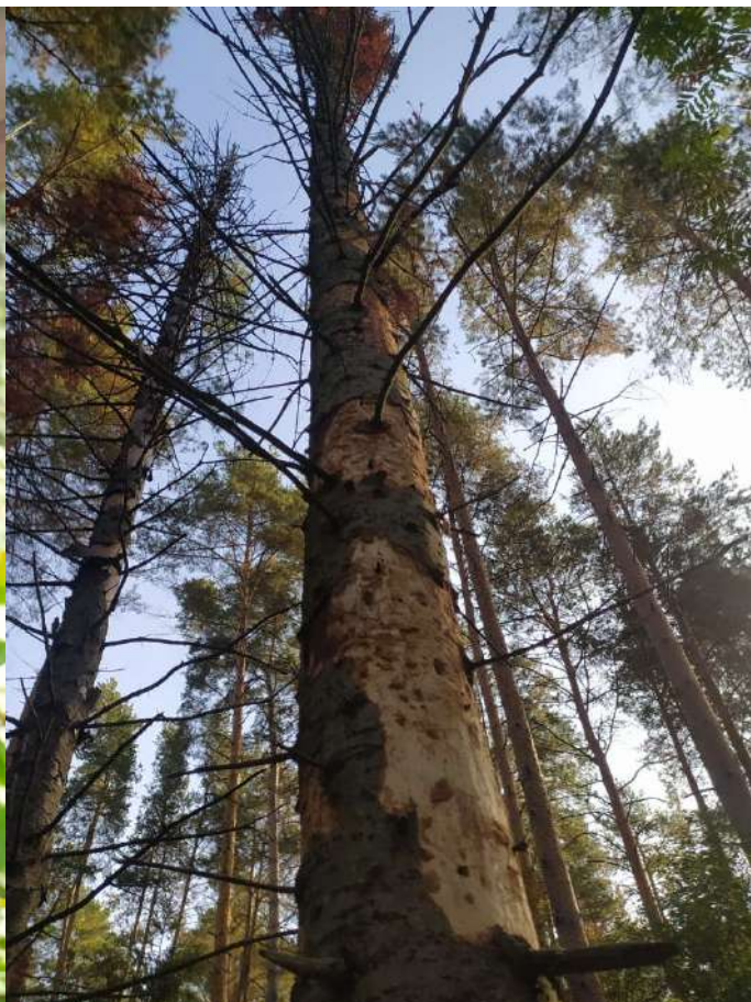
Координаты 56.41615 / 052.16559