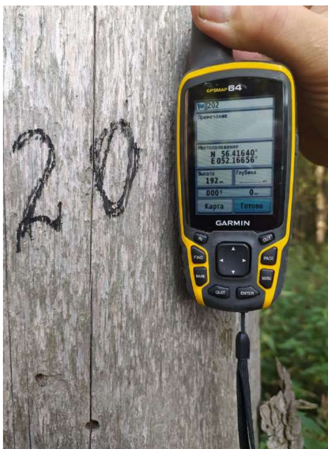
Аварийное дерево № 20