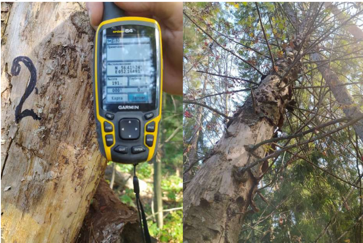
Координаты 56.41624 / 052.16491