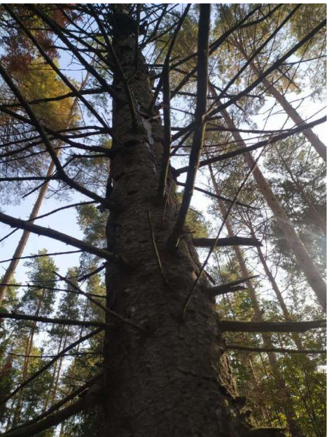
Координаты 56.41616 / 052.16562