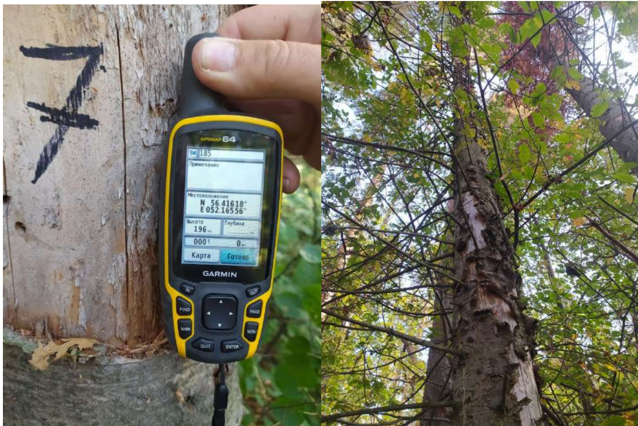
Координаты 56.41618 / 052.16556