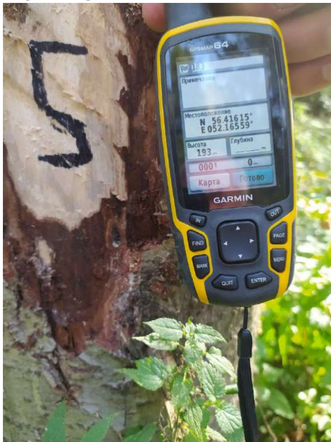
Аварийное дерево № 5