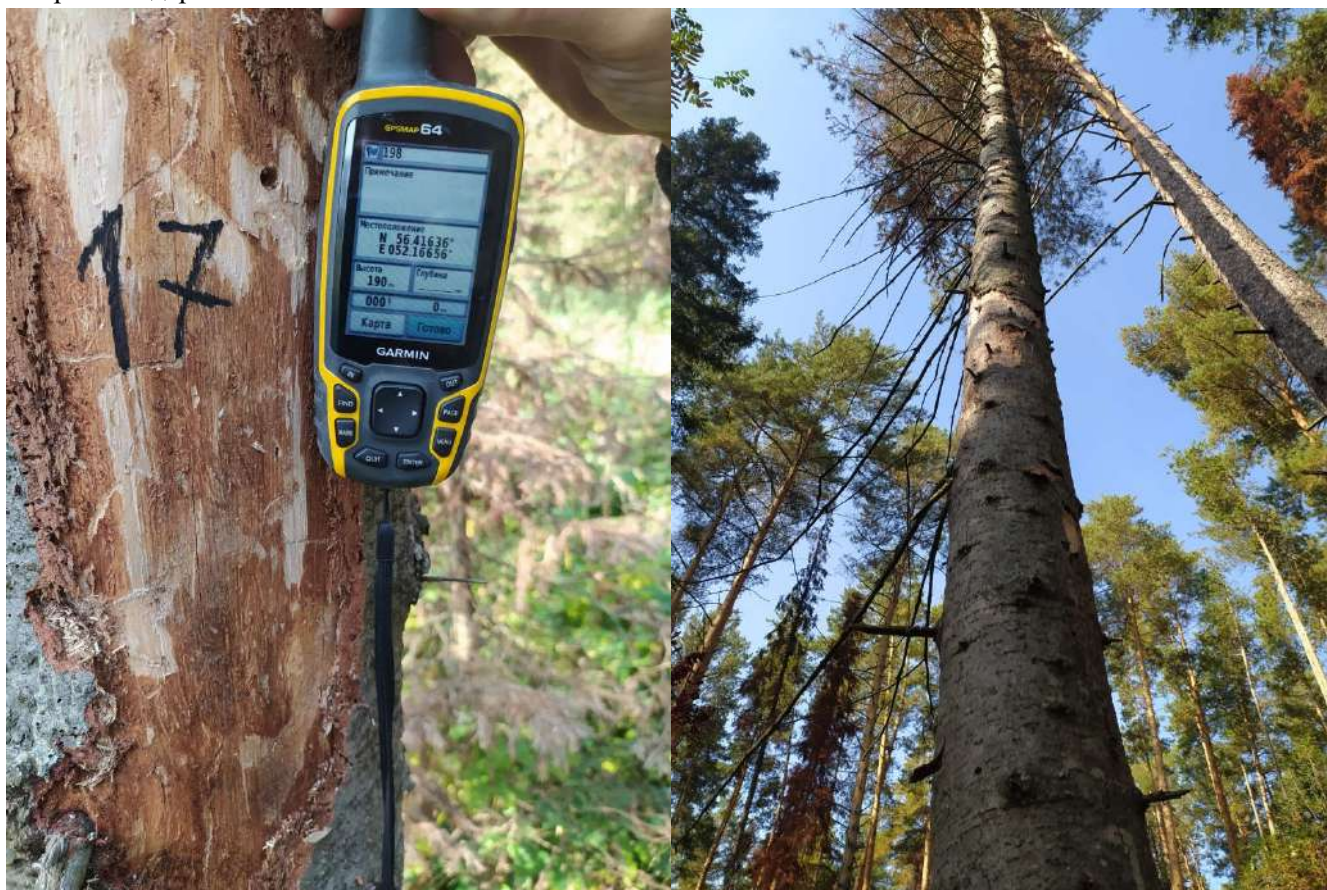
Координаты 56.41636 / 052.16656