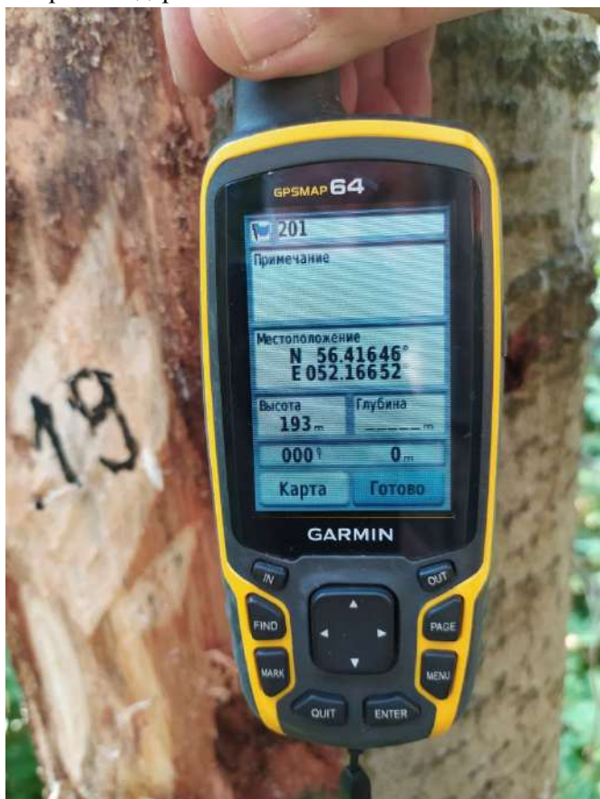
Аварийное дерево № 19