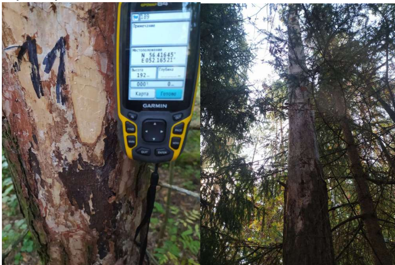
Аварийное дерево № 11