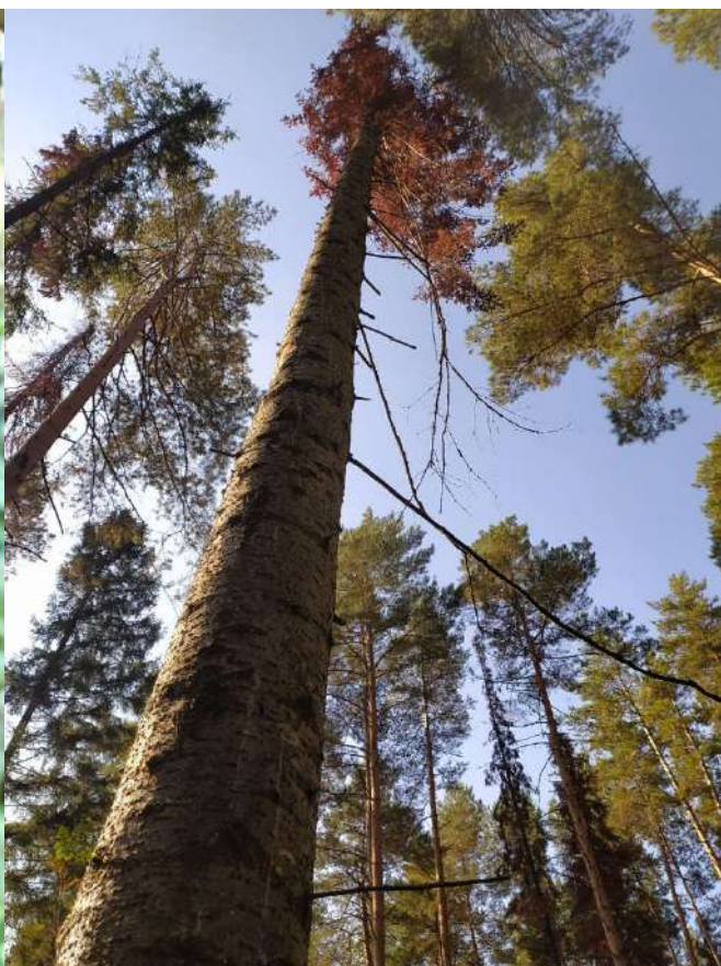
Координаты 56.41646 / 052.16652