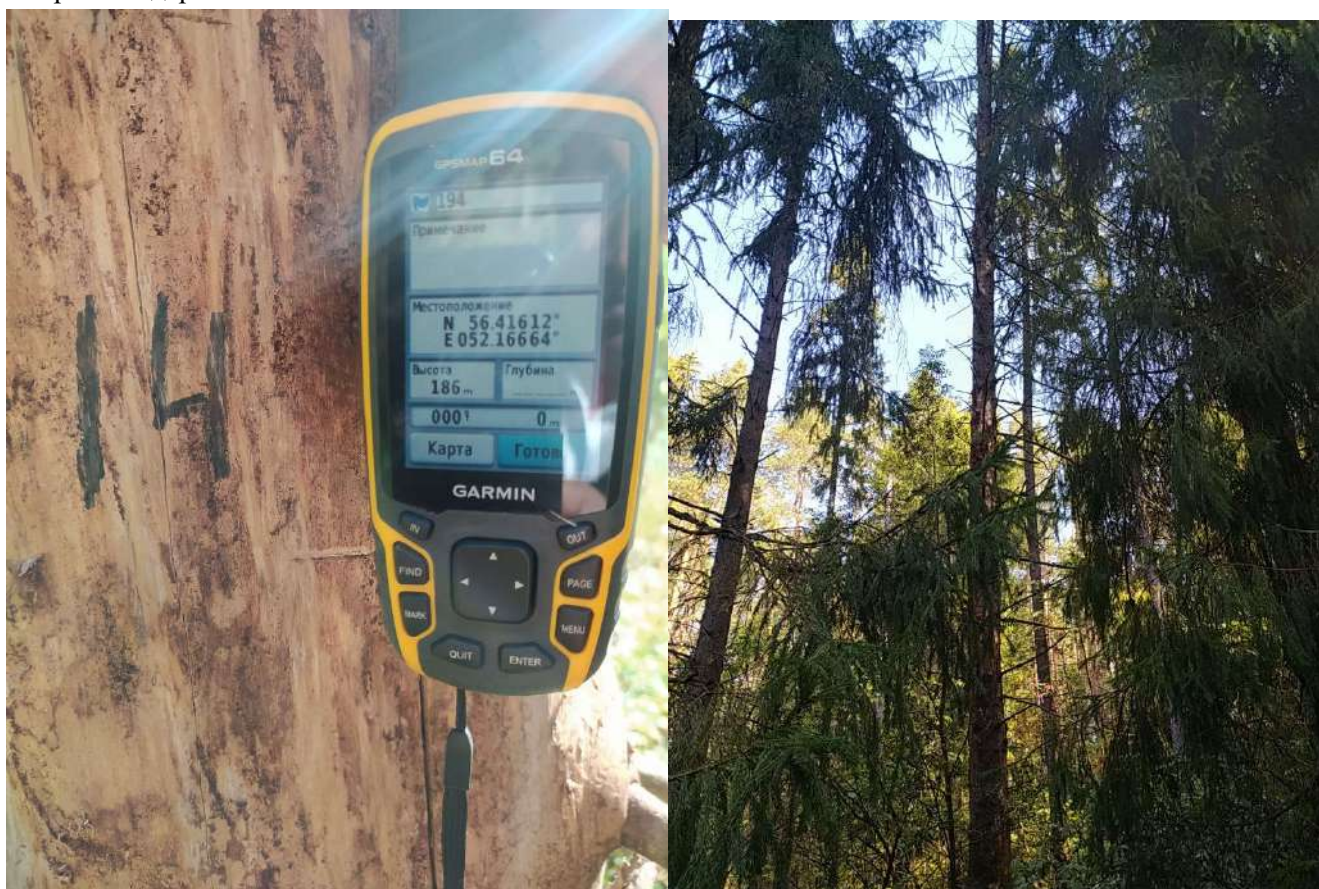
Координаты 56.41612 / 052.16664