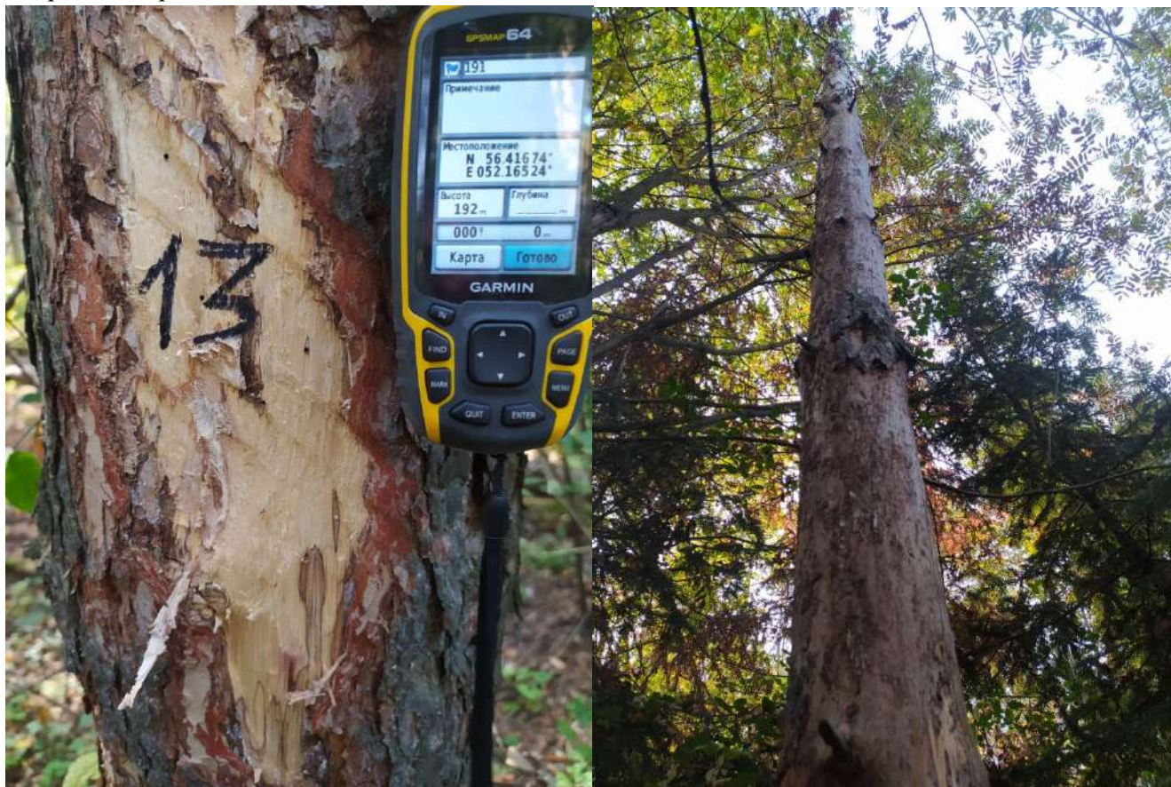
Координаты 56.41674 / 052.16524