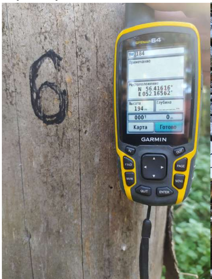
Аварийное дерево № 6