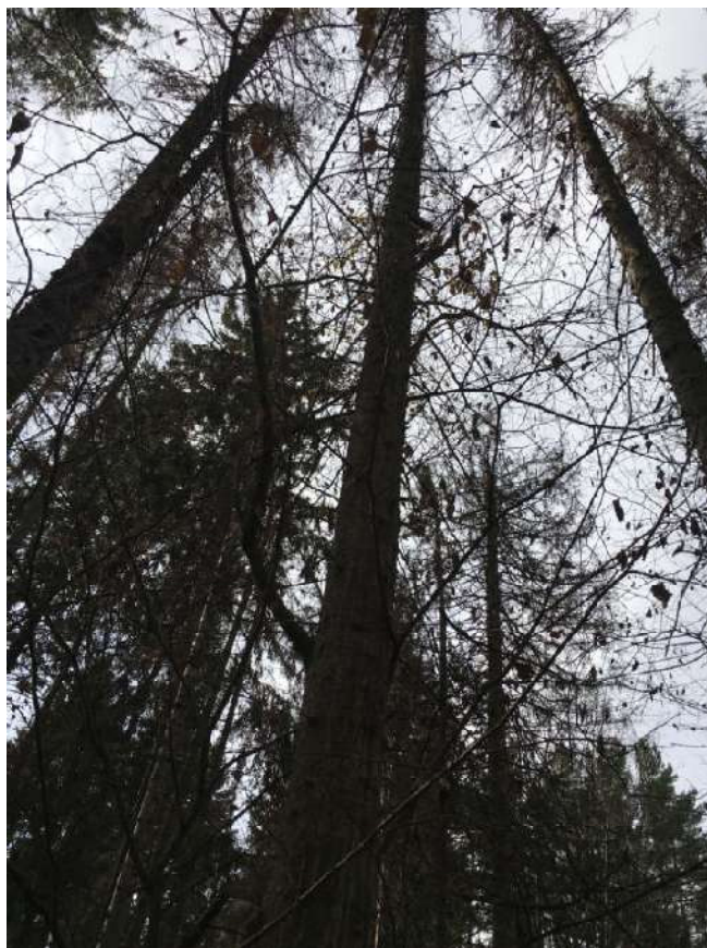
Аварийное дерево №4