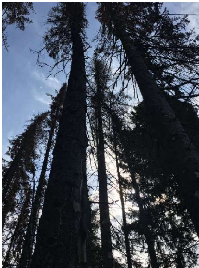
Аварийное дерево № 28