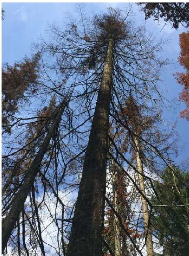
Аварийное дерево № 37