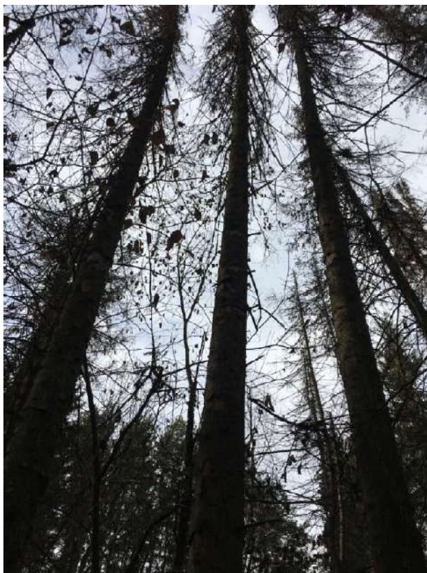
Аварийное дерево №7