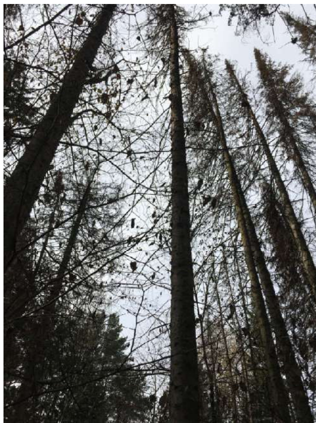
Аварийное дерево №5