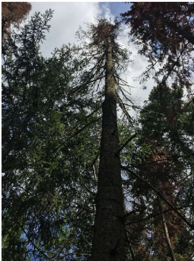
Аварийное дерево № 36