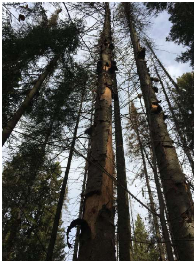
Аварийное дерево №9