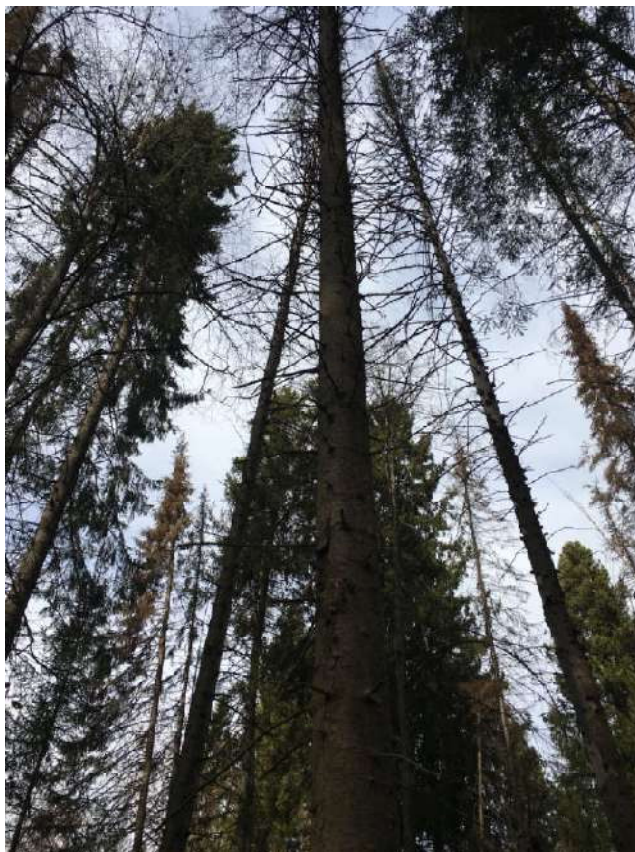
Аварийное дерево №11