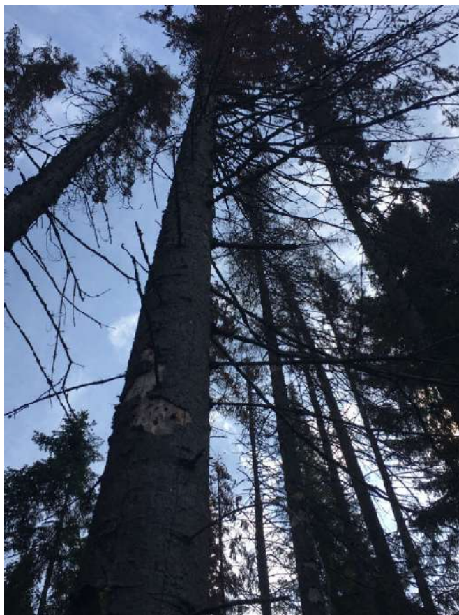
Аварийное дерево № 30