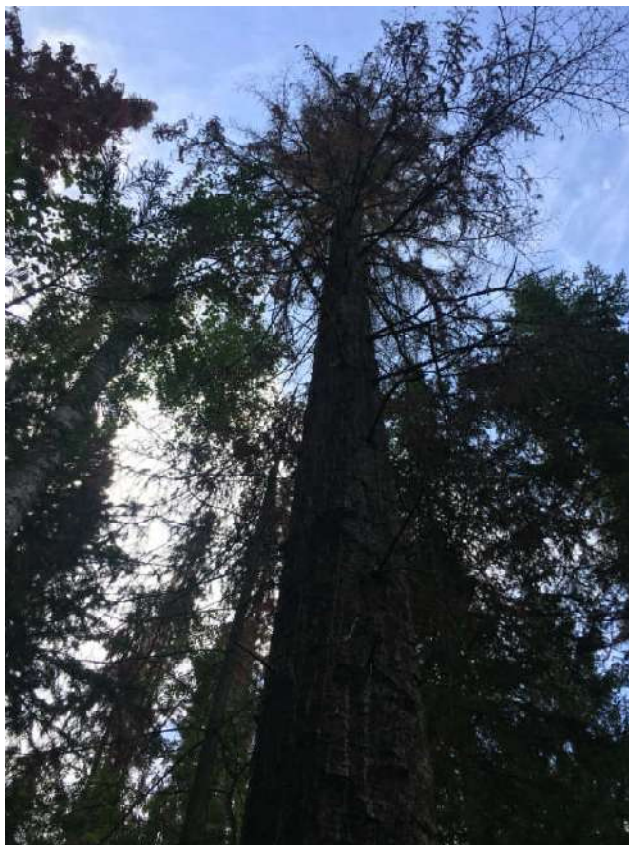
Аварийное дерево № 26