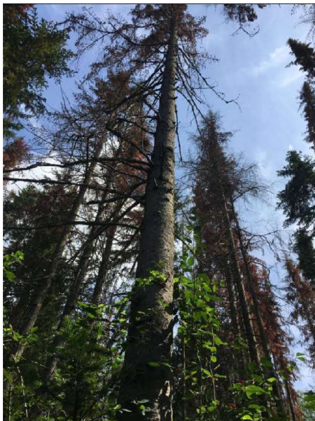
Аварийное дерево № 29