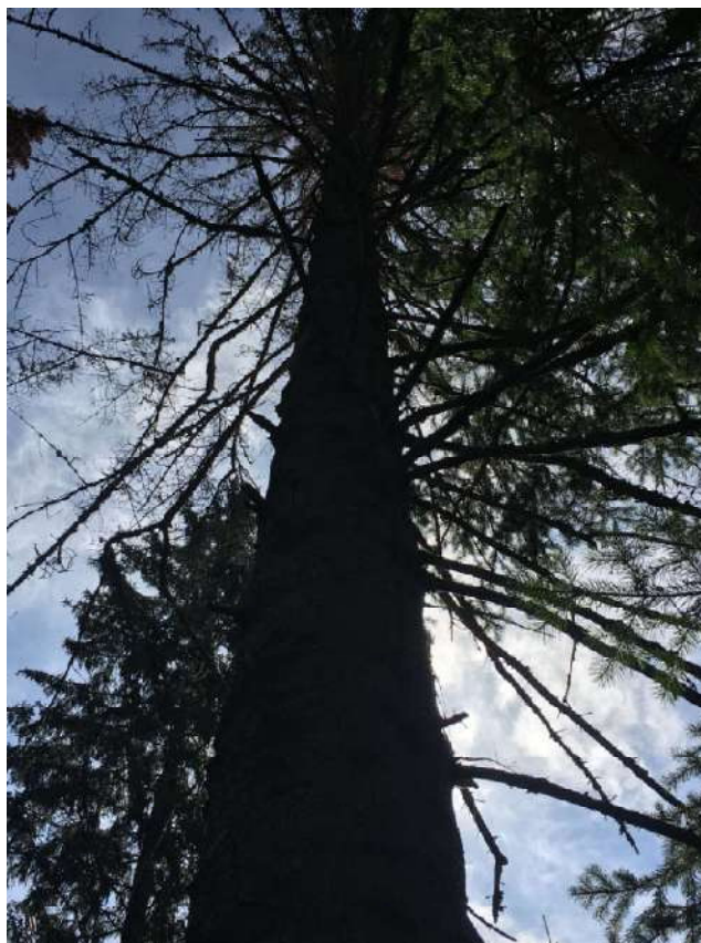
Аварийное дерево № 34