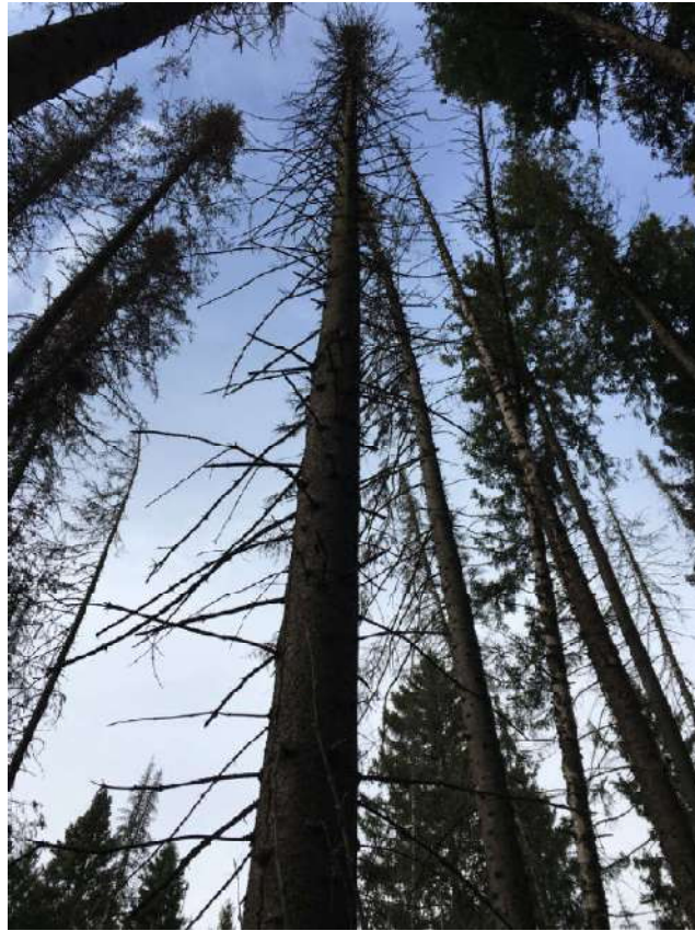
Аварийное дерево №20