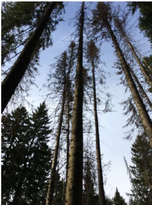
Аварийное дерево №22