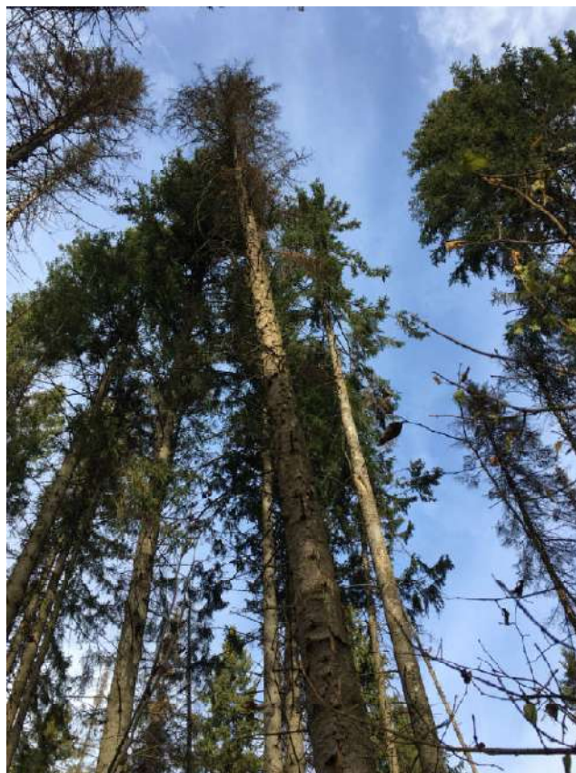
Аварийное дерево №23