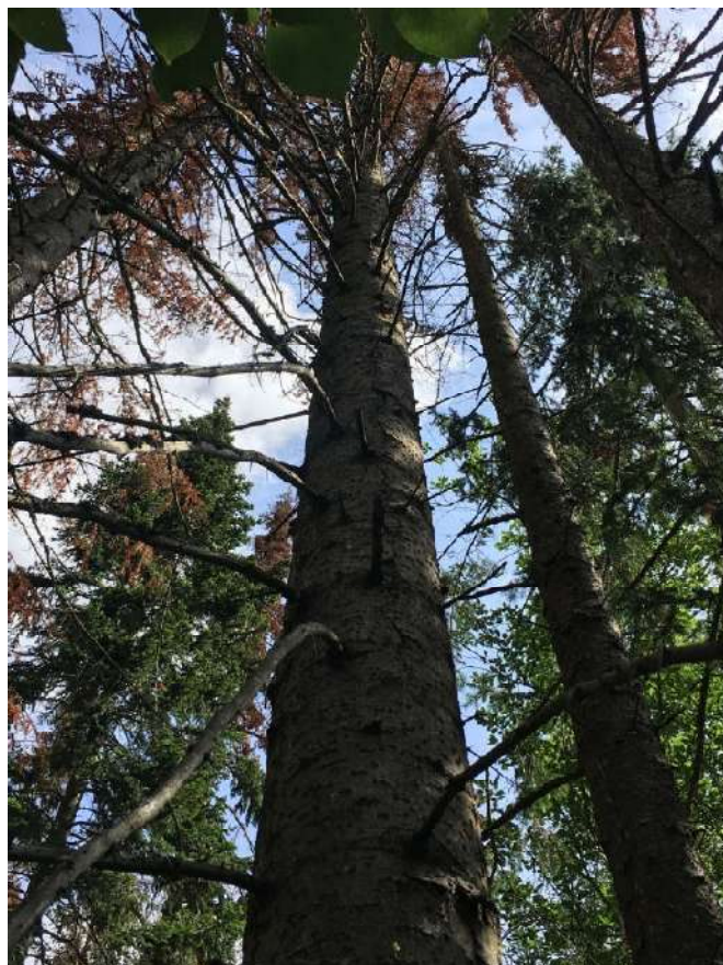
Аварийное дерево № 33