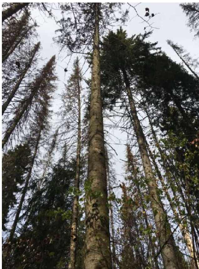
Аварийное дерево №3