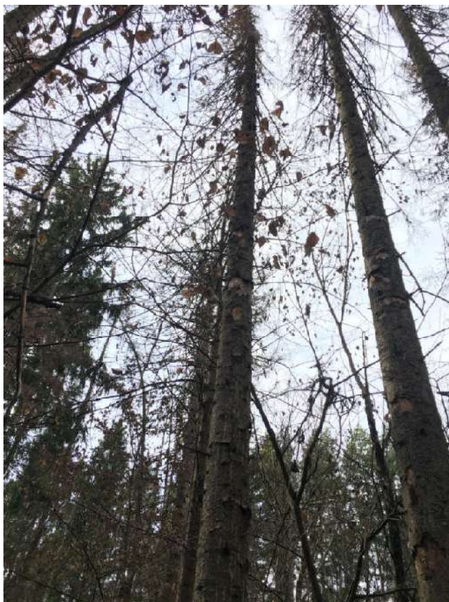
Аварийное дерево №6