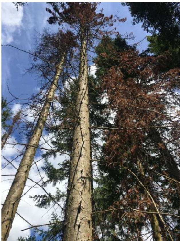
Аварийное дерево № 27