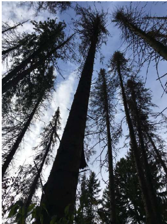
Аварийное дерево №21