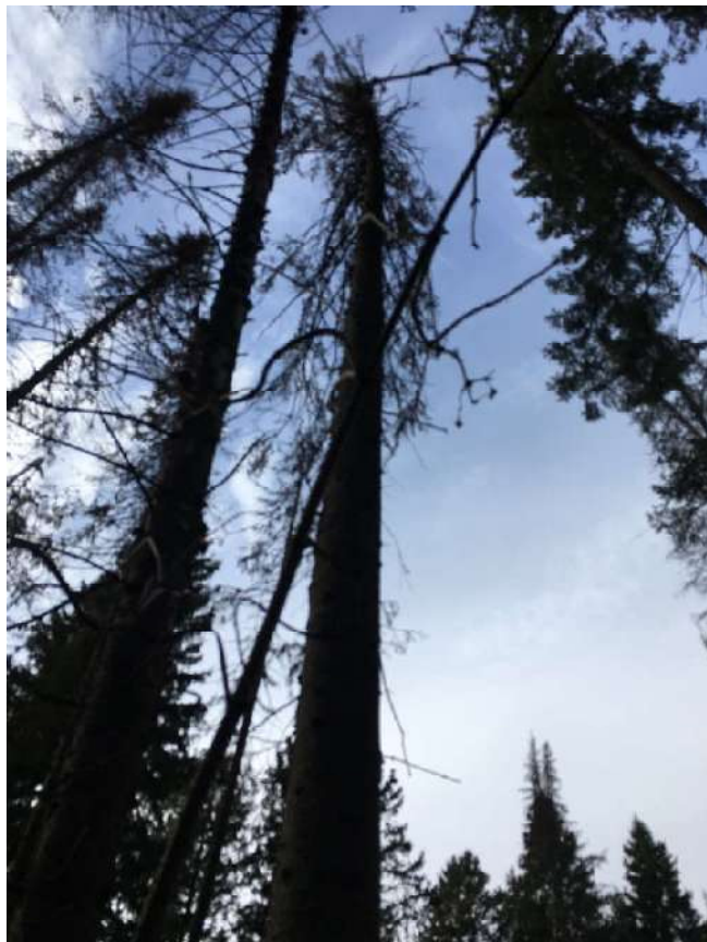
Аварийное дерево №19