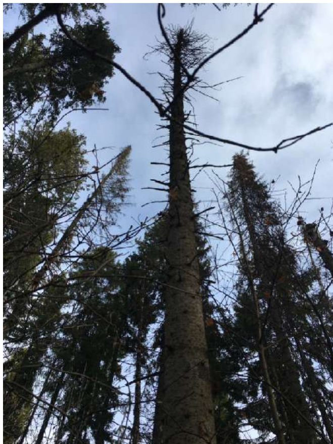
Аварийное дерево №16