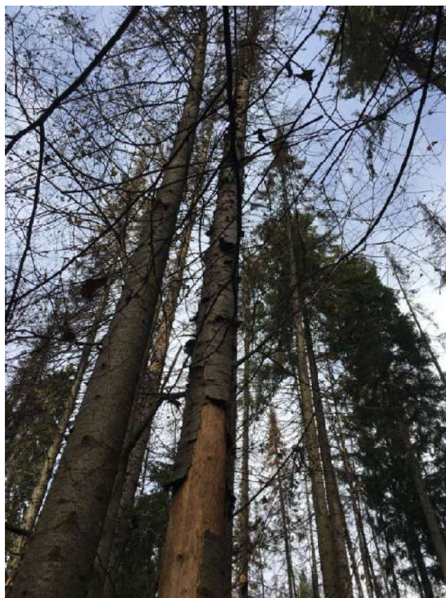
Аварийное дерево №13