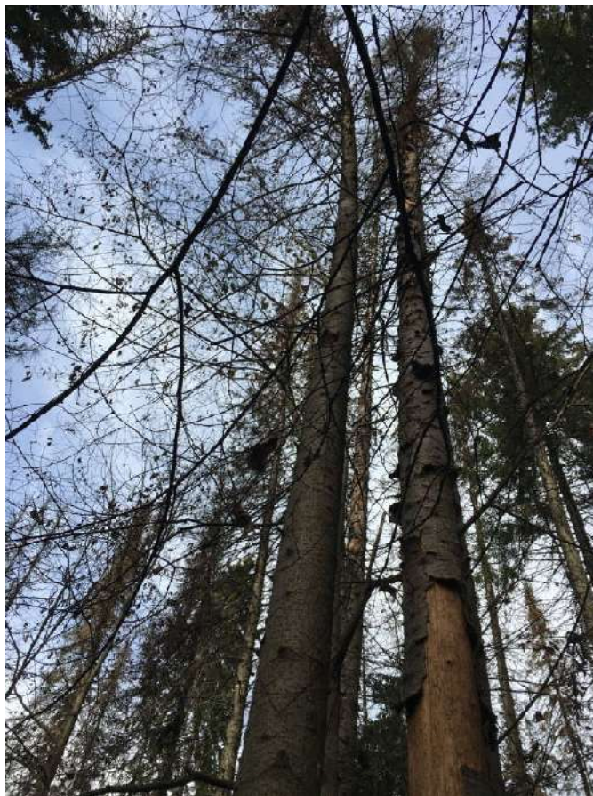
Аварийное дерево №14