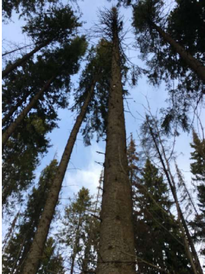
Аварийное дерево №18