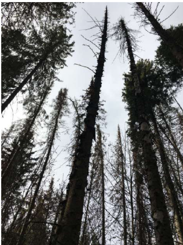
Аварийное дерево №2