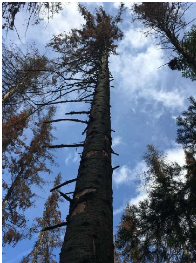
Аварийное дерево № 32