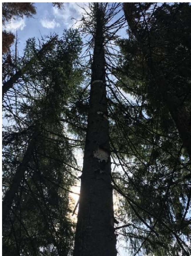
Аварийное дерево № 31