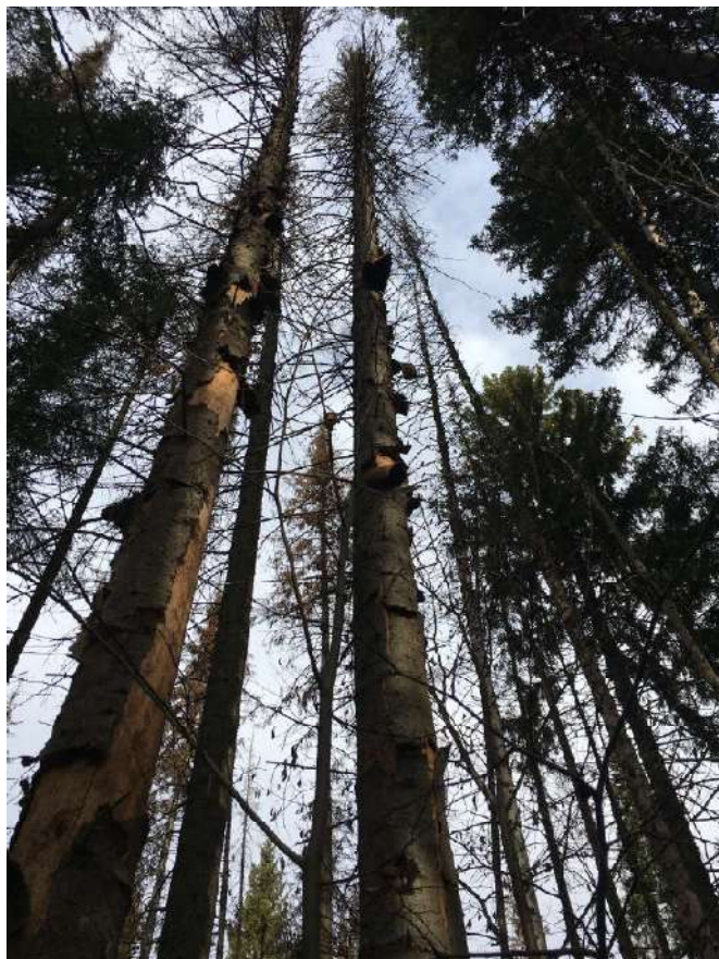
Аварийное дерево №10