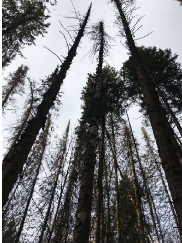
Аварийное дерево №1

Завьяловское лесничество, Пригородное участковое лесничество квартал 30 выдел 3 (2)