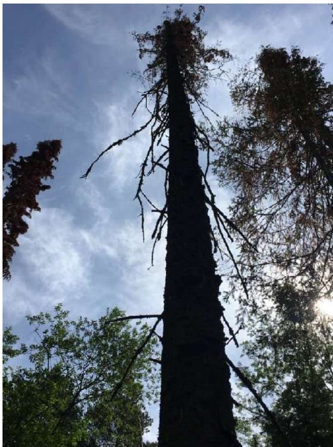
Аварийное дерево № 35