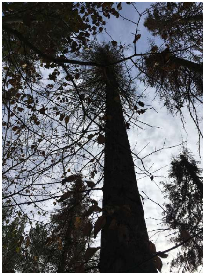
Аварийное дерево №25