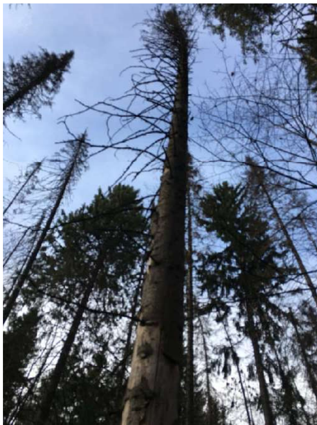
Аварийное дерево №17