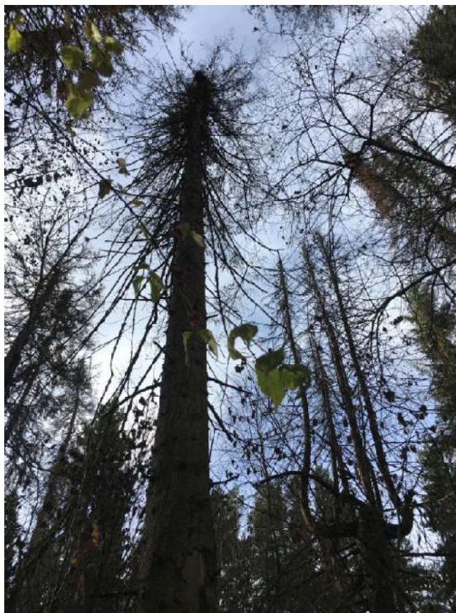
Аварийное дерево №12