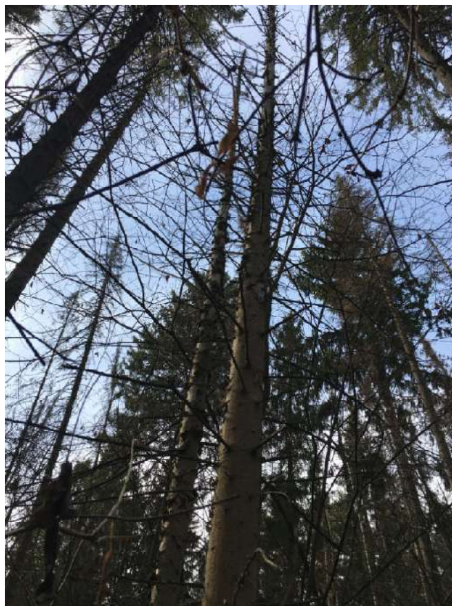
Аварийное дерево №15