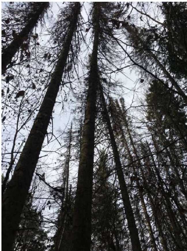
Аварийное дерево №8