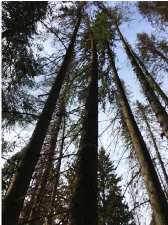
Аварийное дерево №24