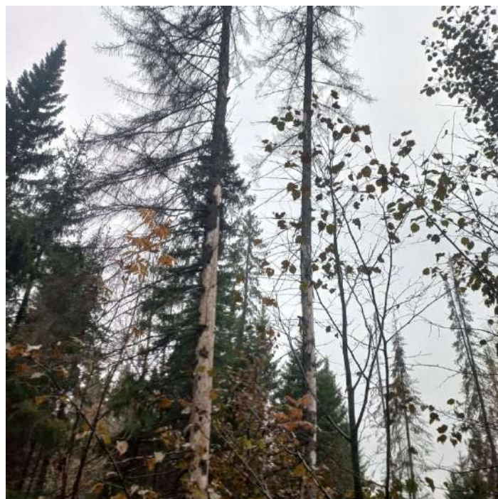
Фото № 2