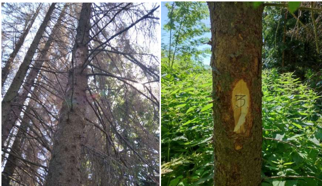
Аварийное дерево №3