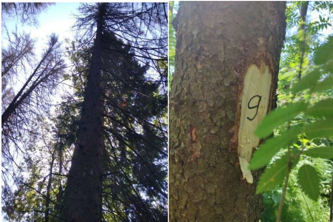
Аварийное дерево №9