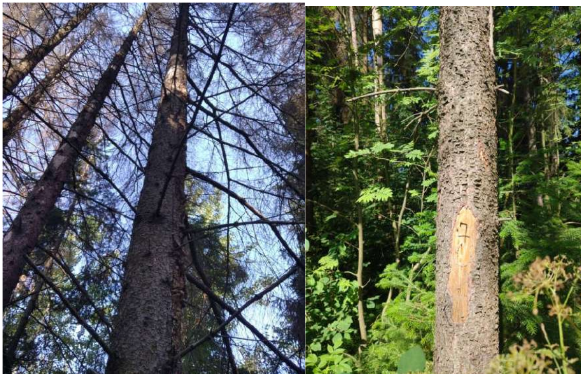
Аварийное дерево №7