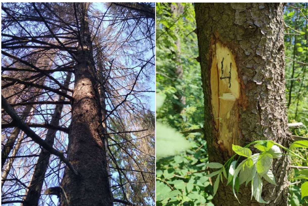
Аварийное дерево №4