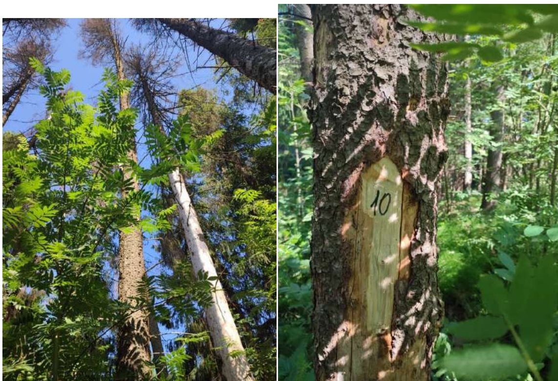
Аварийное дерево №10