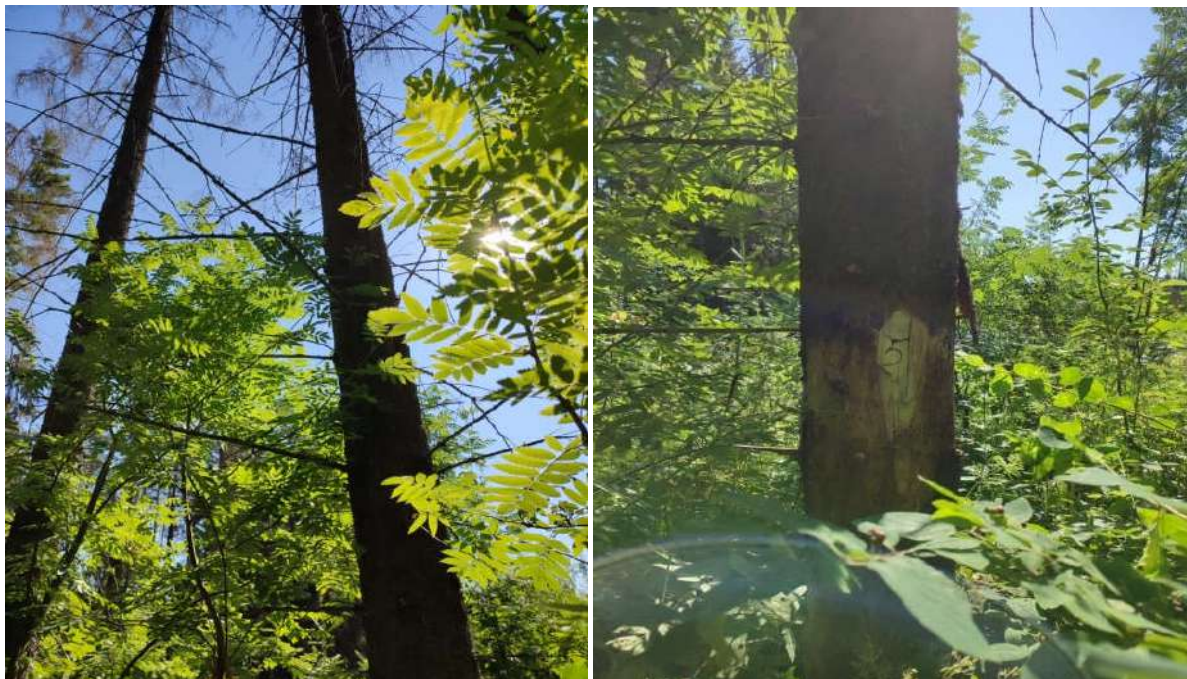
Аварийное дерево №5