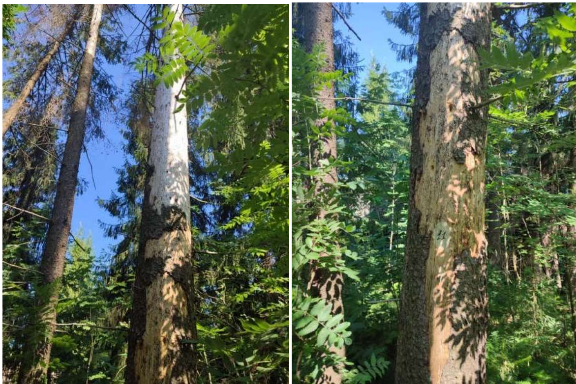
Аварийное дерево №11