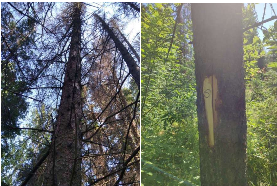
Аварийное дерево №6