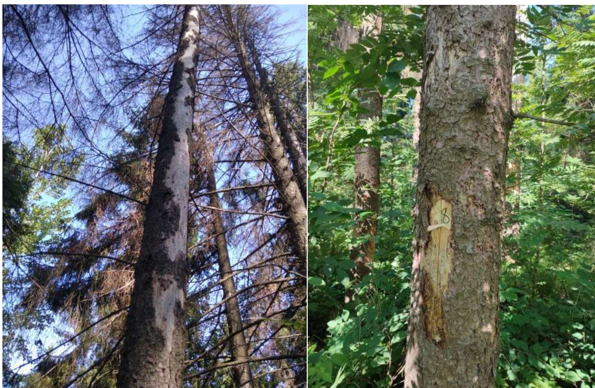
Аварийное дерево №8