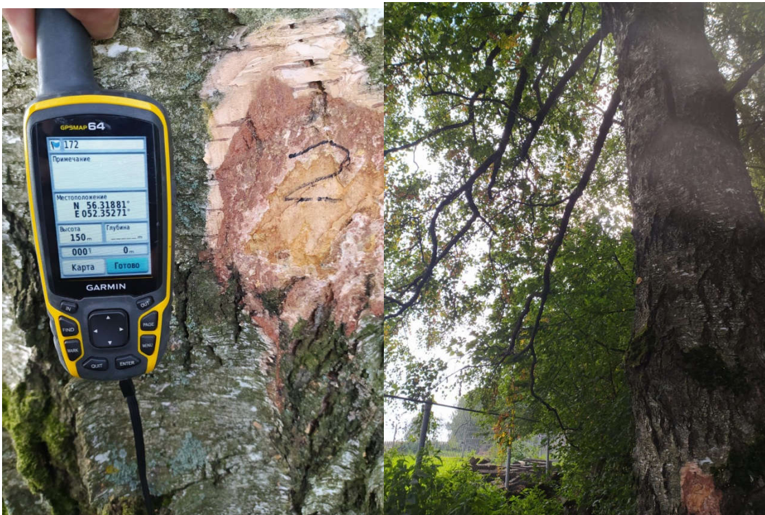
Координаты 56.31881 / 052.35271