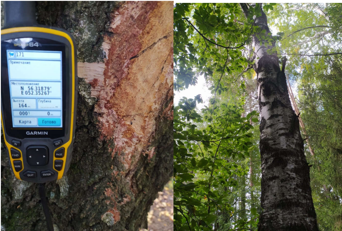
Координаты 56.31874 / 052.35267