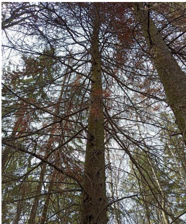
Аварийное дерево № 16