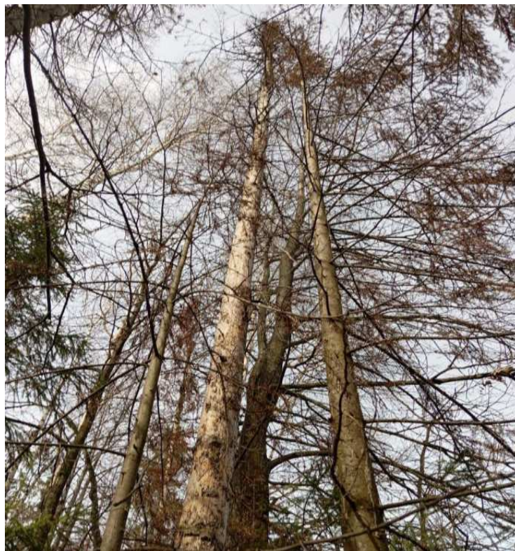
Аварийное дерево № 26