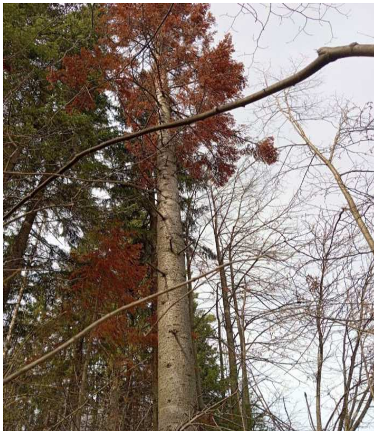
Аварийное дерево № 13