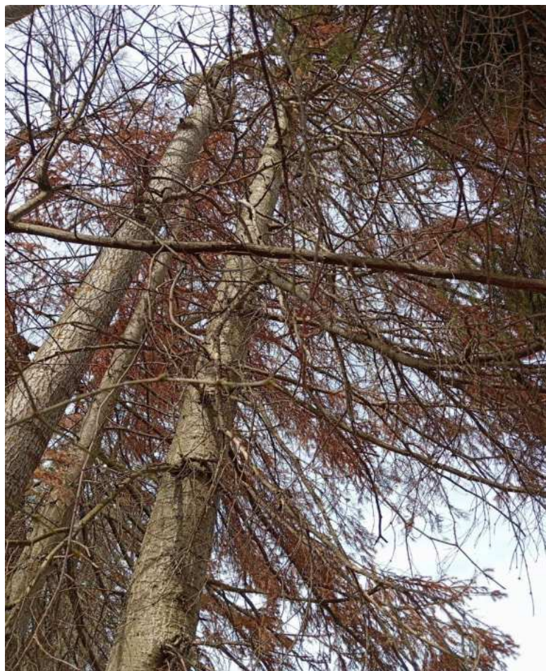
Аварийное дерево № 28