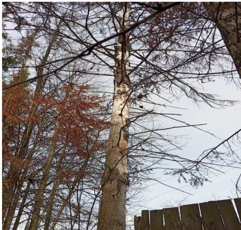
Аварийное дерево № 17