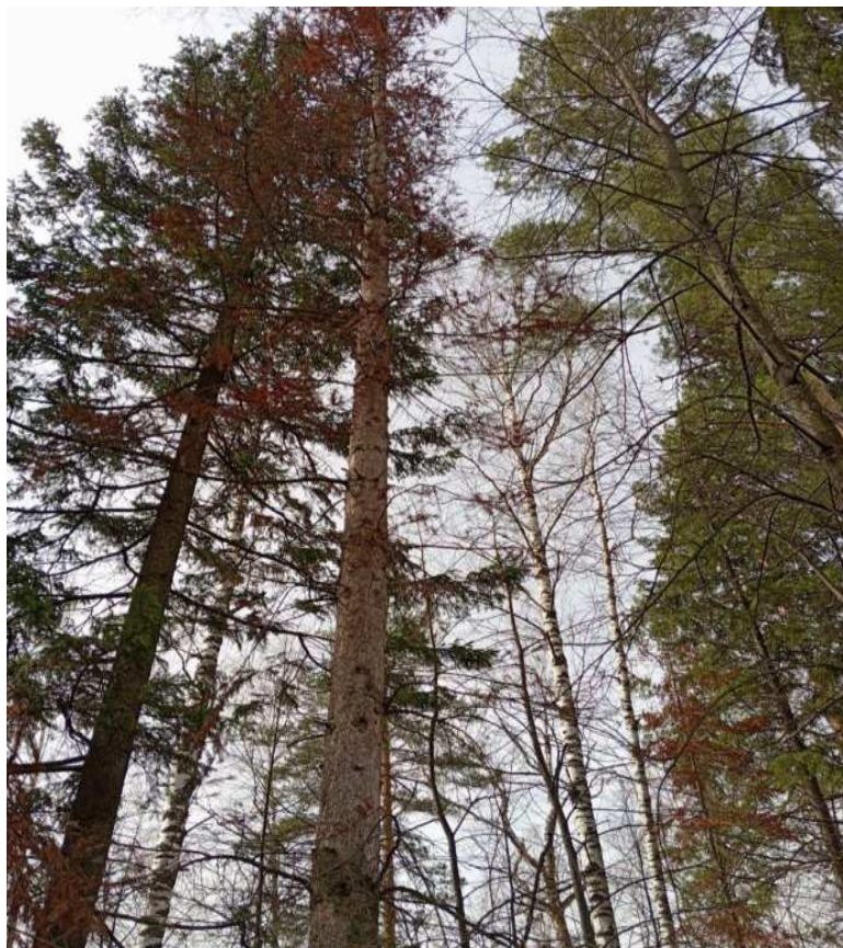
Аварийное дерево № 9