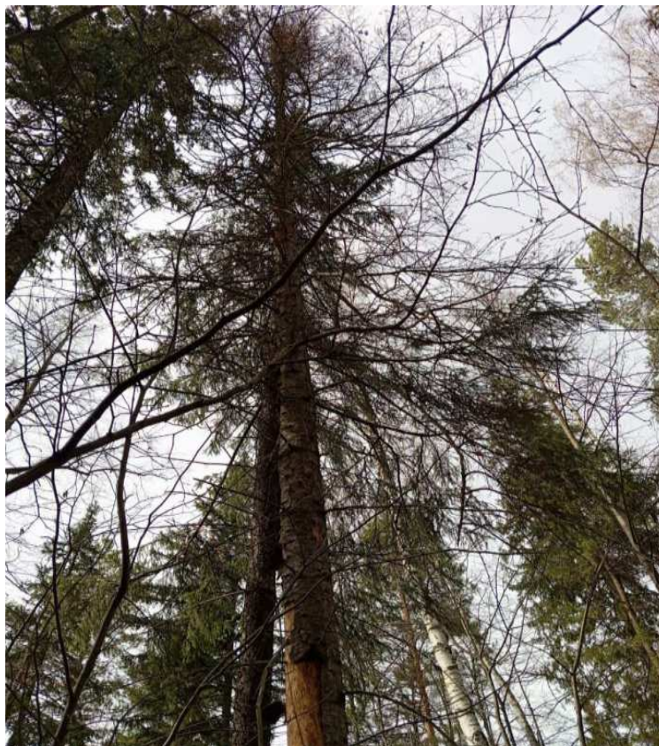
Аварийное дерево № 14