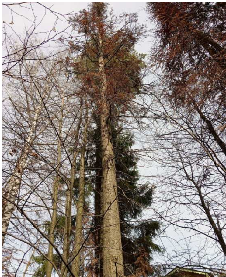
Аварийное дерево № 18