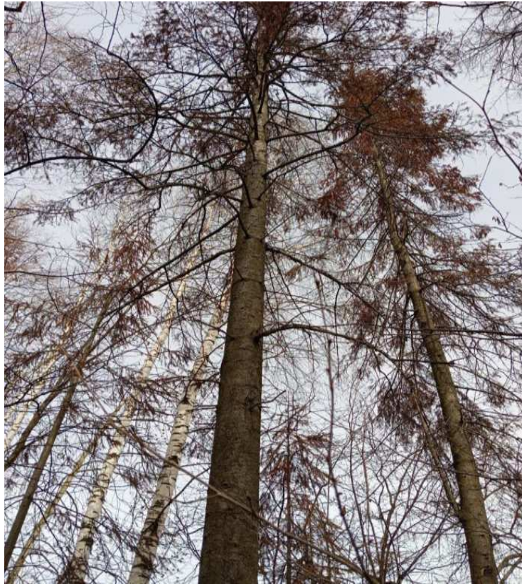
Аварийное дерево № 11