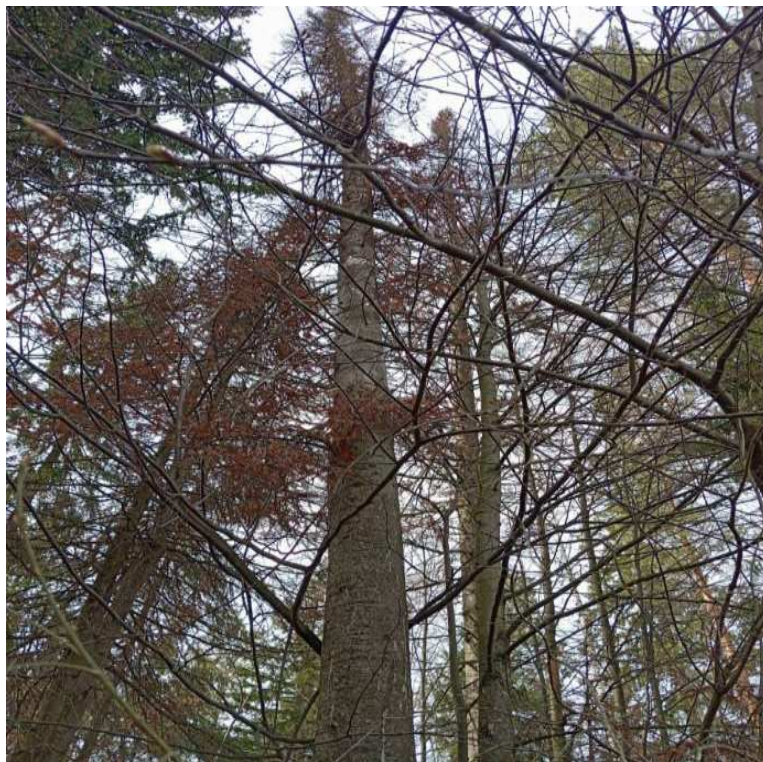
Аварийное дерево № 15