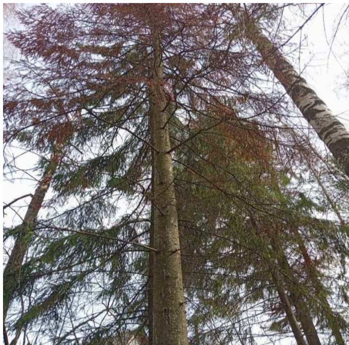
Аварийное дерево № 7