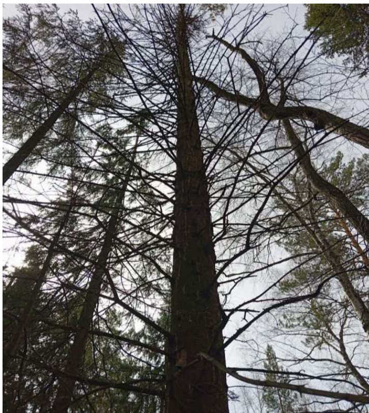
Аварийное дерево № 24