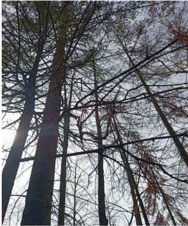
Аварийное дерево № 21