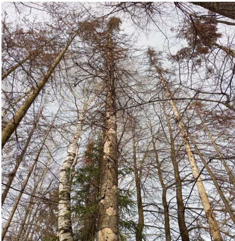
Аварийное дерево № 23