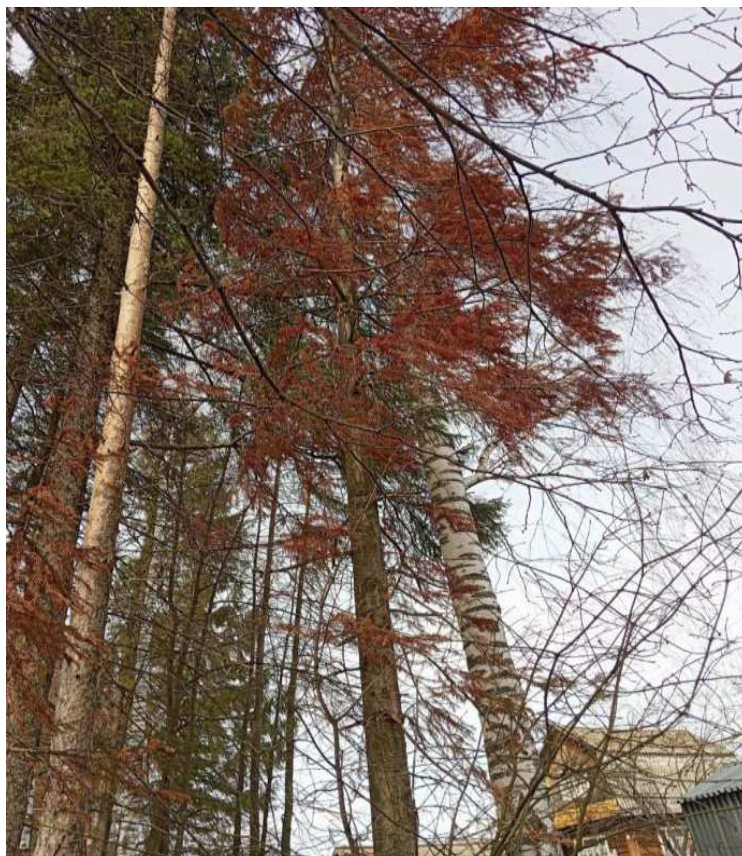
Аварийное дерево № 10