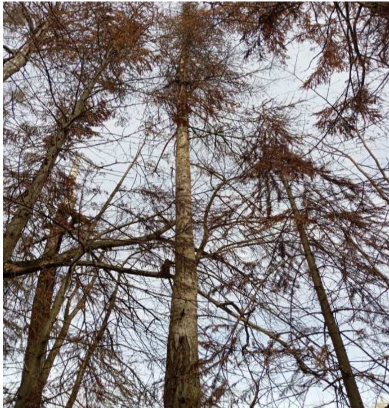
Аварийное дерево № 22