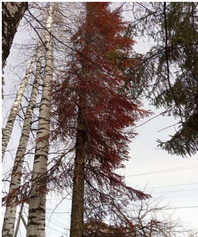
Аварийное дерево № 8