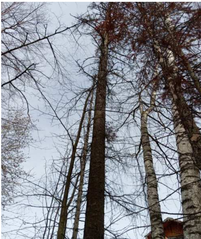
Аварийное дерево № 27