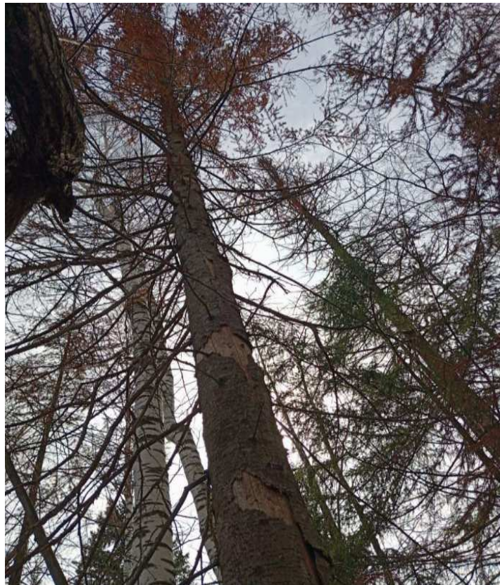
Аварийное дерево № 20