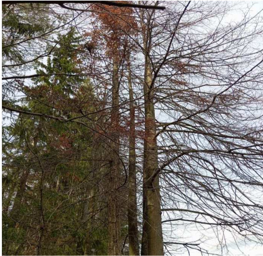
Аварийное дерево № 19