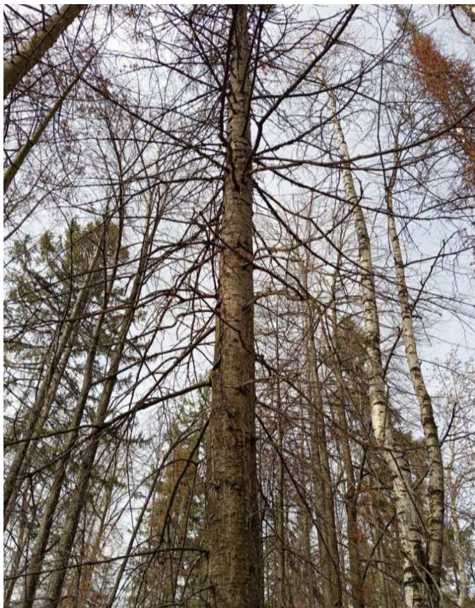
Аварийное дерево № 25