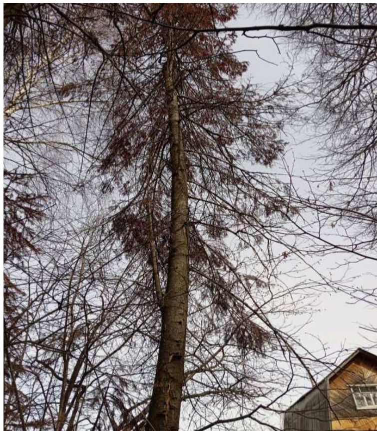
Аварийное дерево № 12