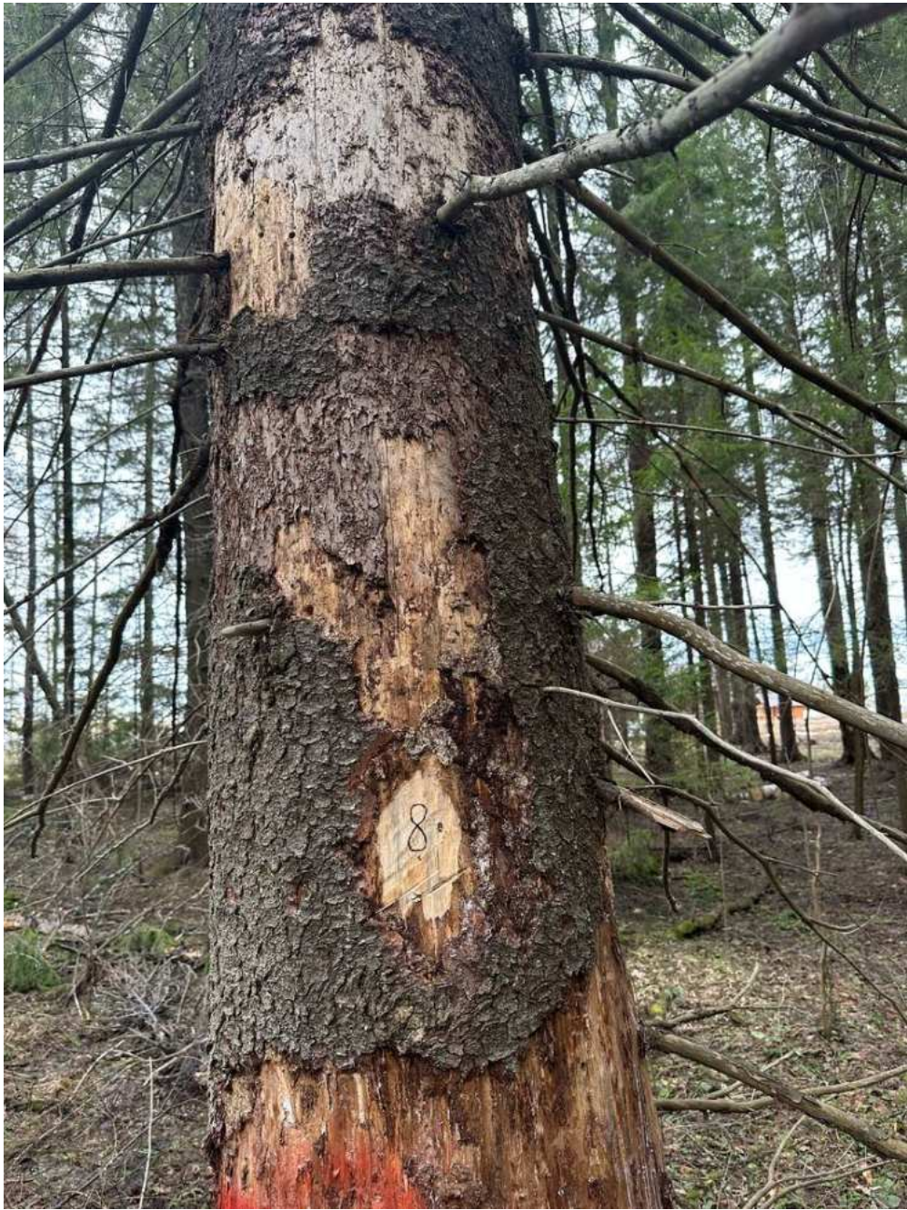
Фото № 8