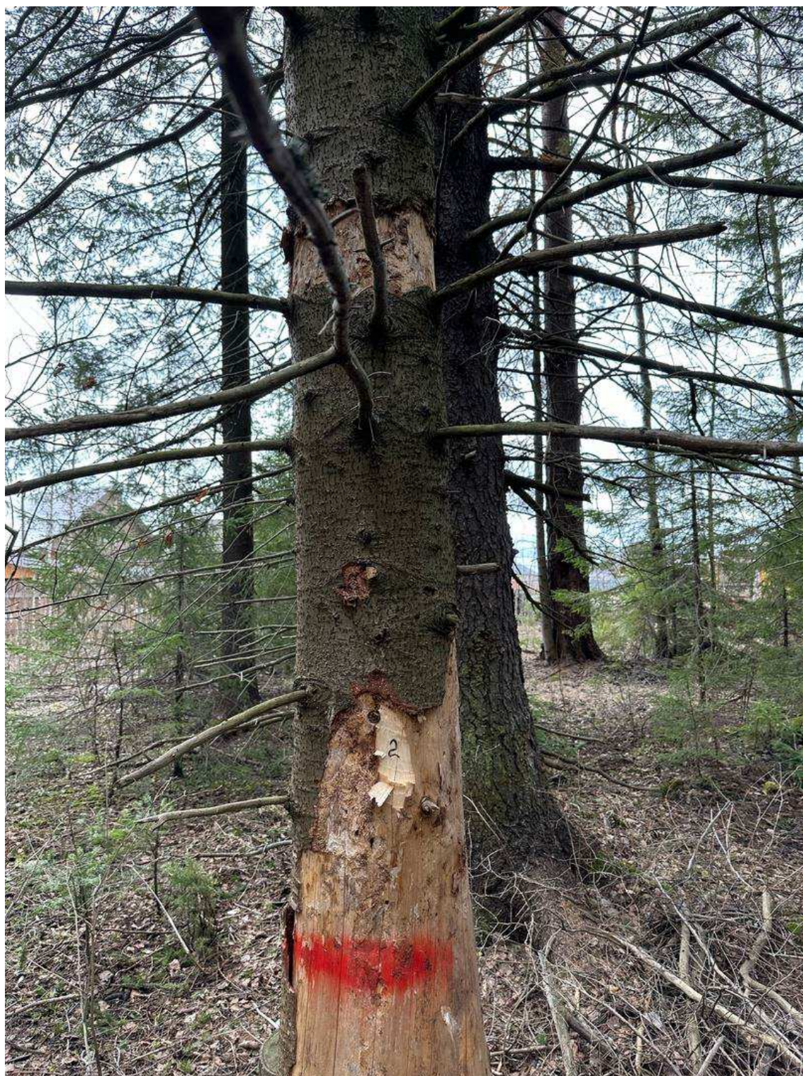
Фото № 2