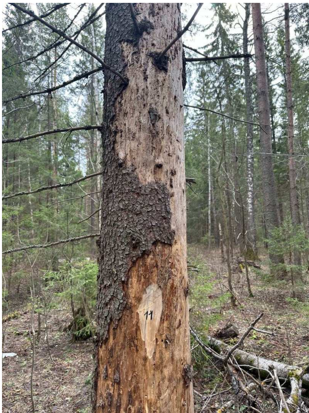
Фото № 11