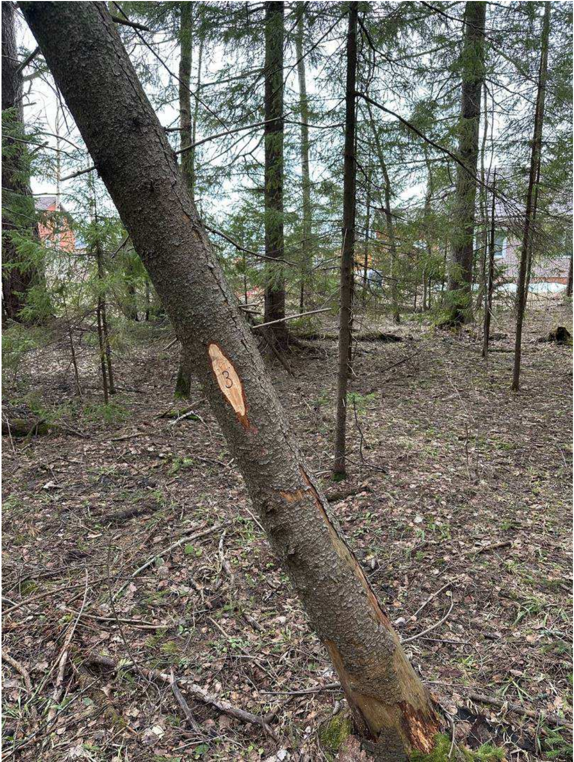
Фото № 3