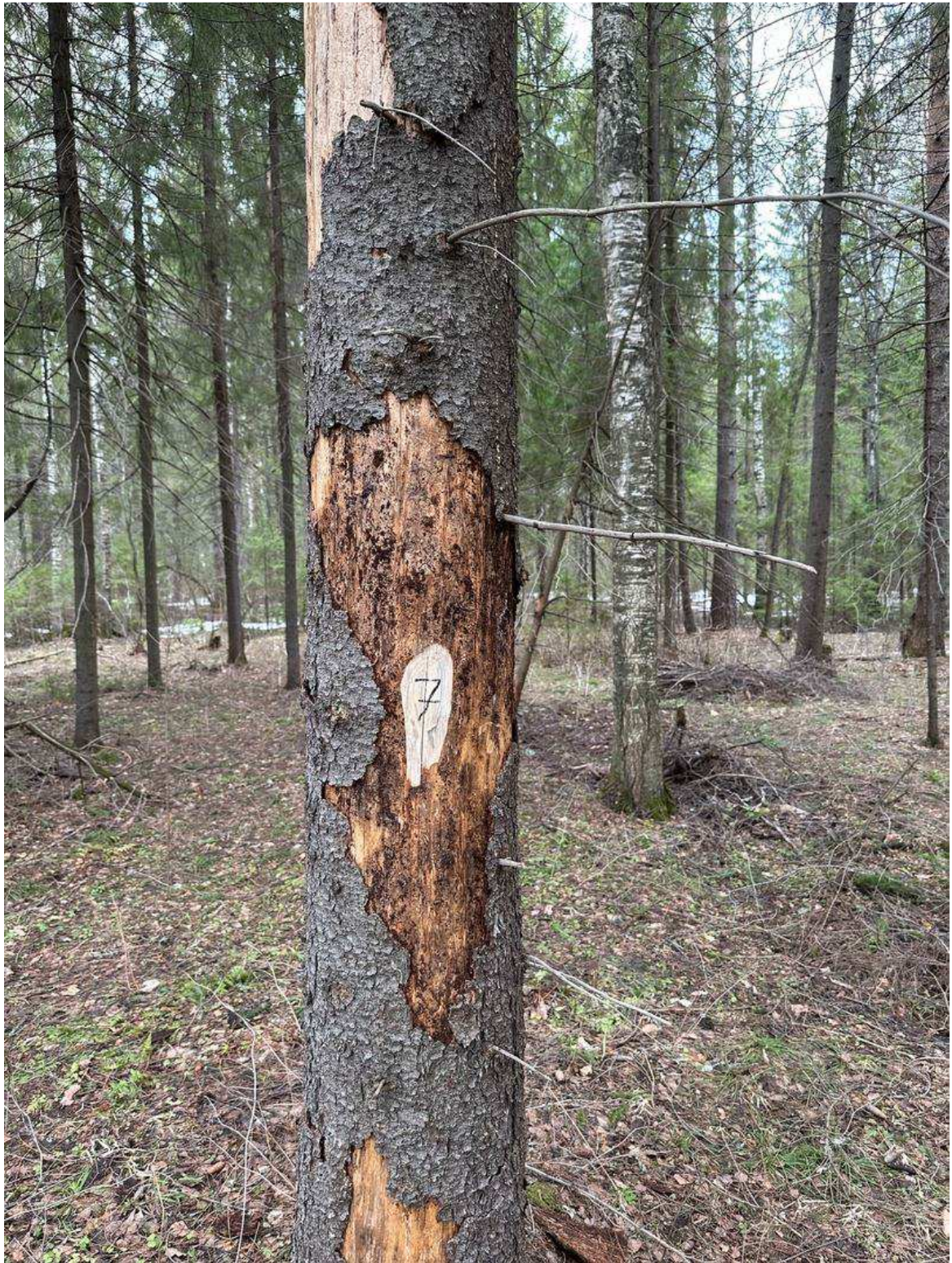
Фото № 7