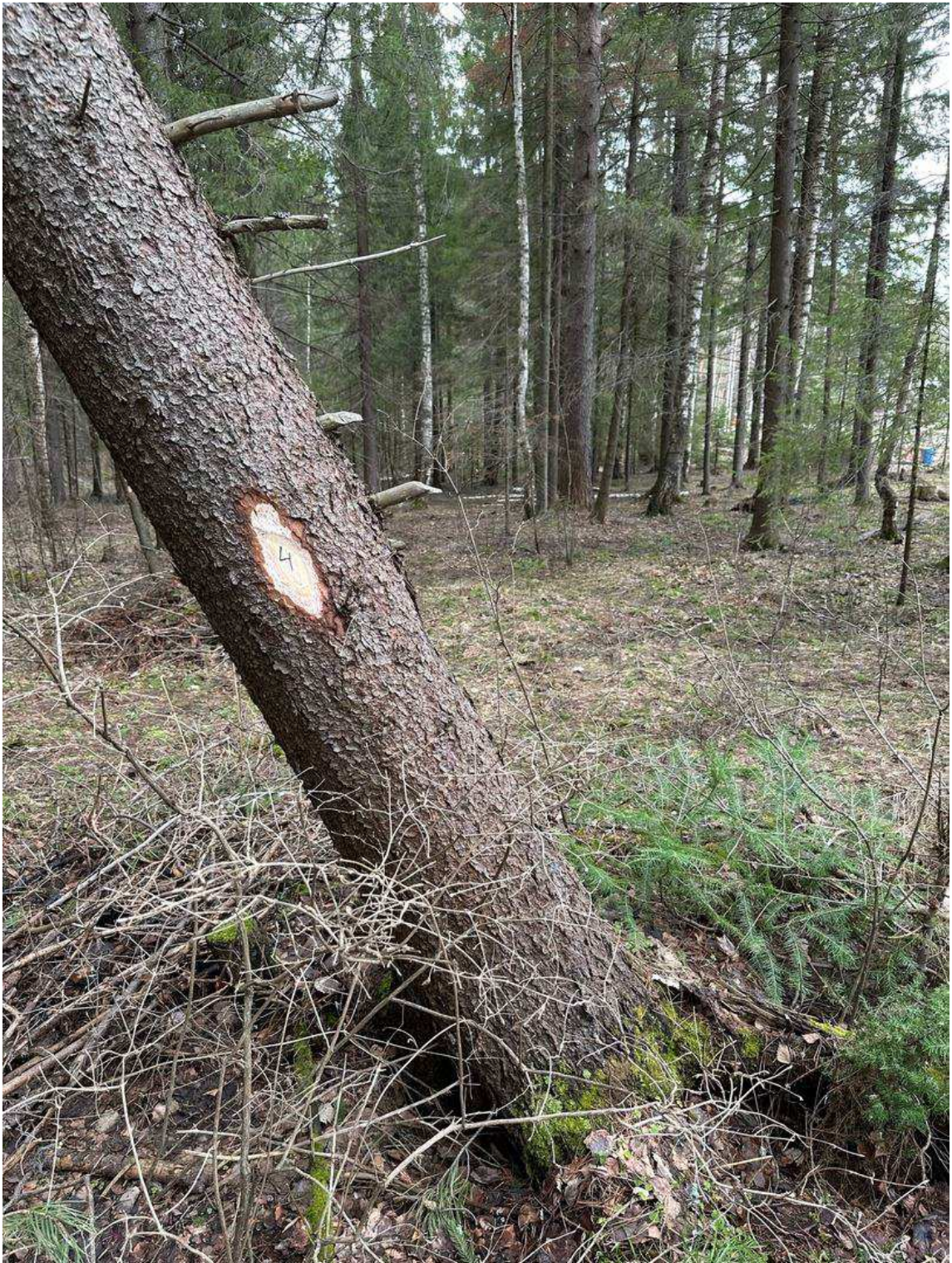
Фото № 4