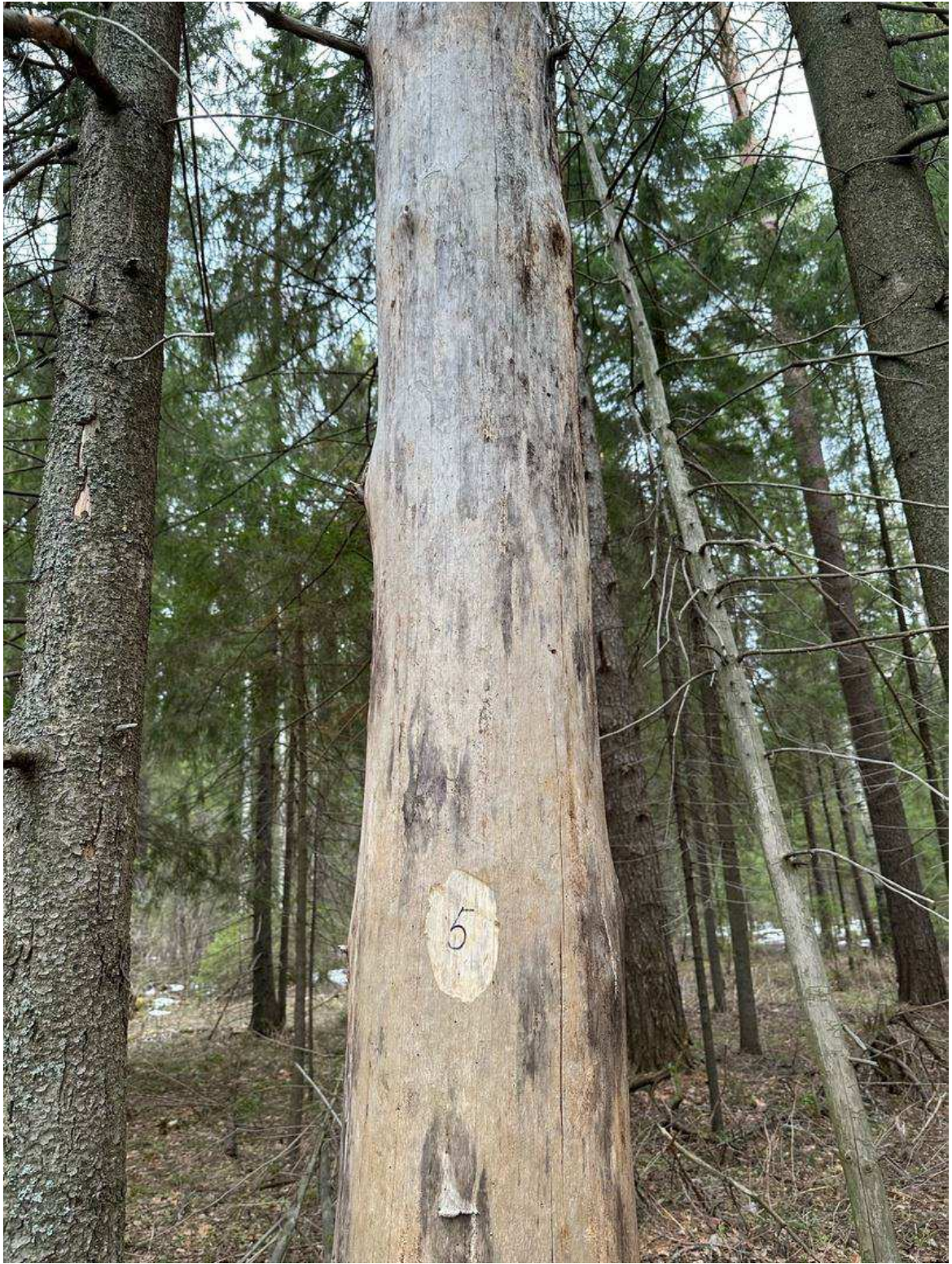
Фото № 5