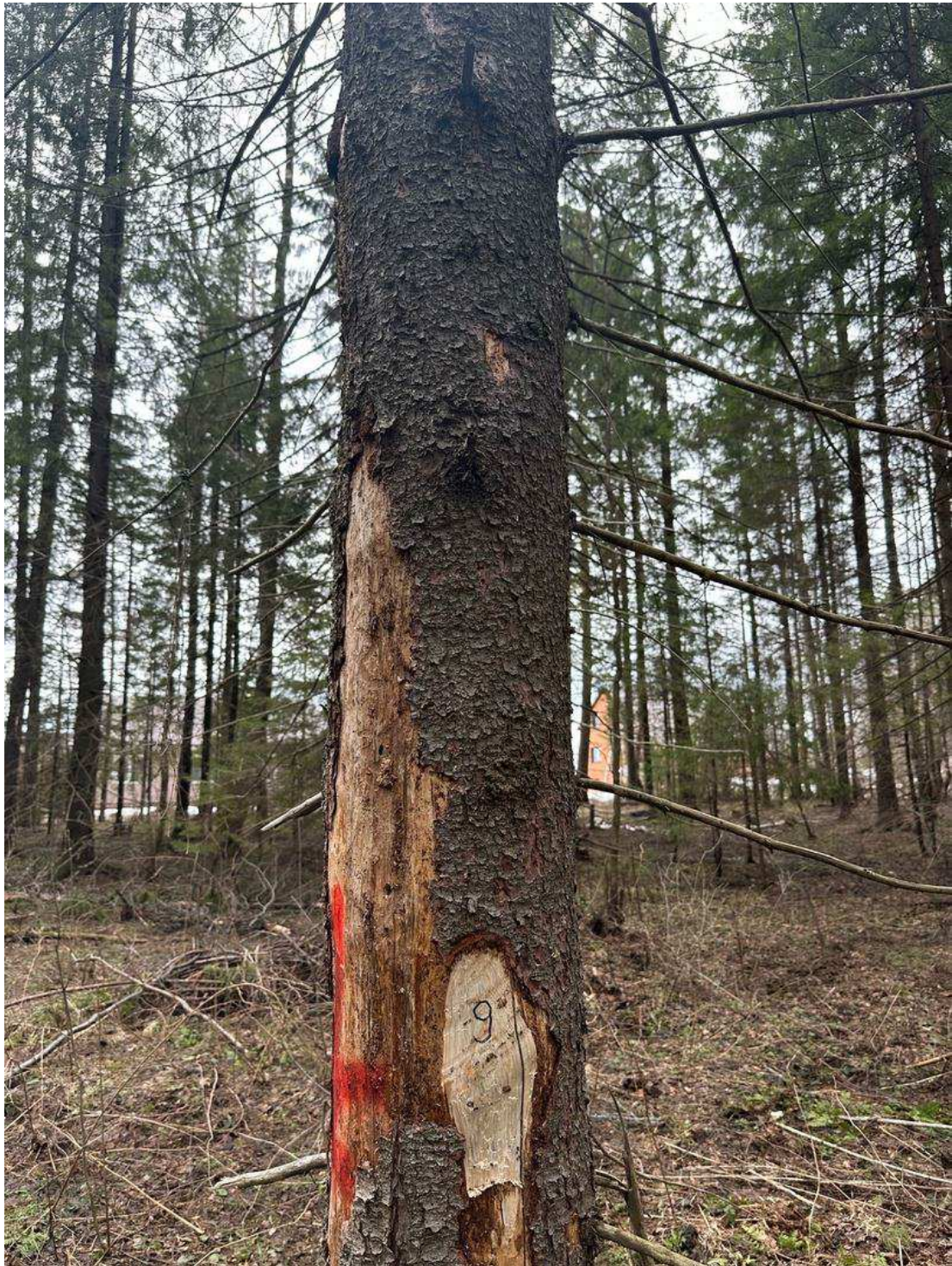
Фото № 9