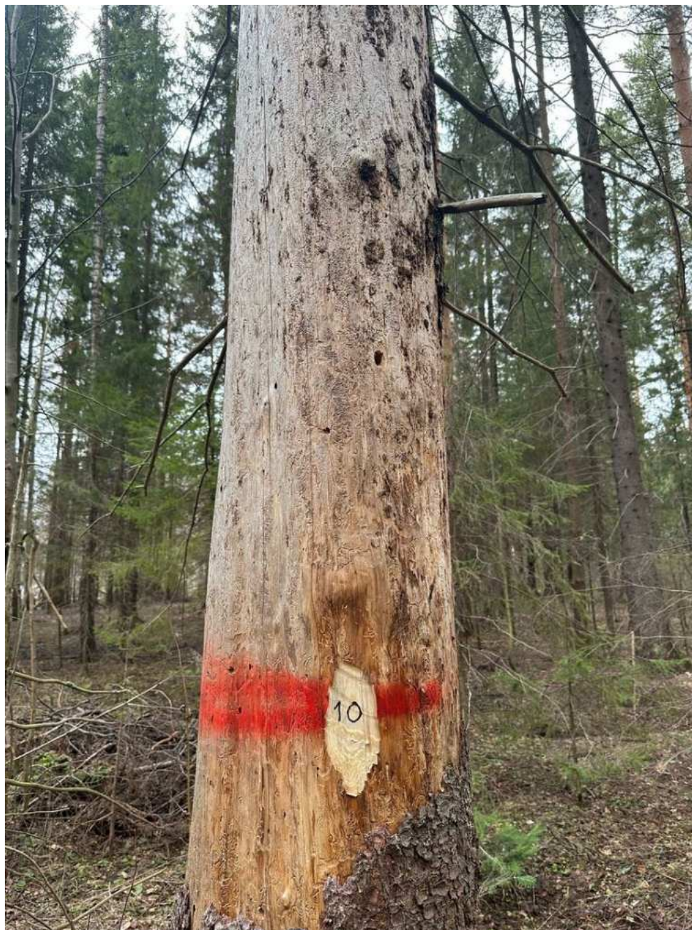
Фото № 10