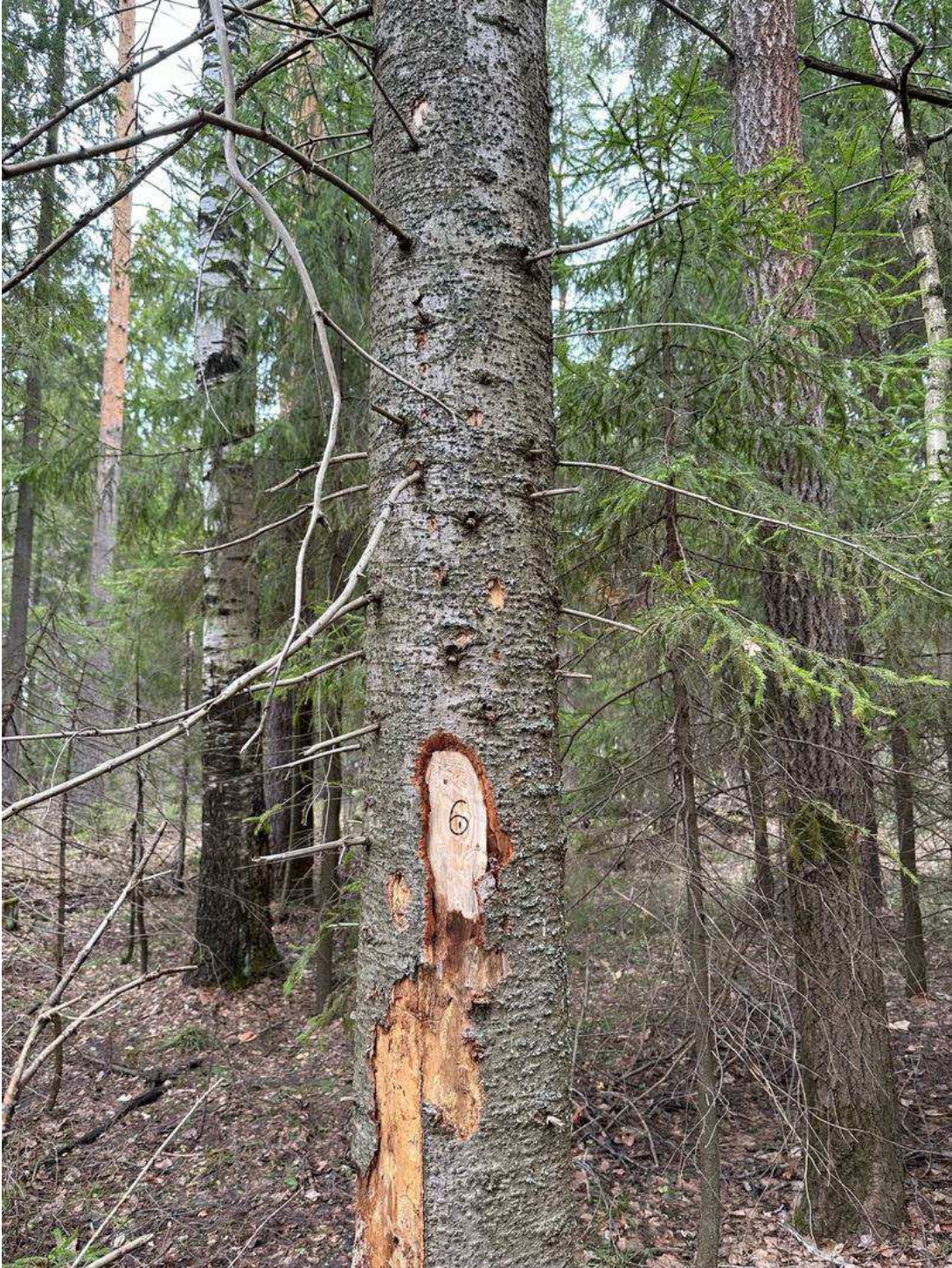
Фото № 6