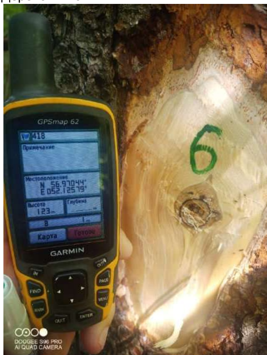
Дерево № 6