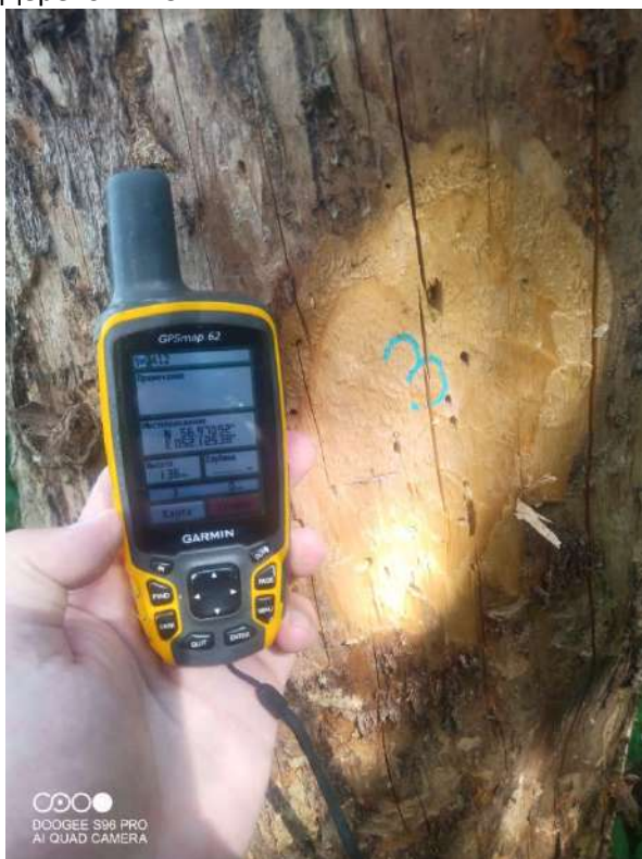
Дерево № 3