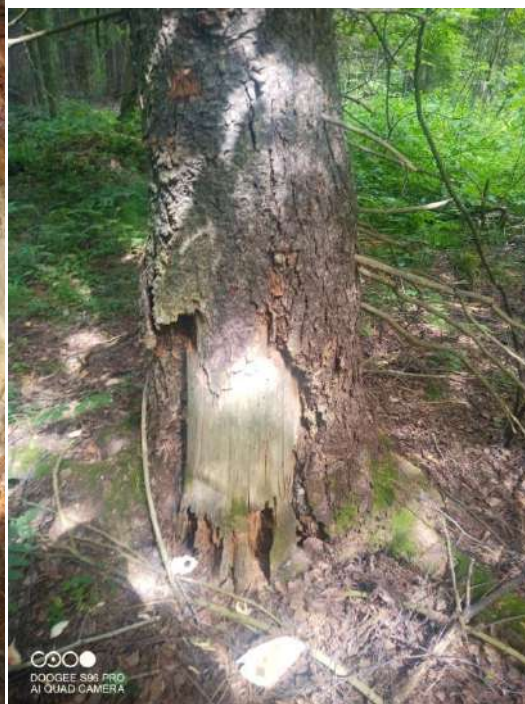
Координаты: 56.97044, 52.12579