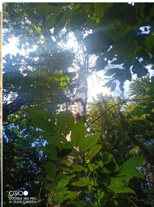
Координаты: 56.97068, 52.12504