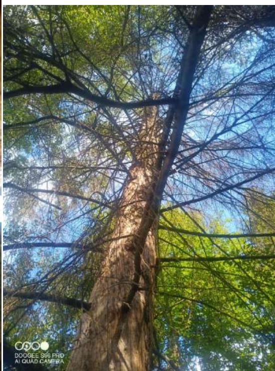
Координаты: 56.97076, 52.12519