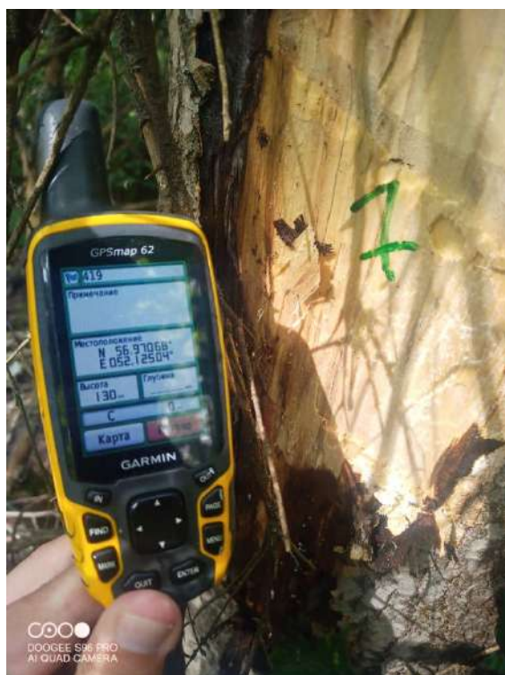
Дерево № 7