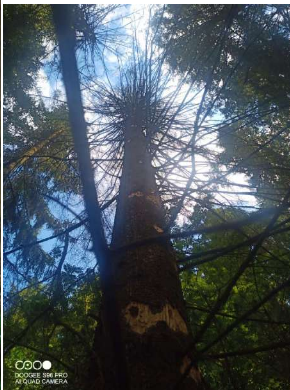
Координаты: 56.97092, 52.12538