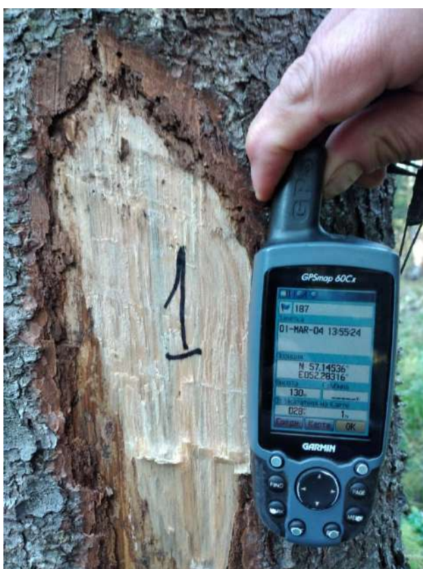
Аварийное дерево №1

Увинское лесничество, Северное участковое лесничество Квартал 73, выдел 21