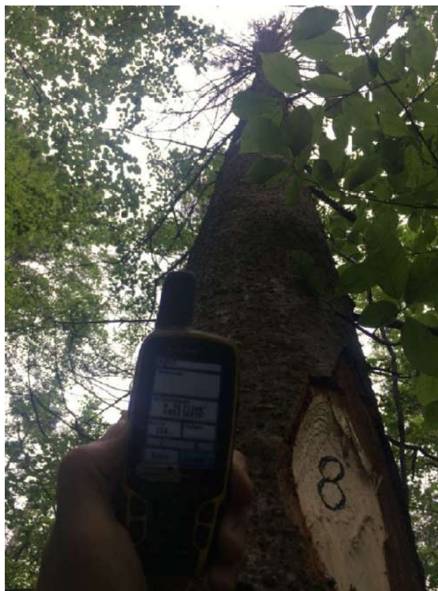
Аварийное дерево №8