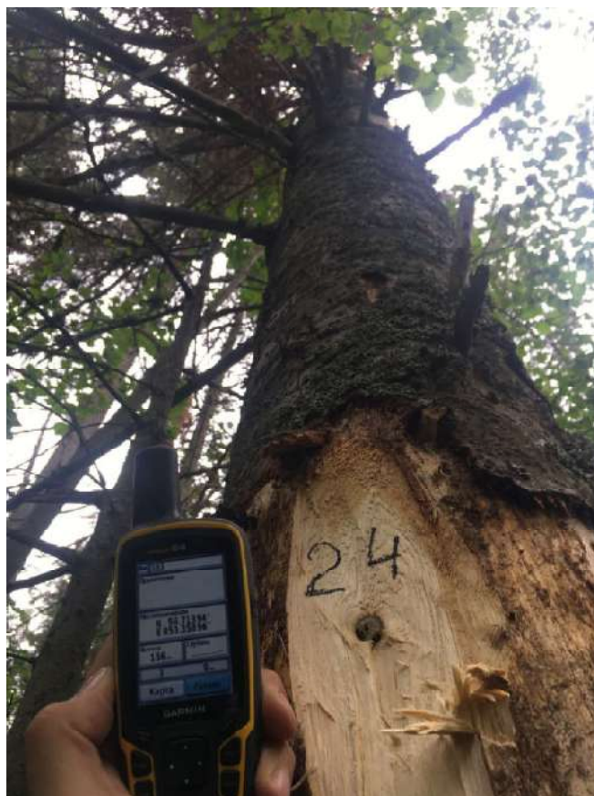
Координаты 56.71394 53.35896