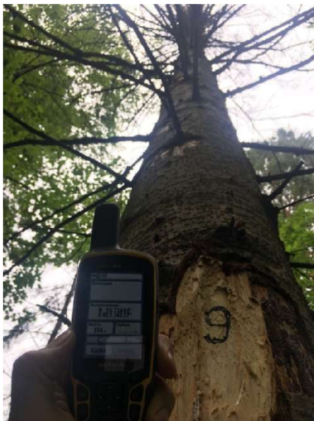
Аварийное дерево №9