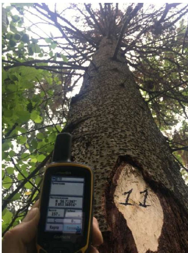
Аварийное дерево №11