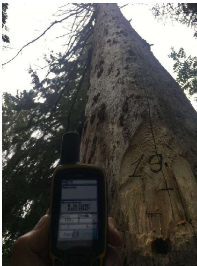
Аварийное дерево №19