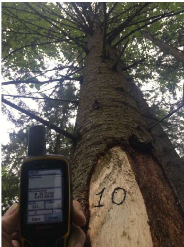
Аварийное дерево №10