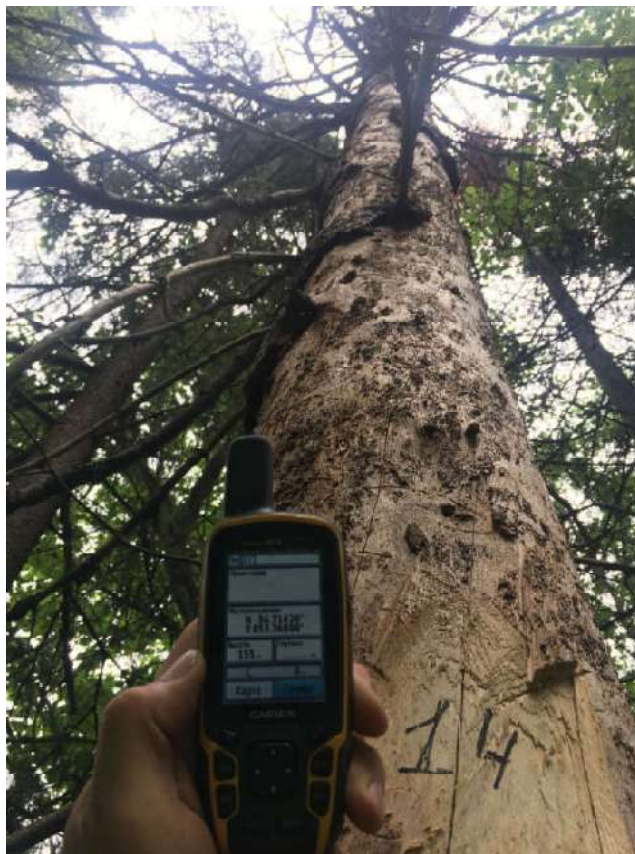
Аварийное дерево №14