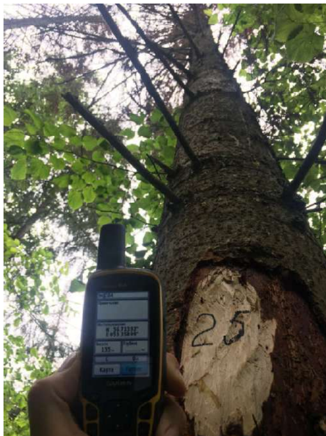
Координаты 56.71392 53.35899