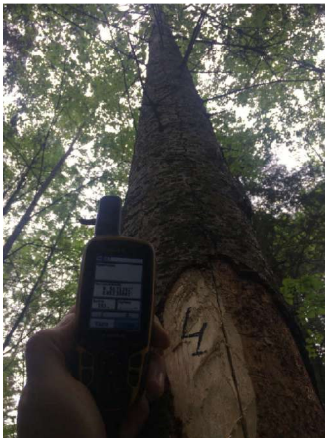
Аварийное дерево №4