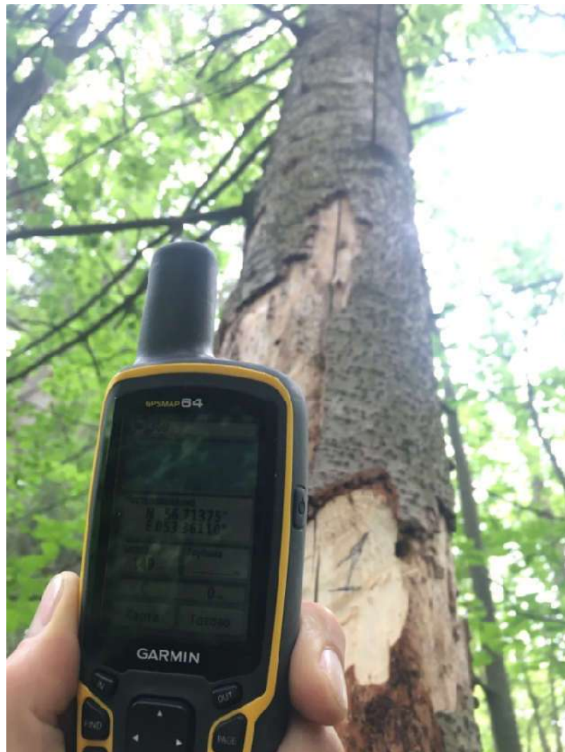
Аварийное дерево №1

Завьяловское лесничество, Пригородное участковое лесничество квартал 31, выдел 26