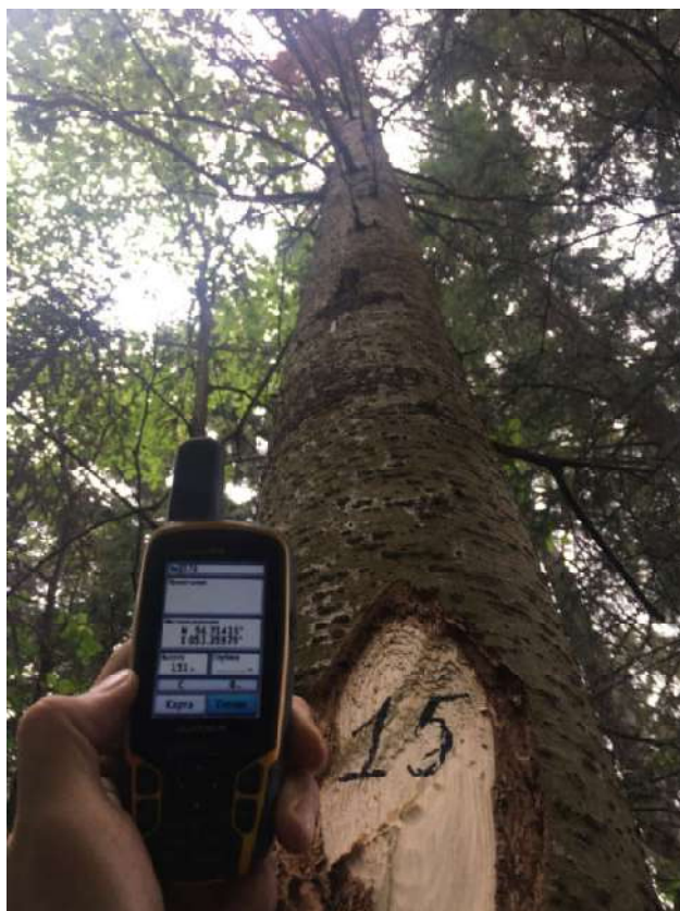
Аварийное дерево №15