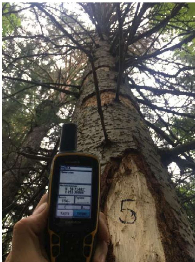
Аварийное дерево №5