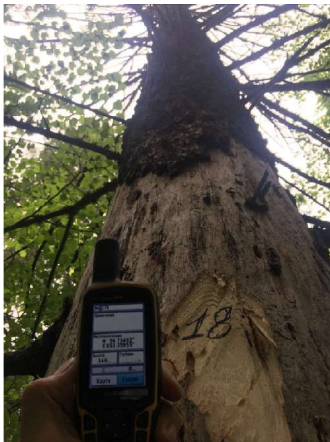
Аварийное дерево №18