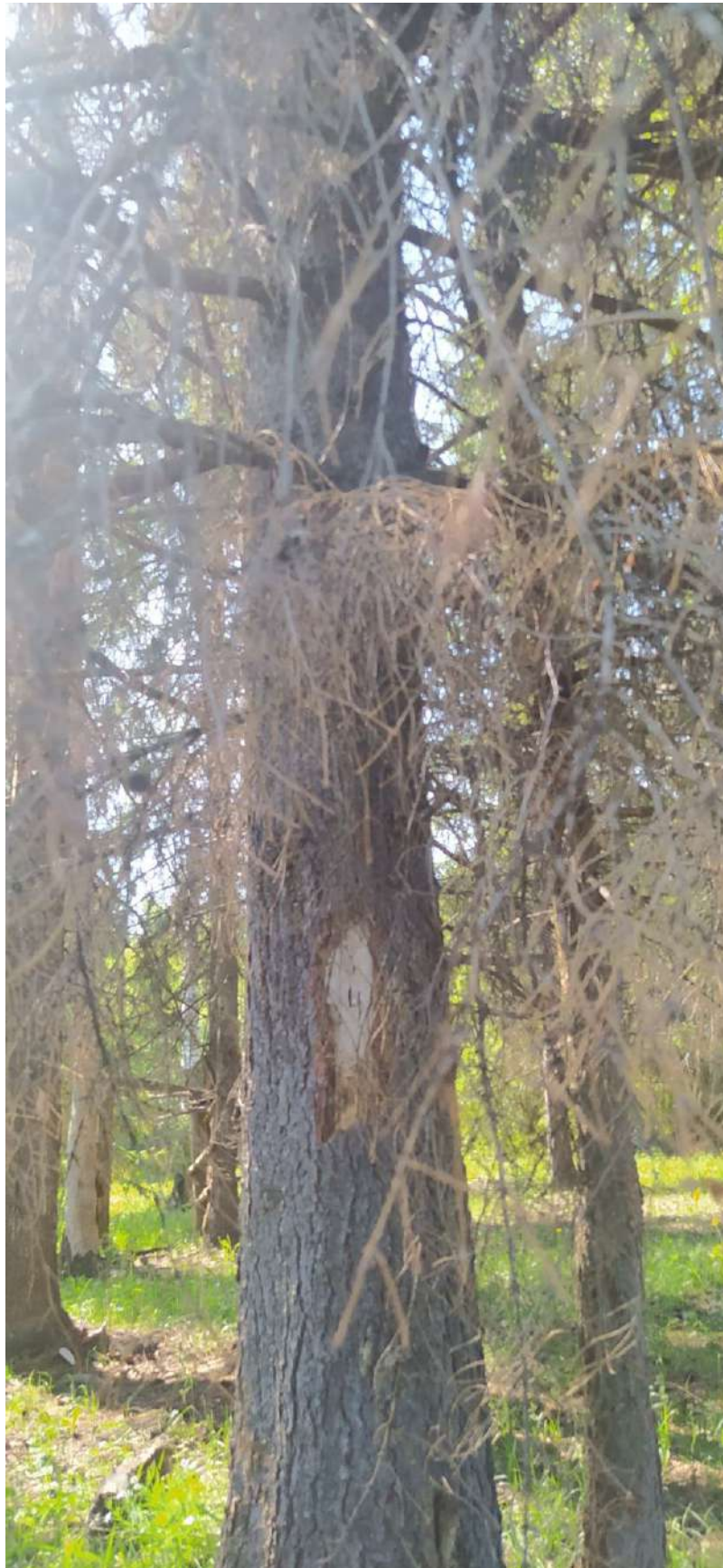
Ааврийное дерево № 4