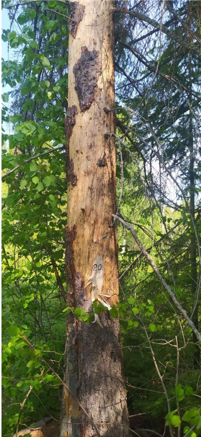
Аварийное дерево № 20