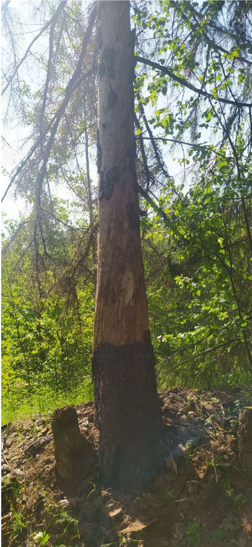
Ааврийное дерево № 5