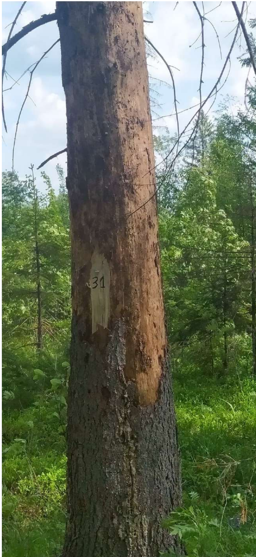
Аварийное дерево № 31