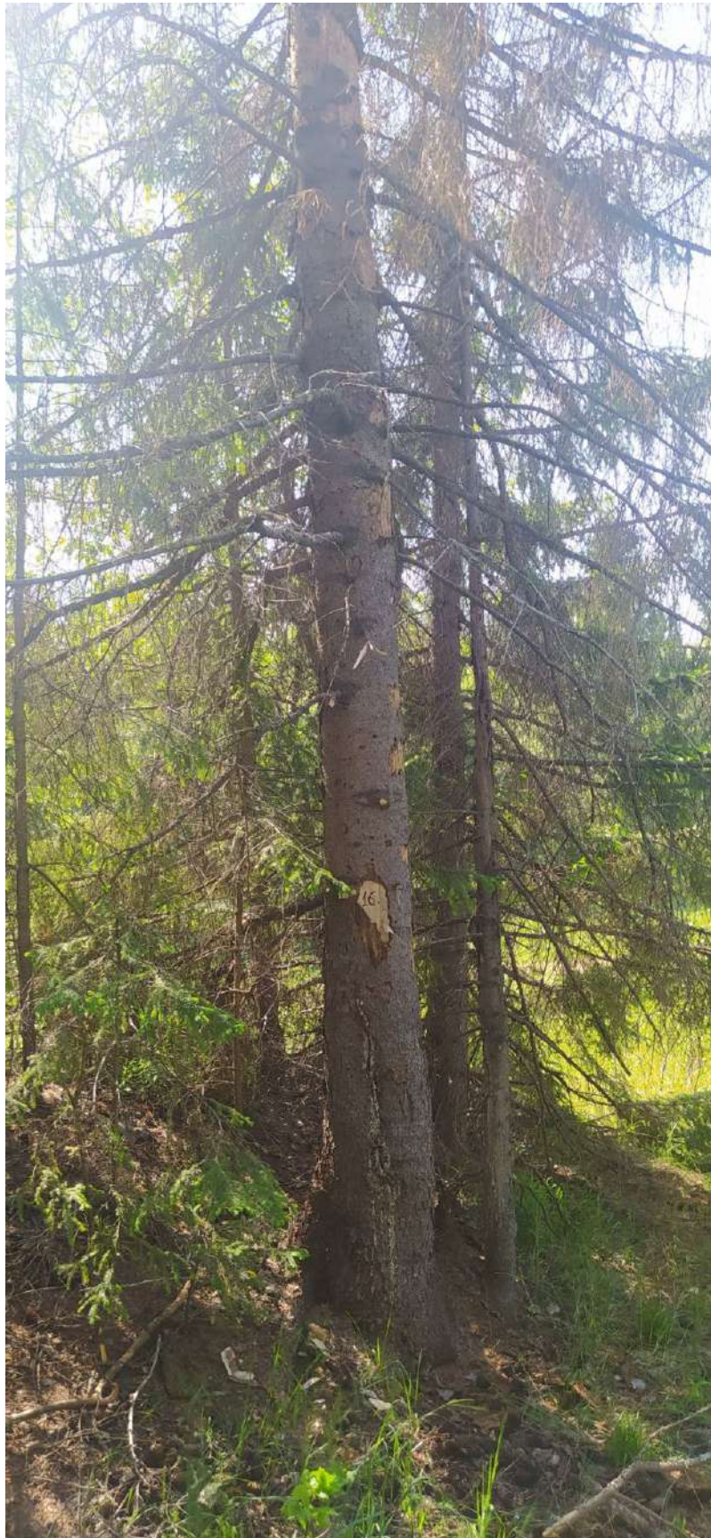
Аварийное дерево № 16