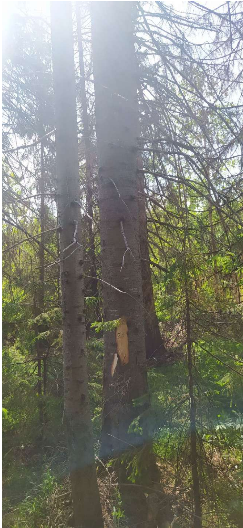
Аварийное дерево № 25