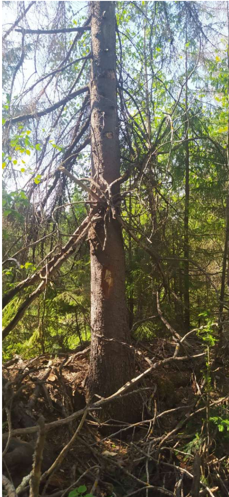
Аварийное дерево № 15