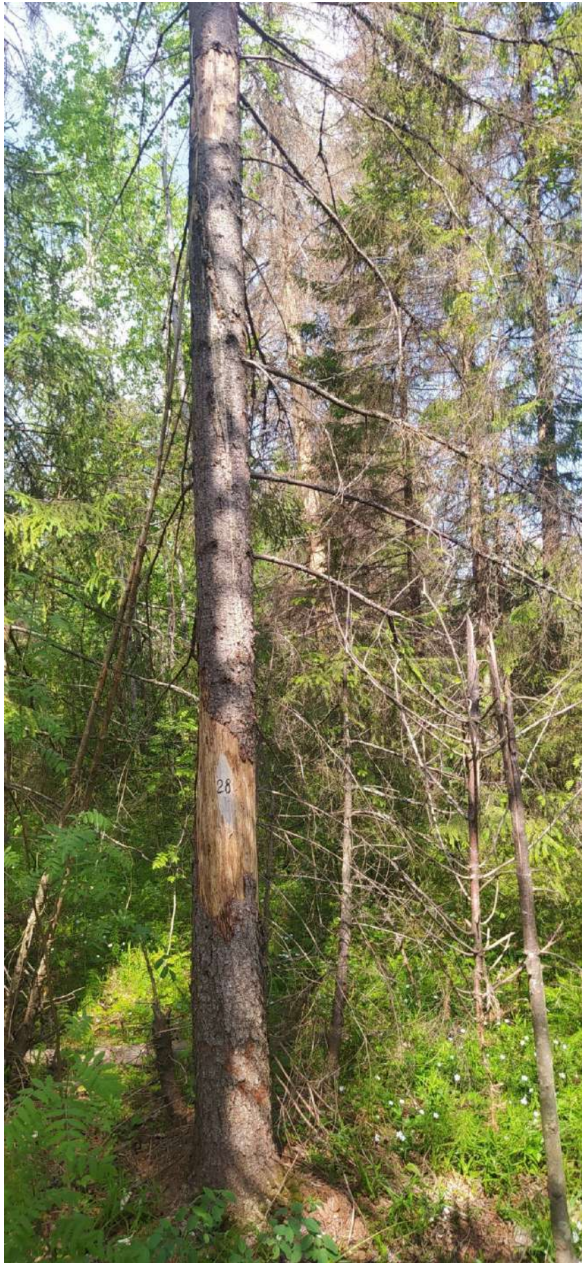
Аварийное дерево № 28