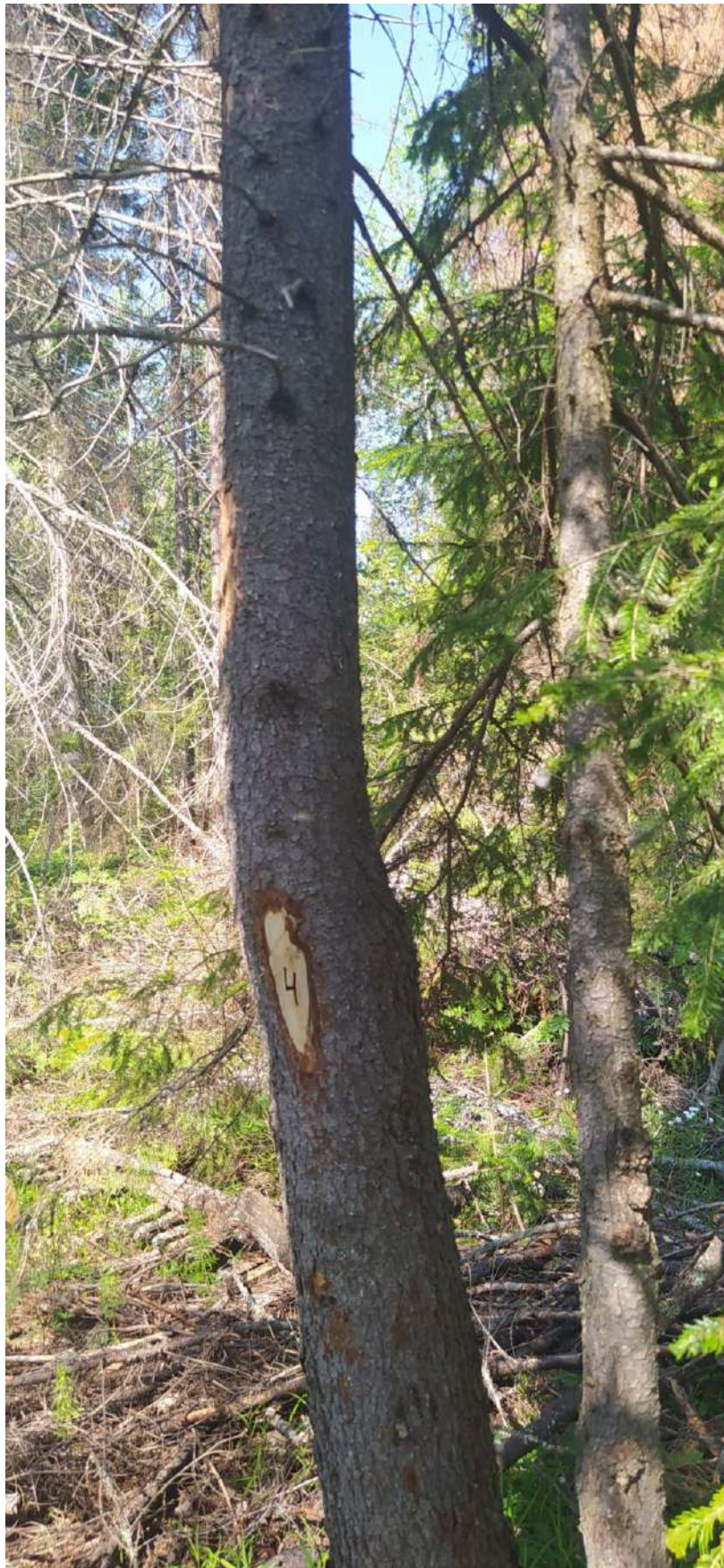
Ааврийное дерево № 4