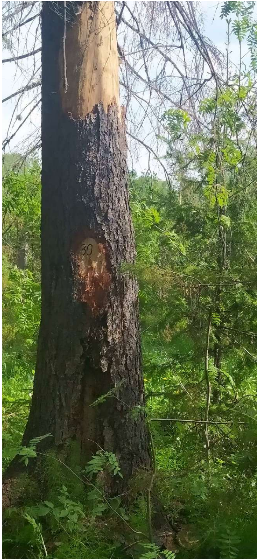
Аварийное дерево № 30