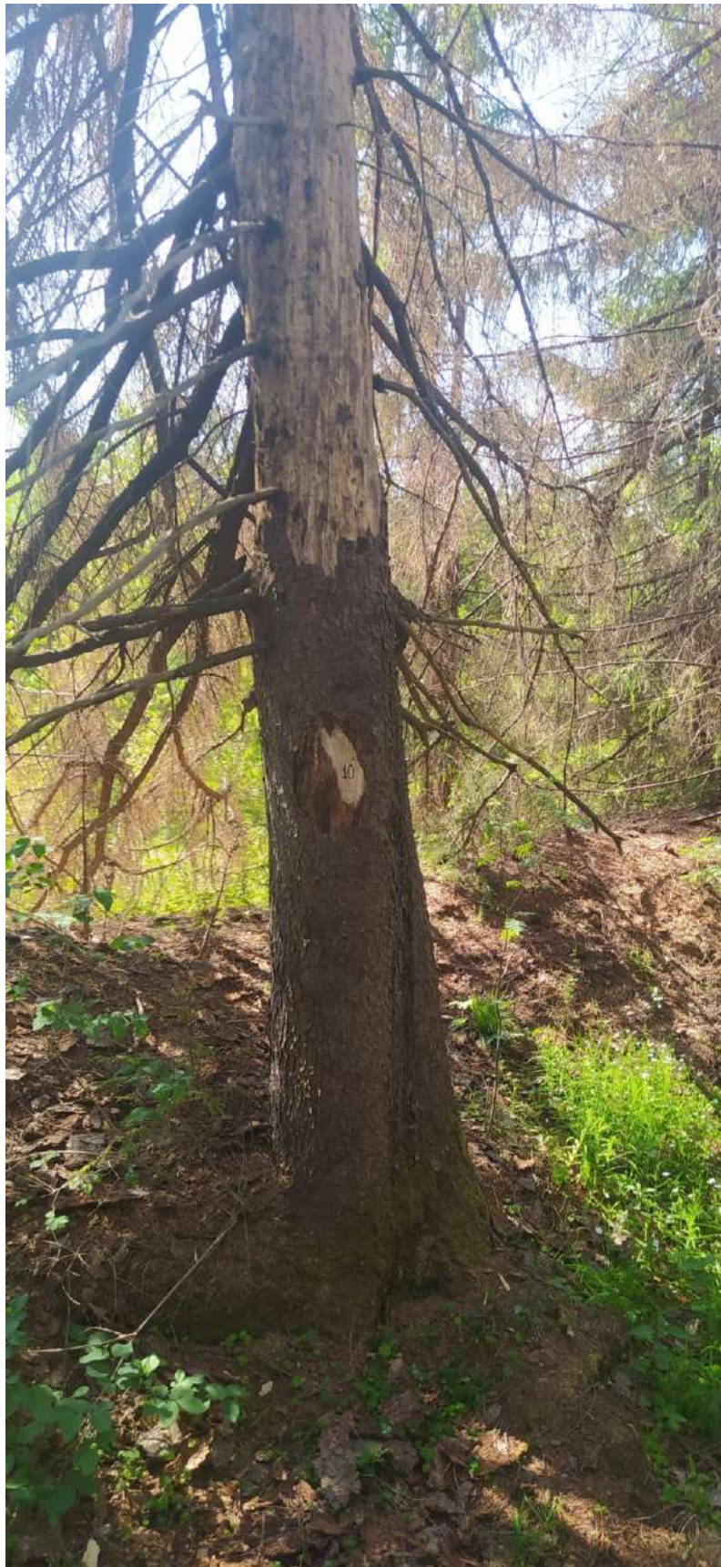
Аварийное дерево № 10