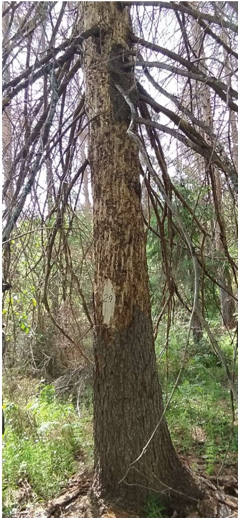
Аварийное дерево № 29