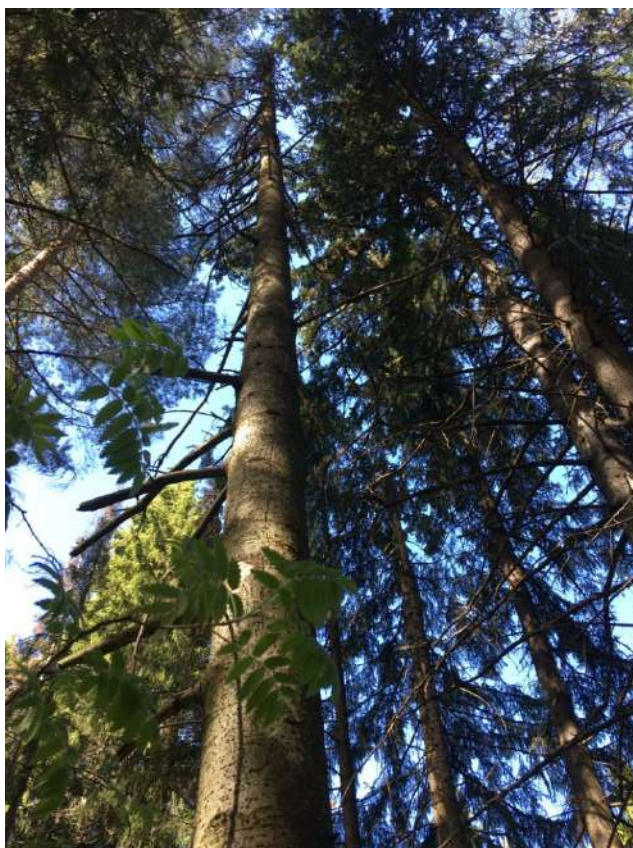
Аварийное дерево № 7