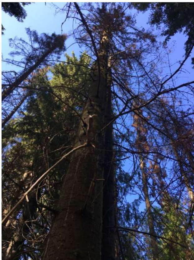
Аварийное дерево № 6