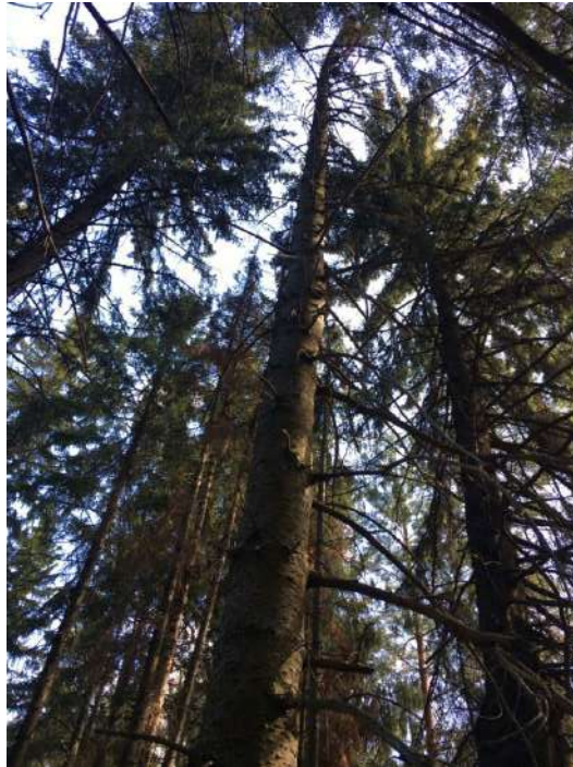
Аварийное дерево № 8