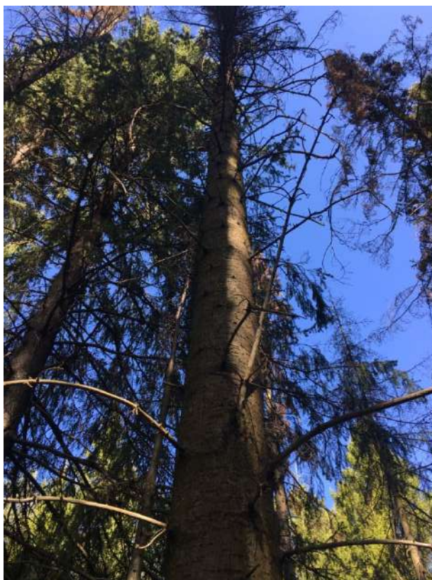
Аварийное дерево № 5