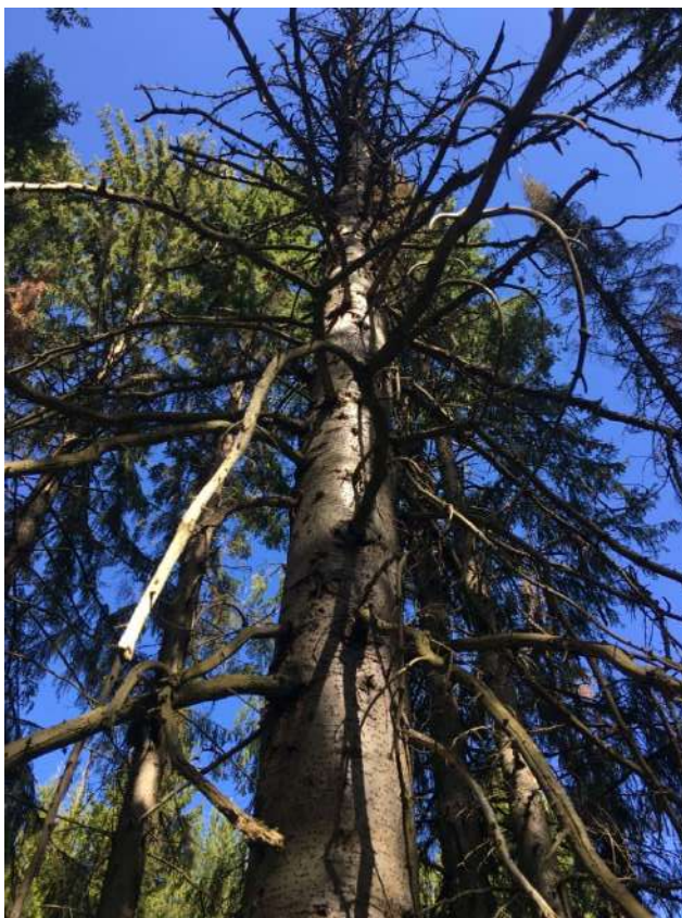
Аварийное дерево № 4