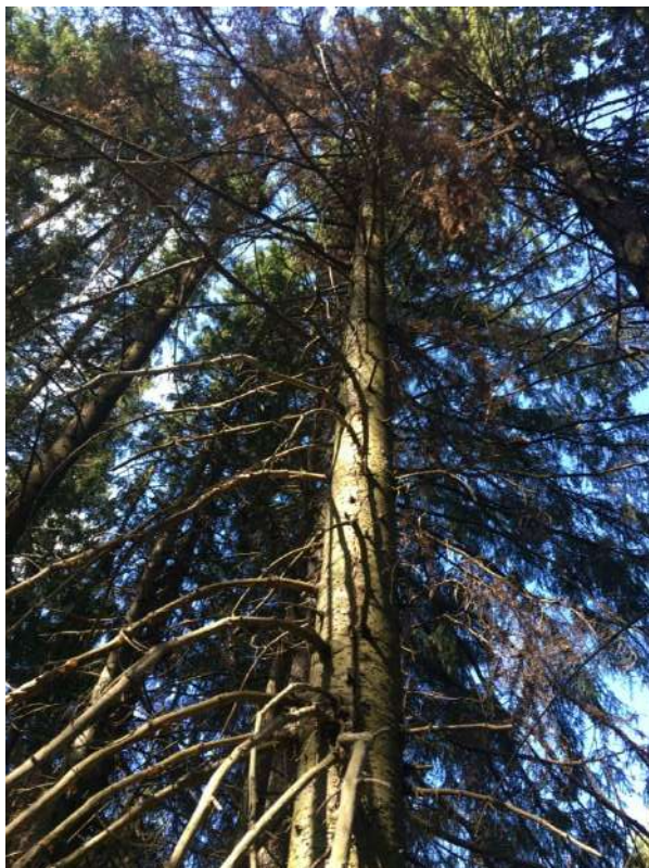
Аварийное дерево № 2