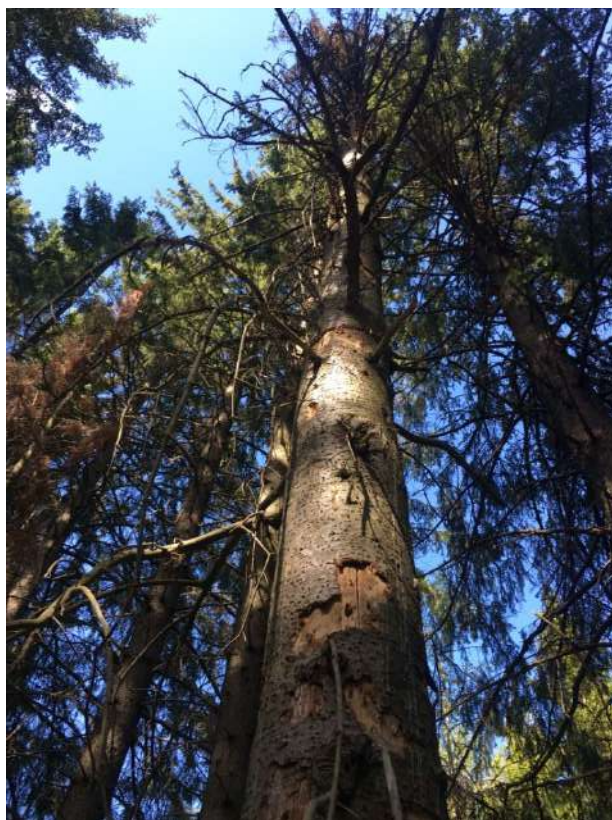
Аварийное дерево № 3