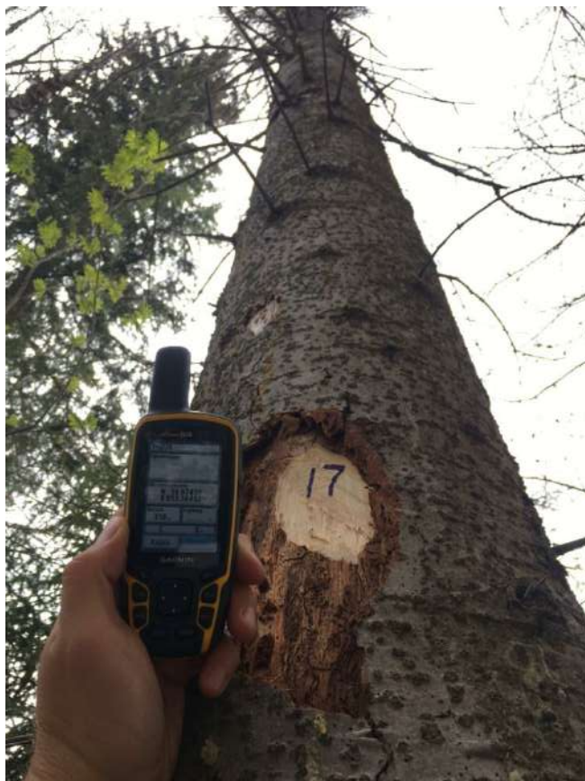
Аварийное дерево №17