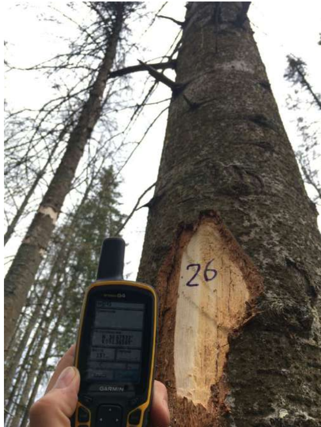
Аварийное дерево № 26