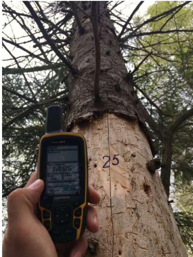
Аварийное дерево №25