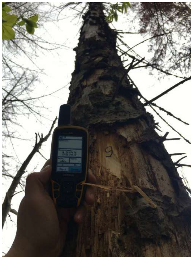
Аварийное дерево №9