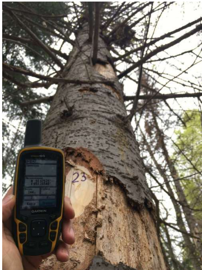
Аварийное дерево №23