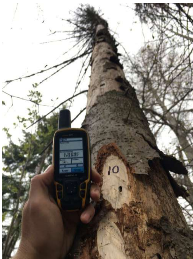
Аварийное дерево №10