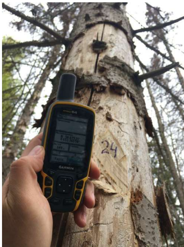
Аварийное дерево №24