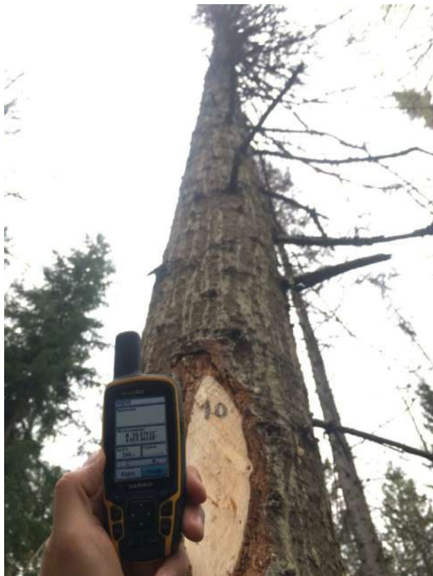
Аварийное дерево № 10