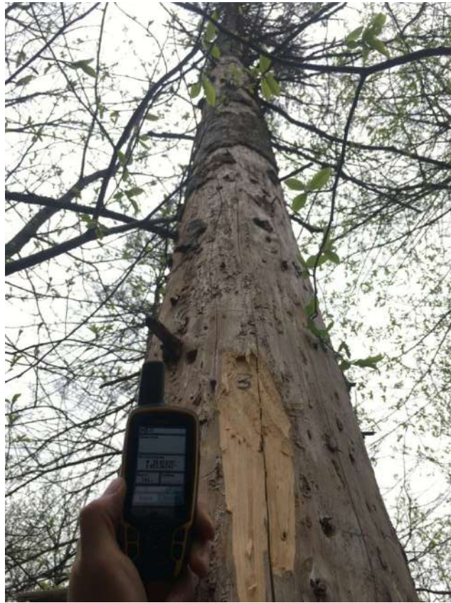
Аварийное дерево № 3