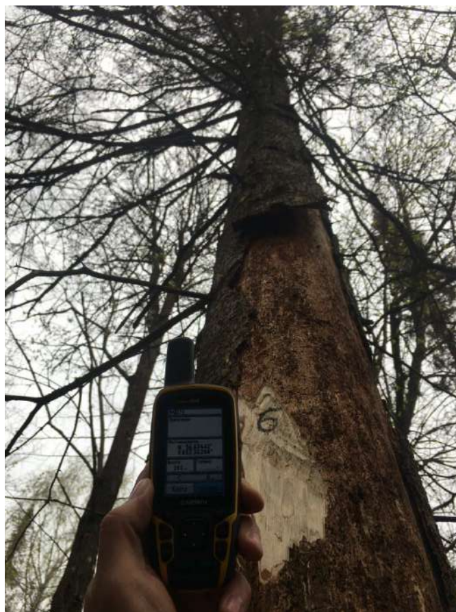
Аварийное дерево № 6