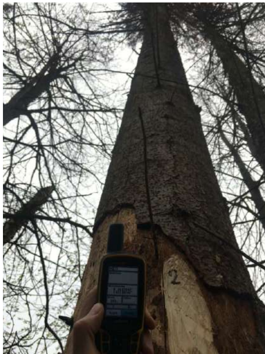
Аварийное дерево № 2