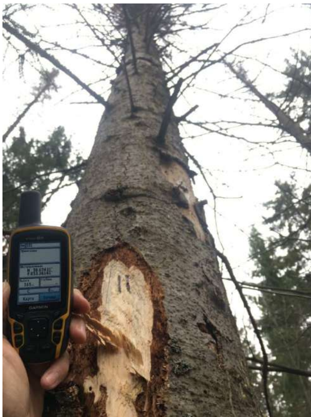
Аварийное дерево № 11