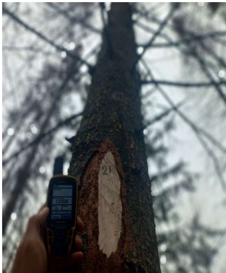
Аварийное дерево № 21