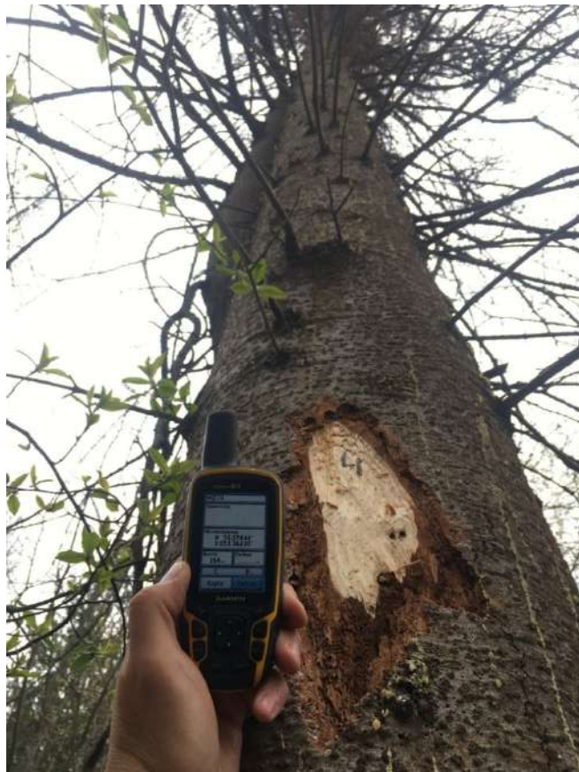
Аварийное дерево № 4