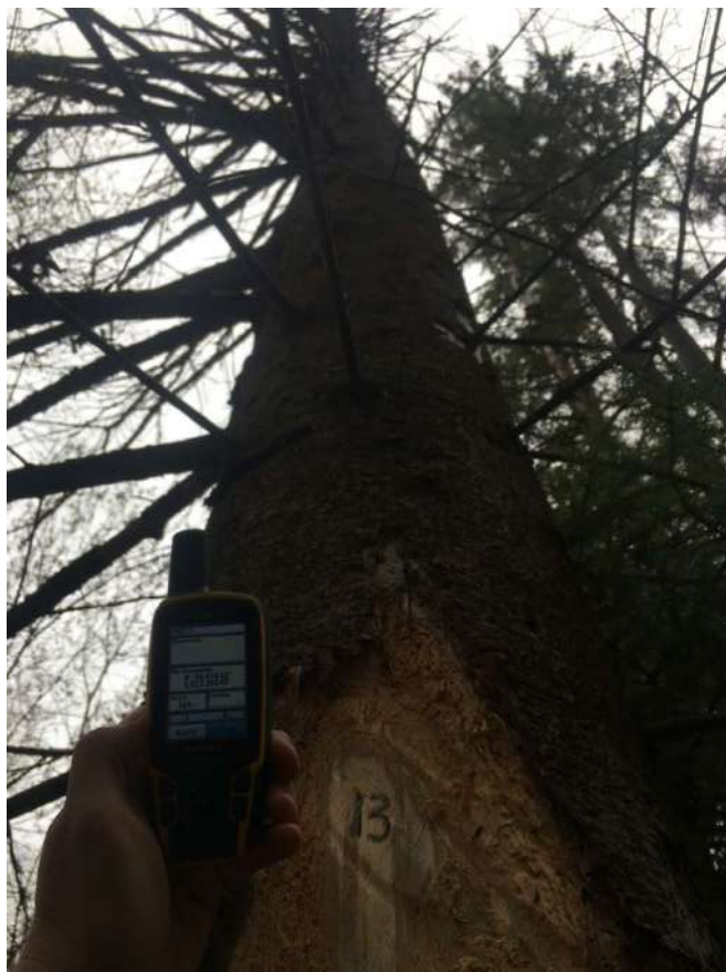
Аварийное дерево № 13