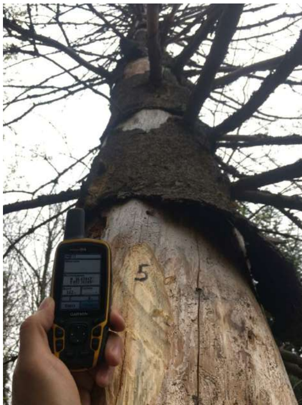
Аварийное дерево № 5