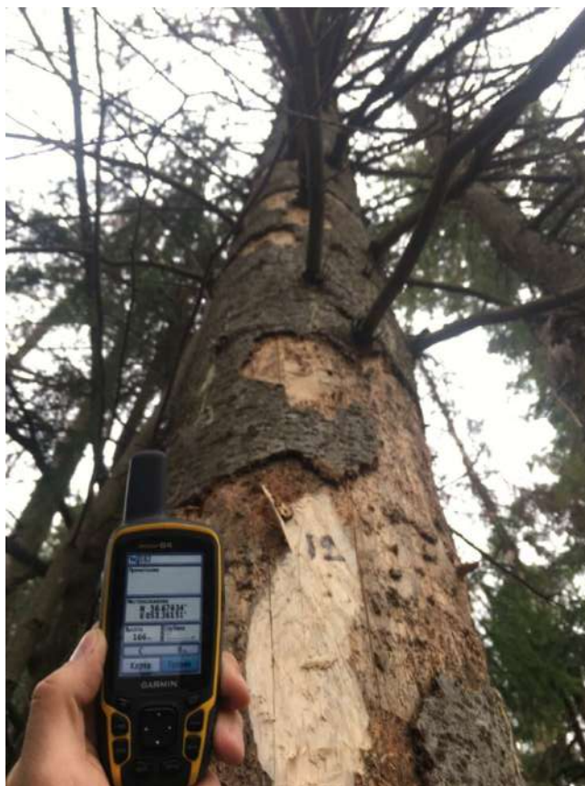
Аварийное дерево № 12