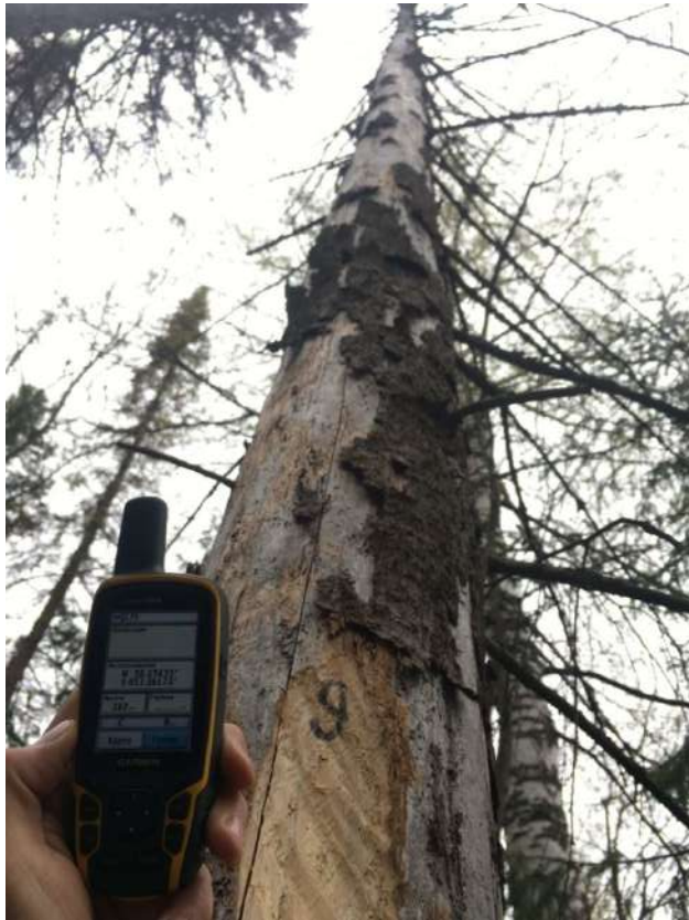
Аварийное дерево № 9