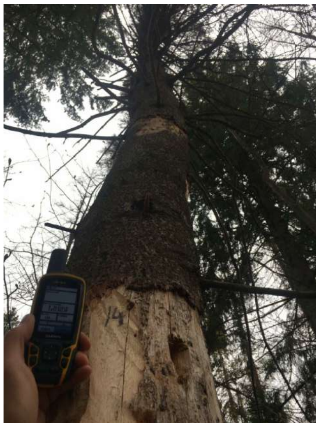
Аварийное дерево № 14