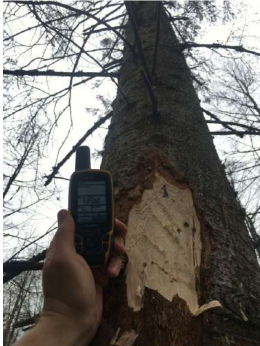
Аварийное дерево № 1

Завьяловское лесничество, Пригородное участковое лесничество квартал 80 выдел 12 (2)