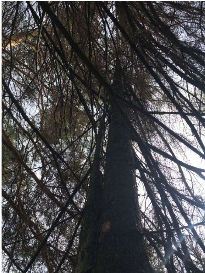
Аварийное дерево № 6