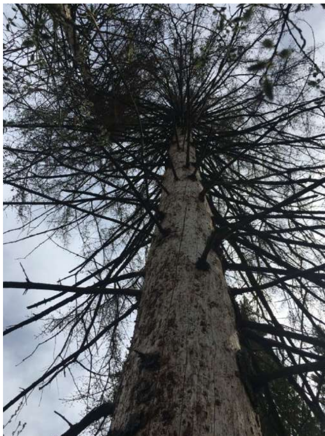
Аварийное дерево № 3