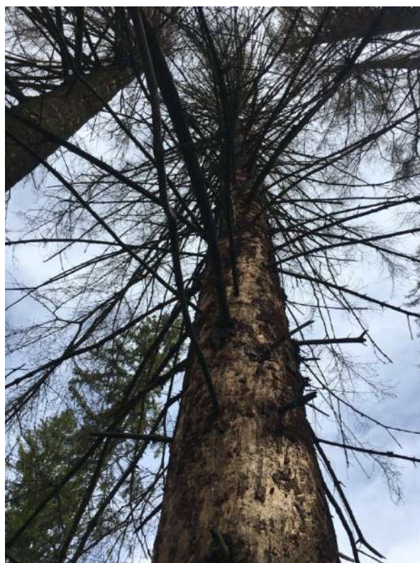
Аварийное дерево № 10