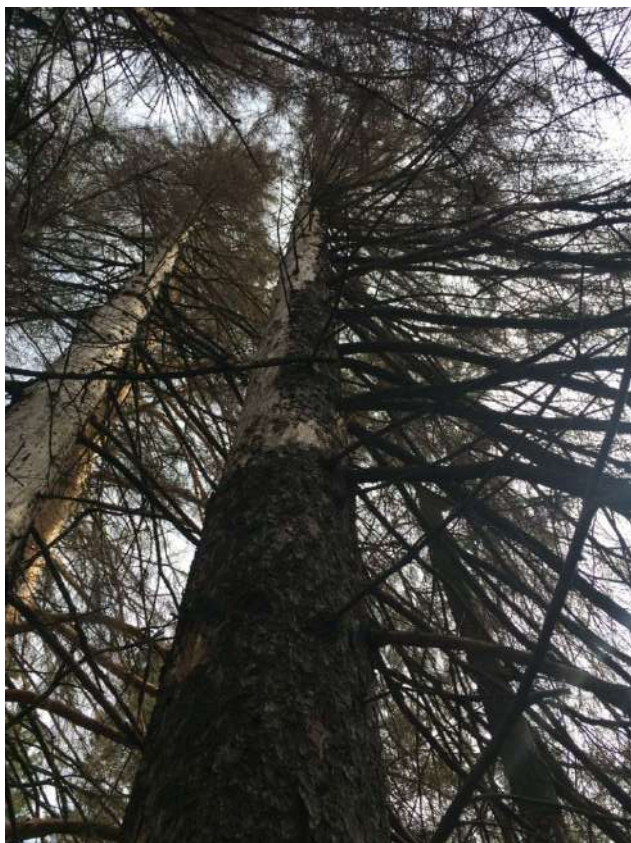
Аварийное дерево № 7