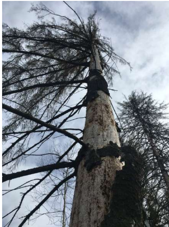
Аварийное дерево № 1

Завьяловское лесничество, Пригородное участковое лесничество квартал 133, выдел 8