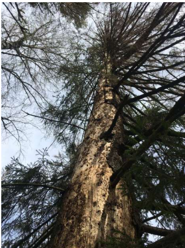
Аварийное дерево № 9