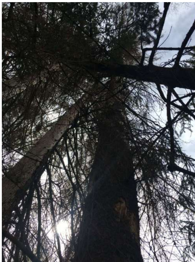
Аварийное дерево № 8