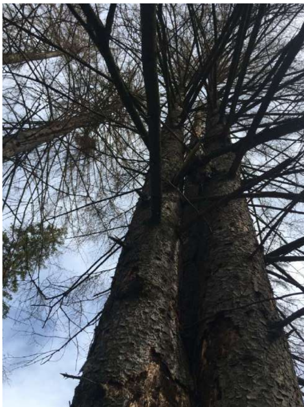
Аварийное дерево № 4