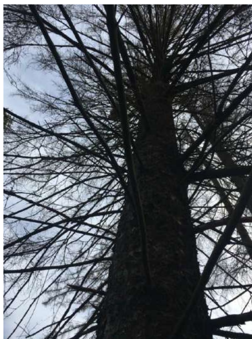
Аварийное дерево № 2