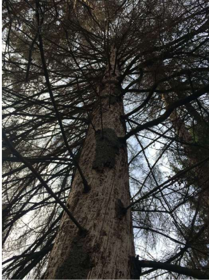
Аварийное дерево № 5