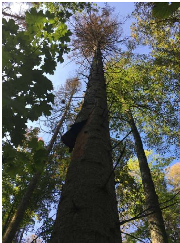
Аварийное дерево №10