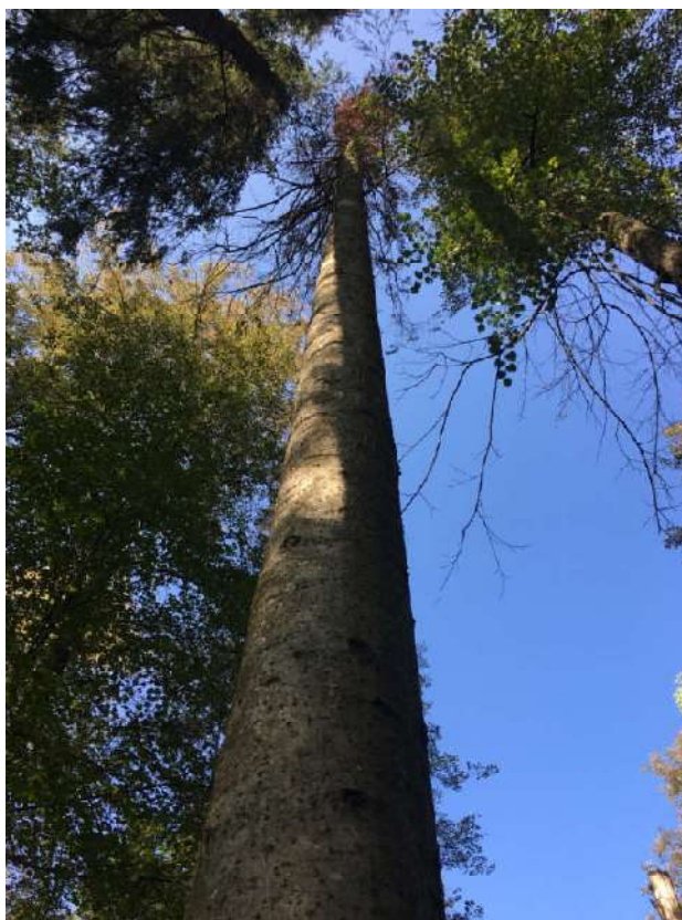
Аварийное дерево №7