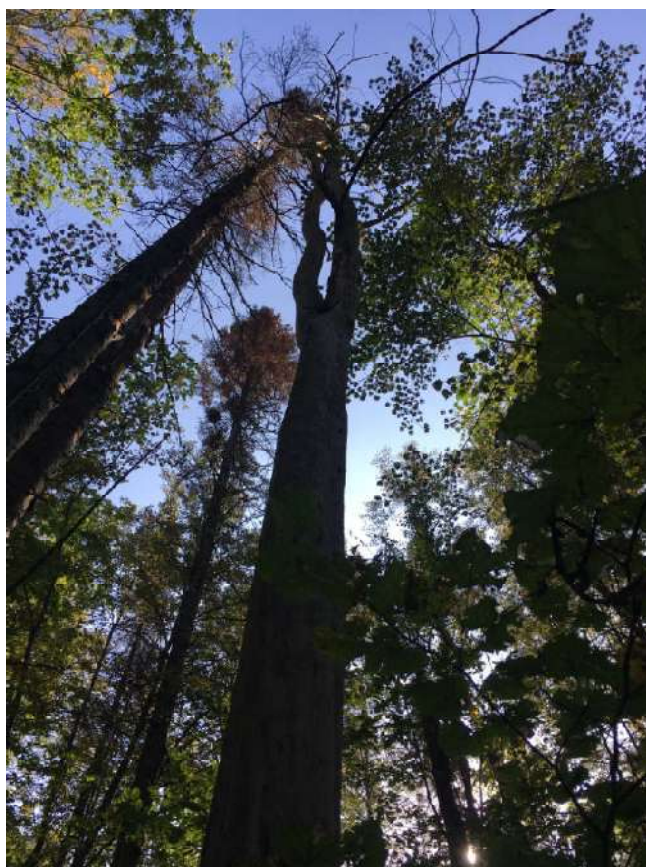
Аварийное дерево №12