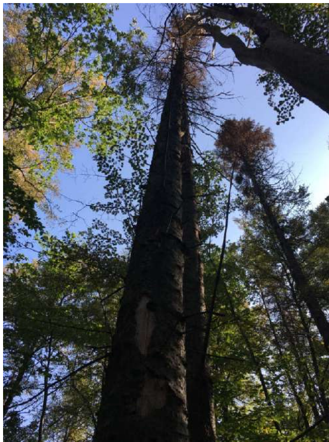
Аварийное дерево №13