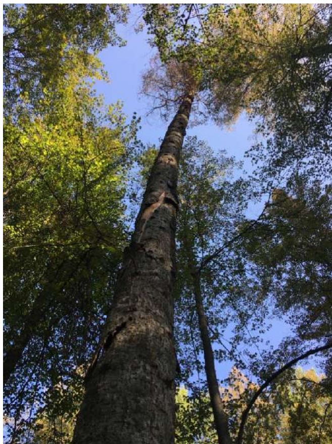
Аварийное дерево №9