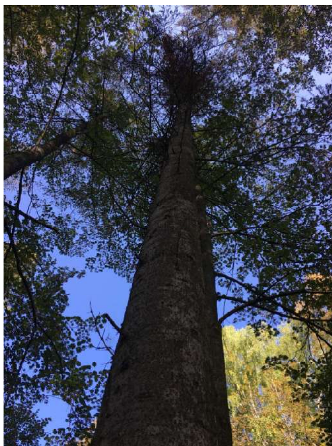
Аварийное дерево №8