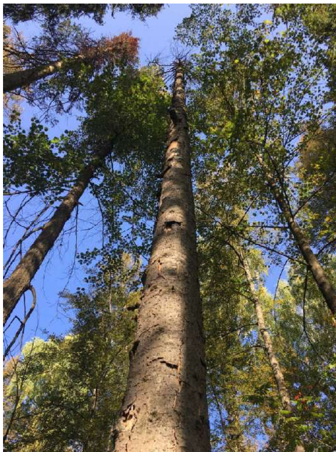
Аварийное дерево №6