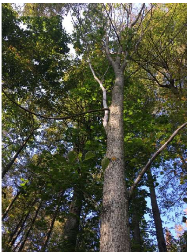
Аварийное дерево №4