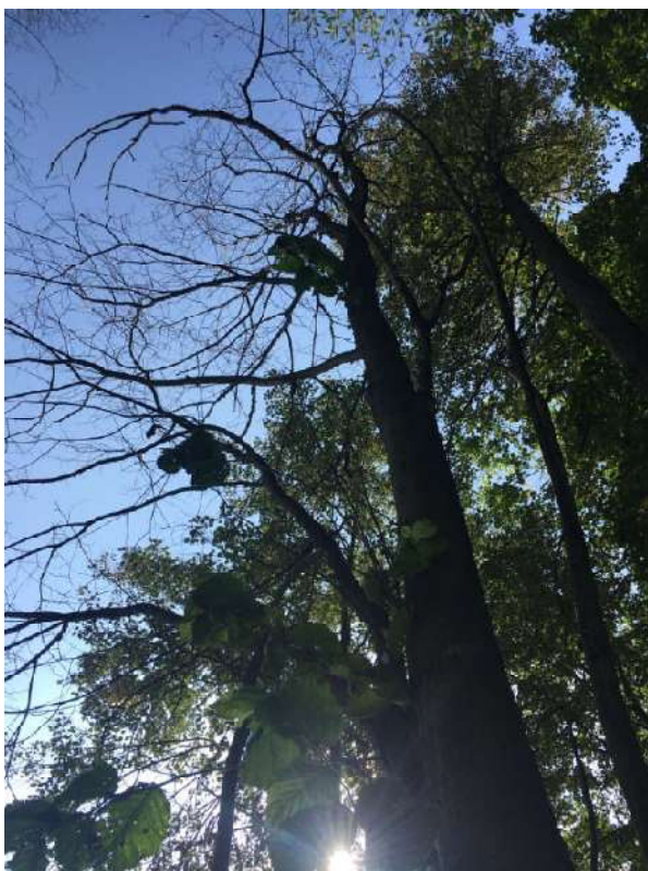
Аварийное дерево №3