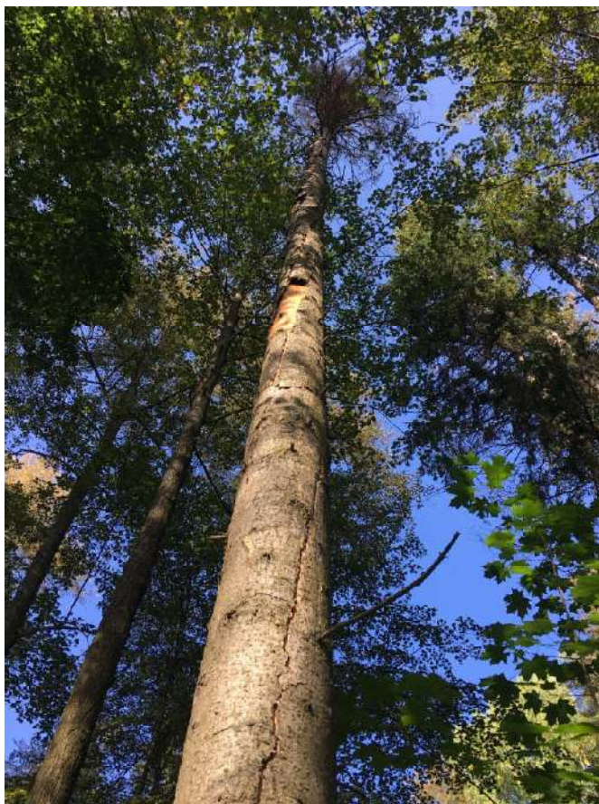
Аварийное дерево №5