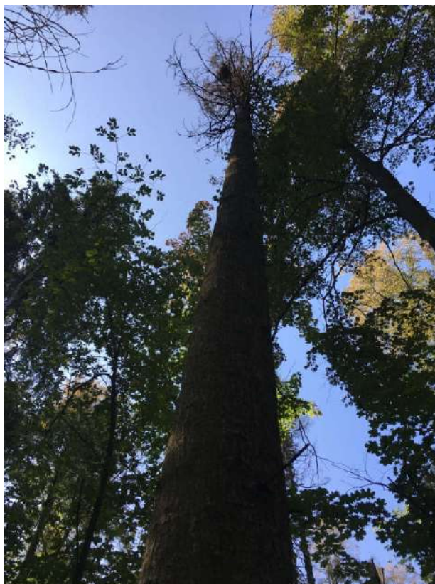
Аварийное дерево №11