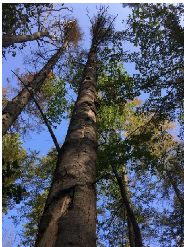
Аварийное дерево №14