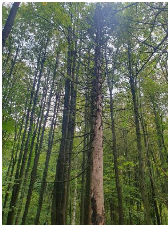
Аварийное дерево №7