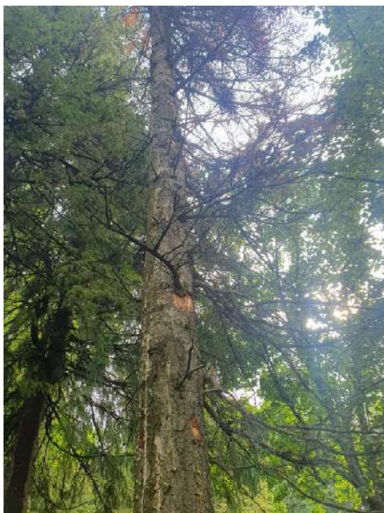
Аварийное дерево №5