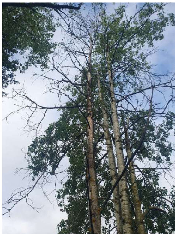
Аварийное дерево №4