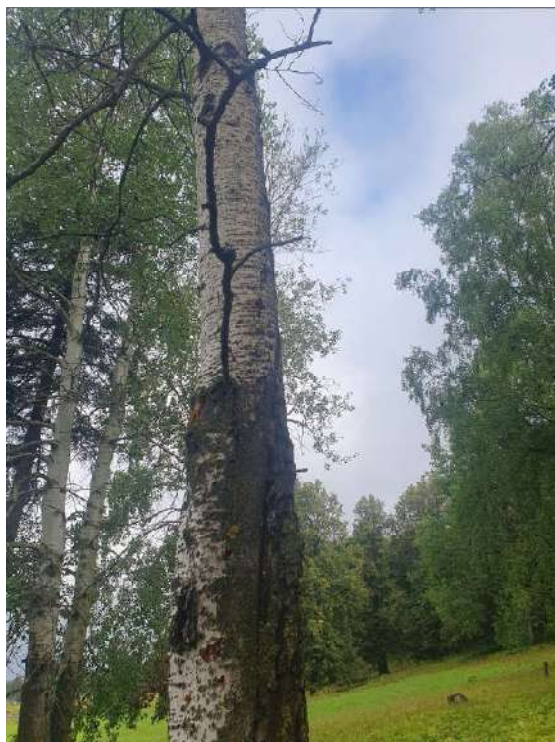
Аварийное дерево №13