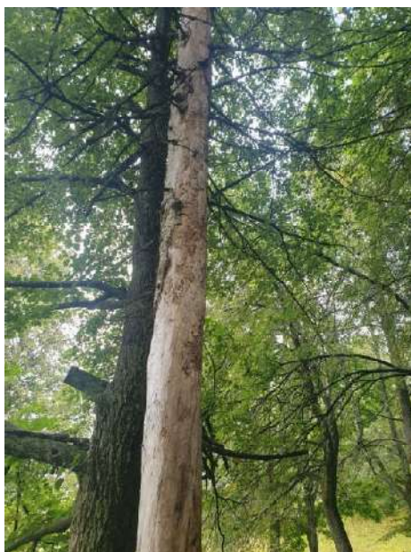
Аварийное дерево №6