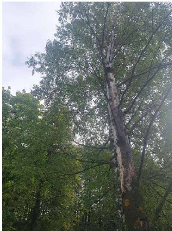
Аварийное дерево №3