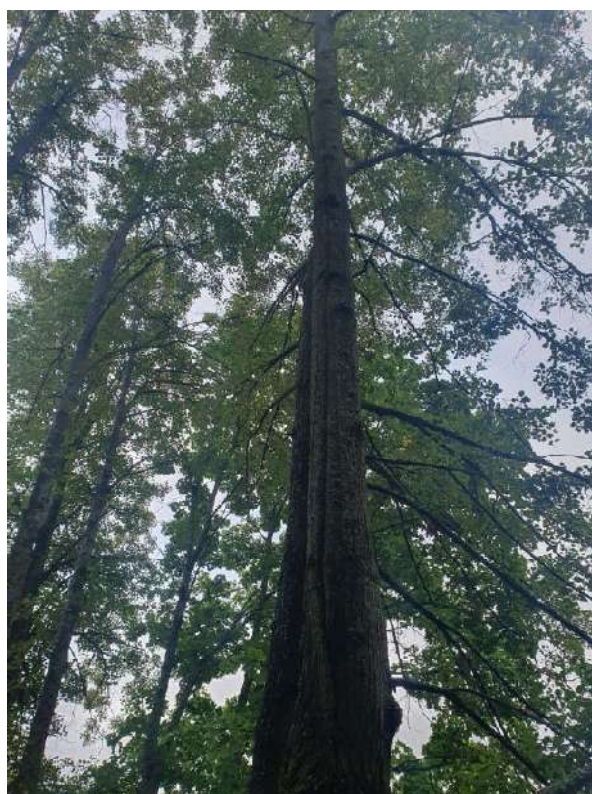
Аварийное дерево №8