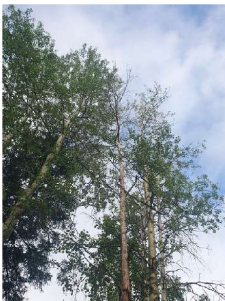
Аварийное дерево №14