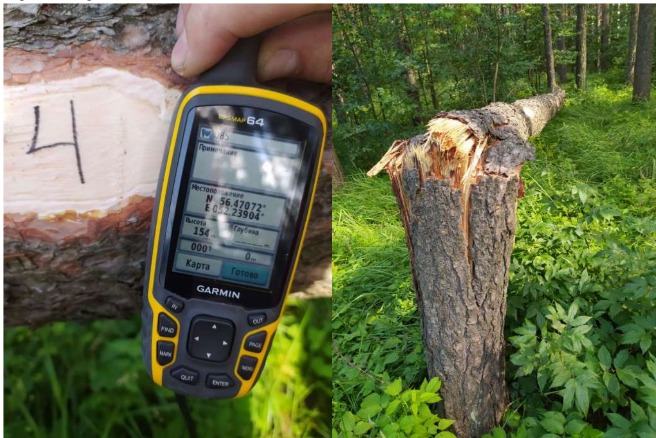
Аварийное дерево № 4