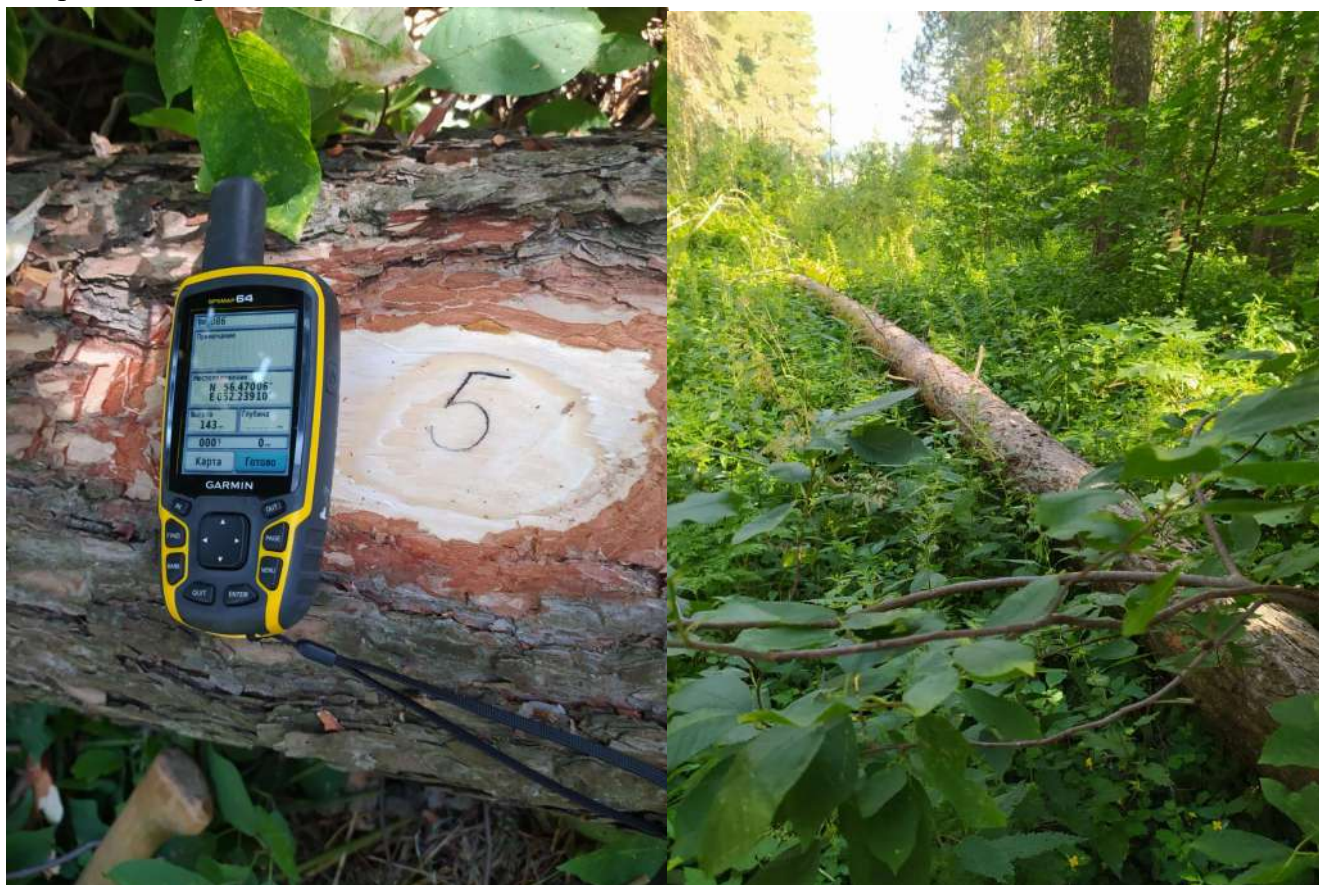
Координаты 56.47006 / 052.23910