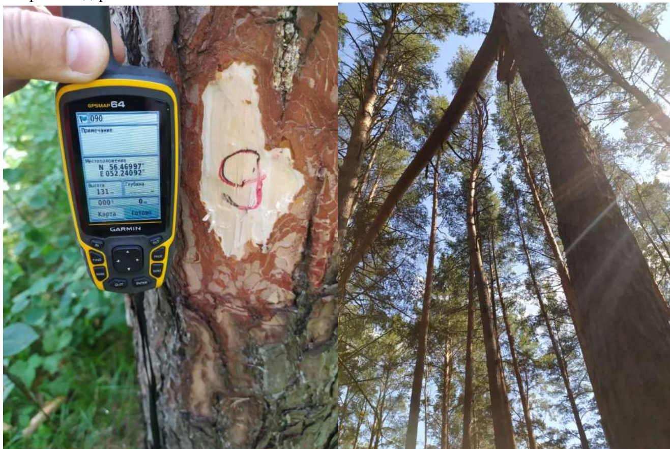
Координаты 56.46997 / 052.24092