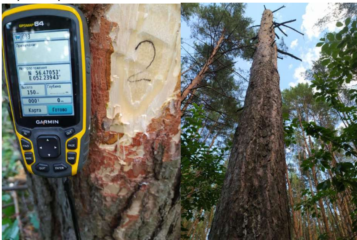
Координаты 56.47053 / 052.23943