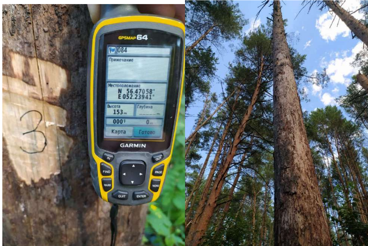
Аварийное дерево № 3