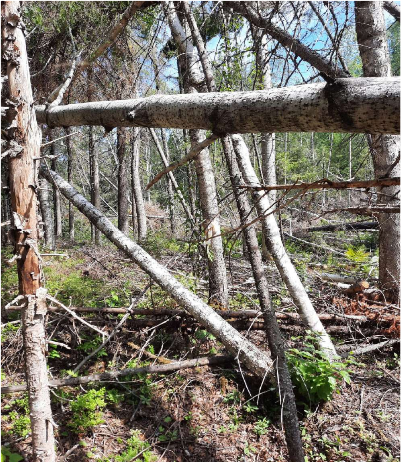
Фото № 2