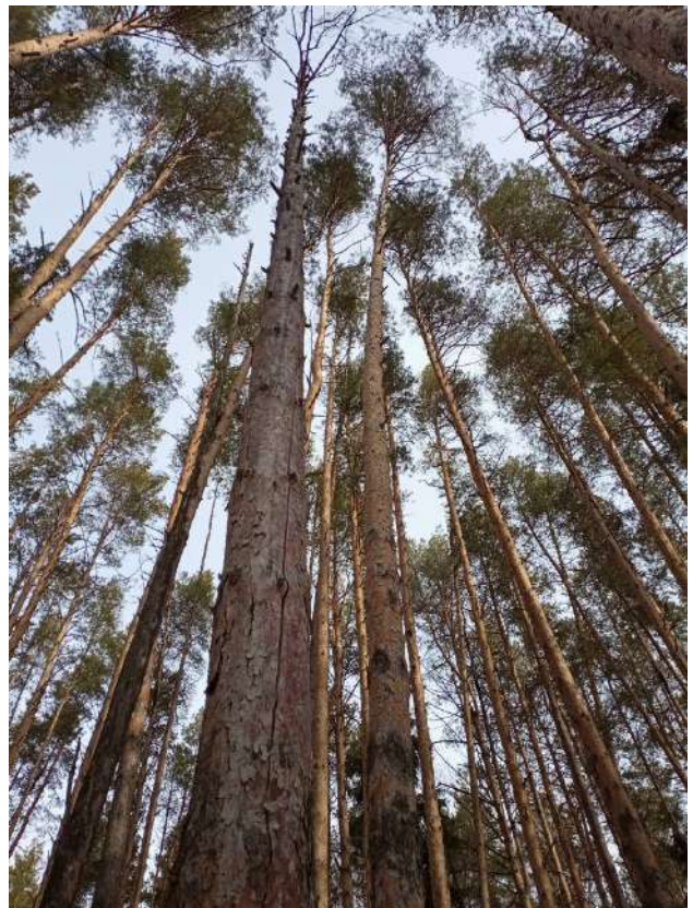
Координаты 56.46011 / 052.21535