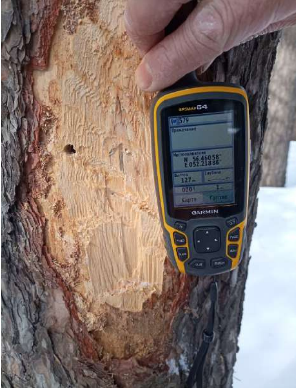
Аварийное дерево № 1