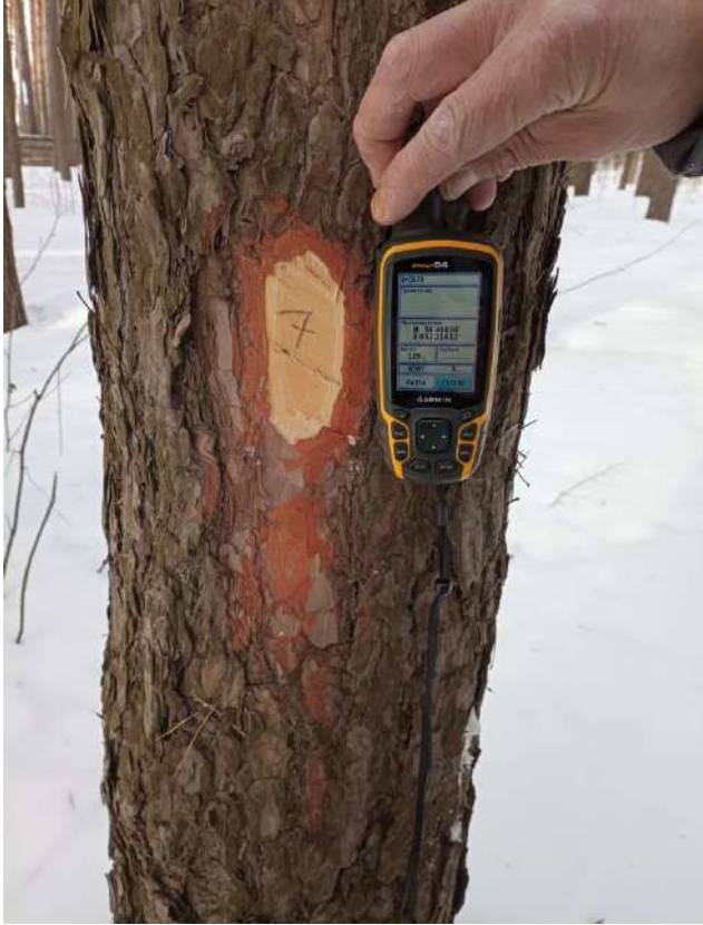
Аварийное дерево № 7