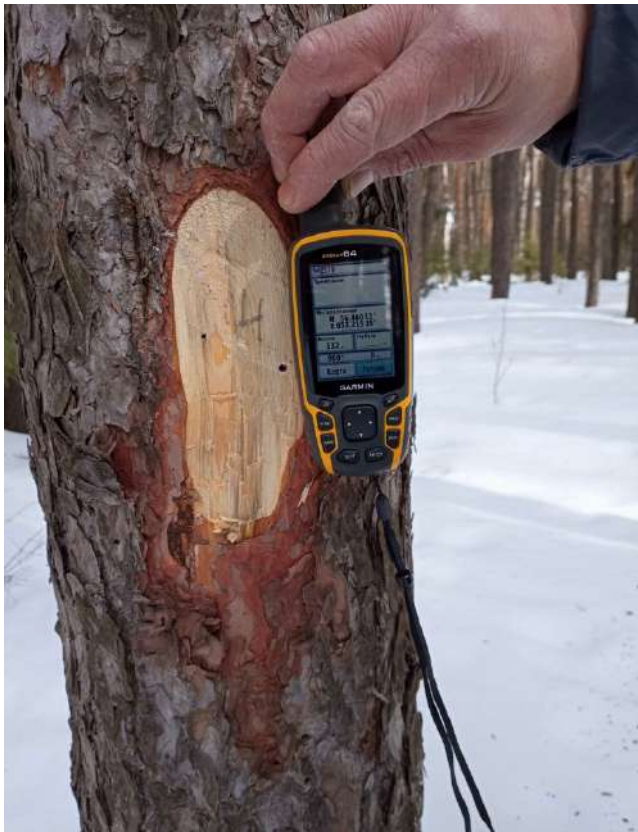
Аварийное дерево № 4