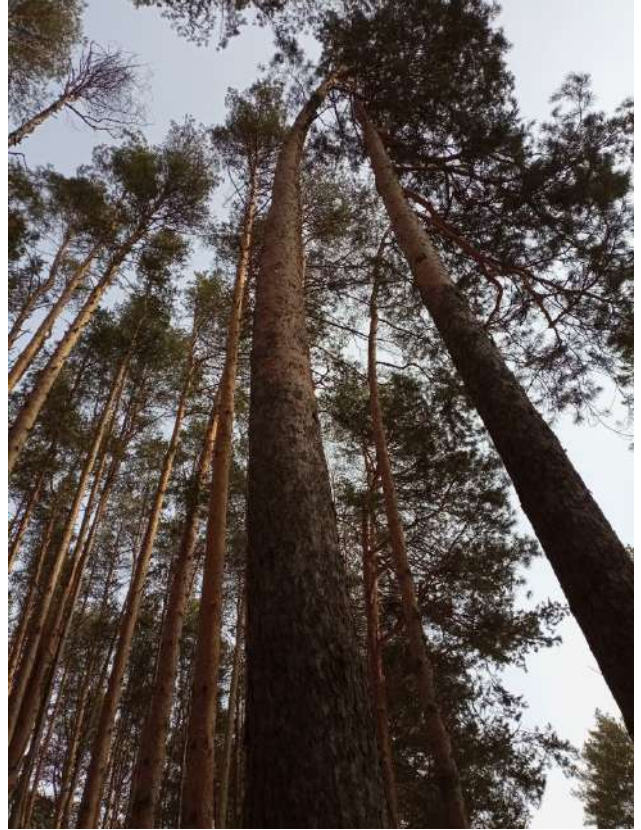
Координаты 56.46006 / 052.21452