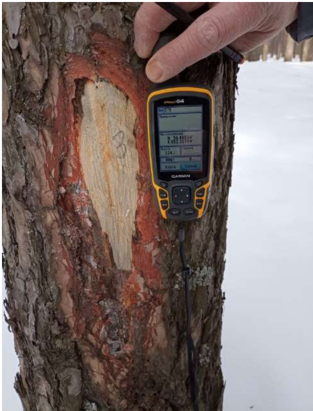
Аварийное дерево № 3