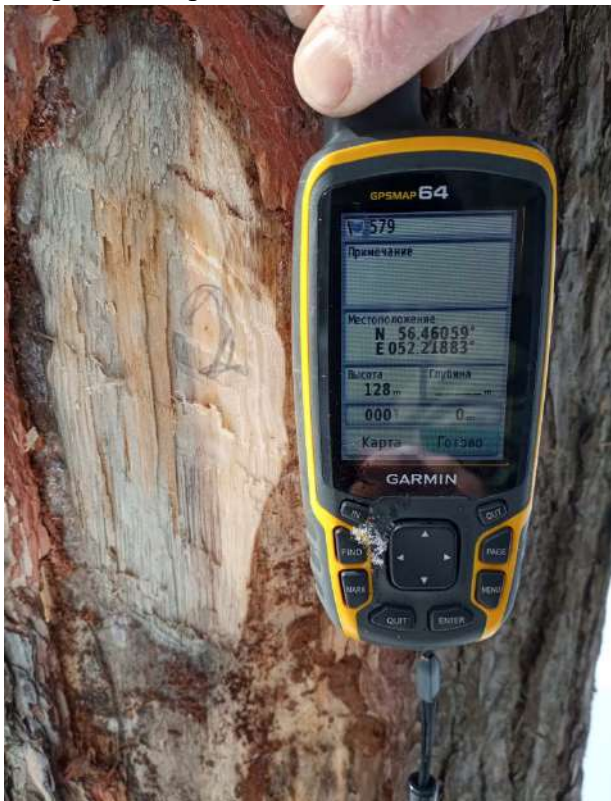
Аварийное дерево № 2