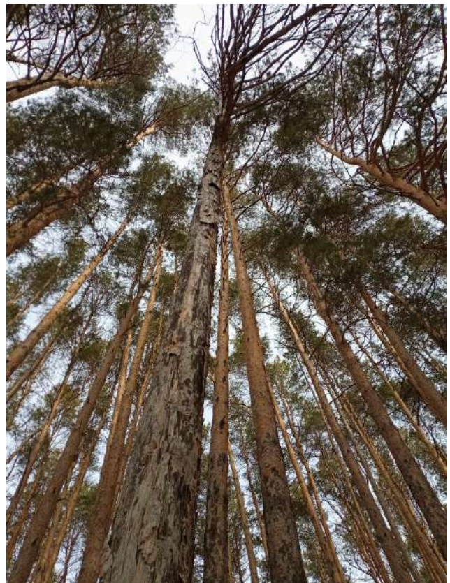
Координаты 56.46007 / 052.21392