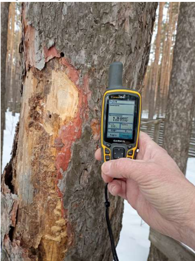
Аварийное дерево № 8