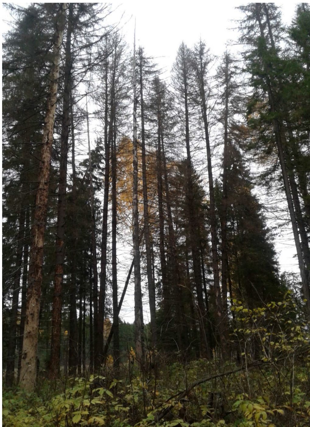
Фото № 3