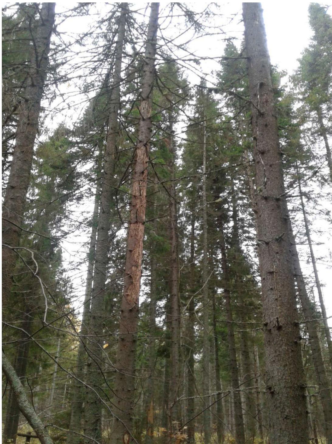
Фото № 2